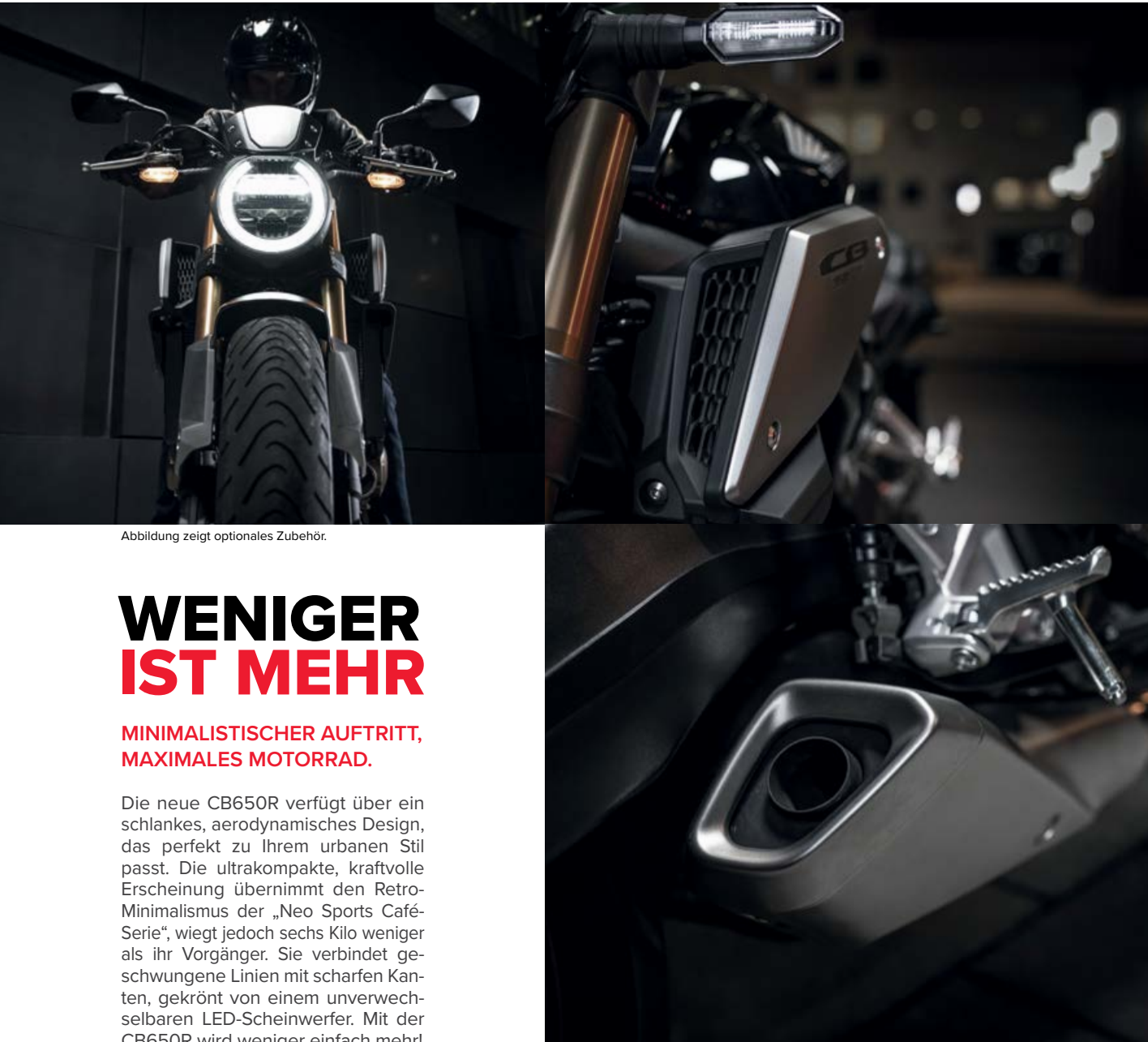
Abbildung zeigt optionales Zubehör.