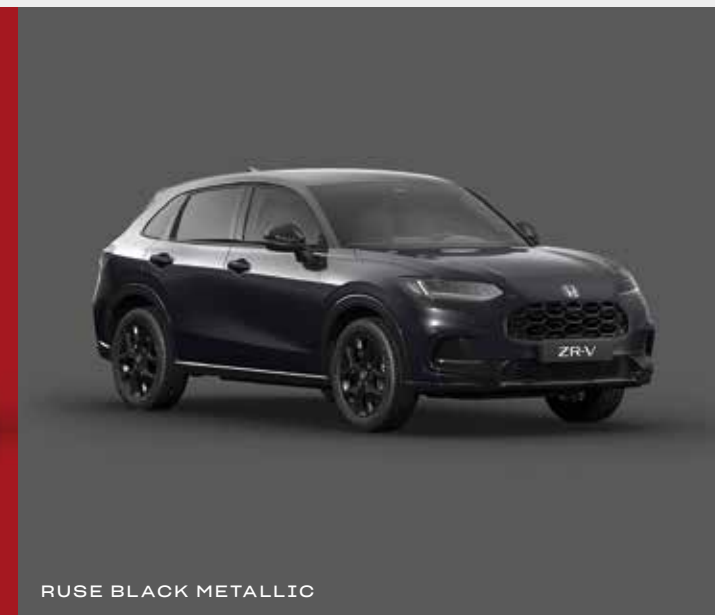
RUSE BLACK METALLIC