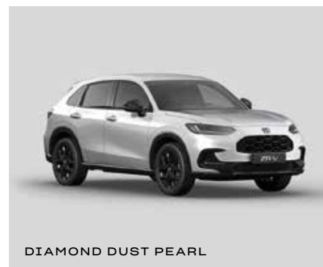
DIAMOND DUST PEARL