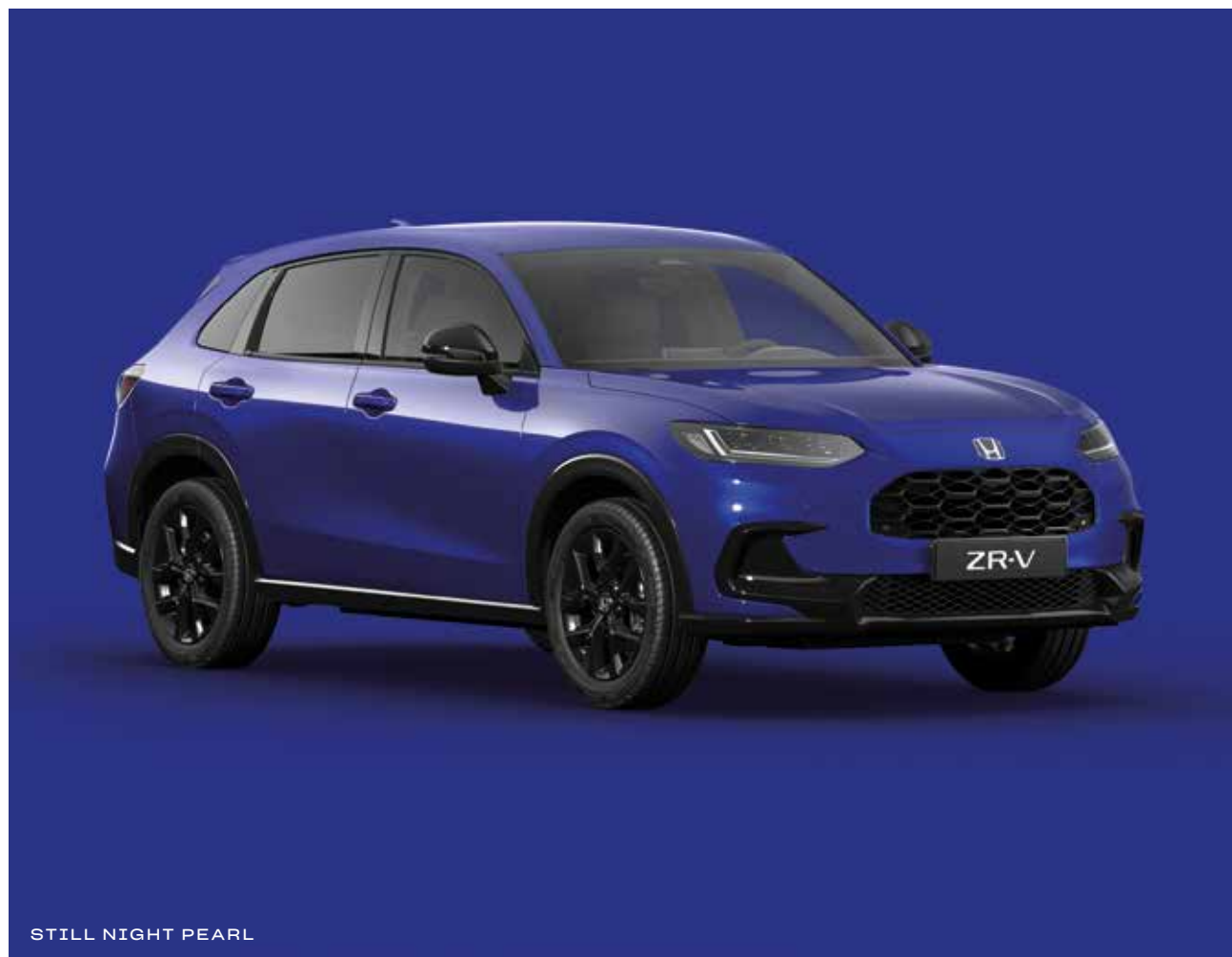
STILL NIGHT PEARL

Passend zur Flexibilität des ZR-V e:HEV bieten wir Ihnen attraktive Lackierungen, mit denen Sie Ihrer Persönlichkeit Ausdruck verleihen können.