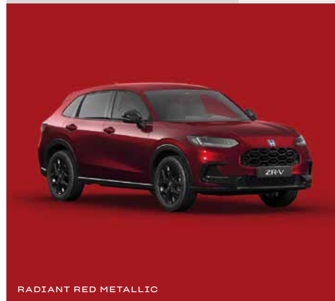
RADIANT RED METALLIC