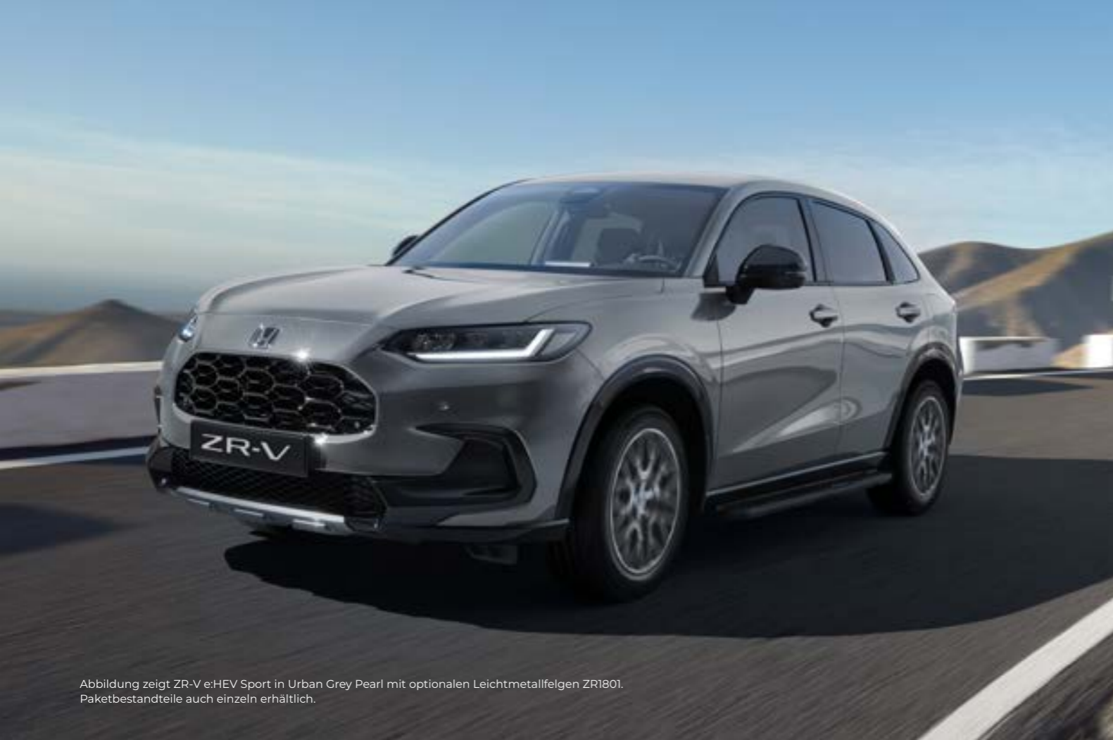
Abbildung zeigt ZR-V e:HEV Sport in Urban Grey Pearl mit optionalen Leichtmetallfelgen ZR1801. Paketbestandteile auch einzeln erhältlich.

Das Paket enthält: Verzierung Frontstoßfänger und Heckklappenverkleidung in Dusk Grey Metallic sowie Trittbretter und Schmutzfänger.