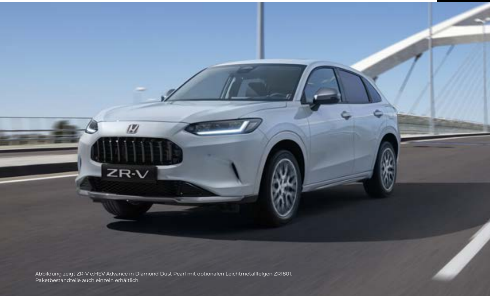
Abbildung zeigt ZR-V e:HEV Advance in Diamond Dust Pearl mit optionalen Leichtmetallfelgen ZR1801. Paketbestandteile auch einzeln erhältlich.

Das Paket enthält: einen Aero-Stoßfänger vorn, Heckklappenverkleidung, Seitenschweller und Außenspiegel-Abdeckungen – jeweils in Dusk Grey Metallic. Ein Heckklappenspoiler in Wagenfarbe verleiht dem ZR-V den letzten Schliff.