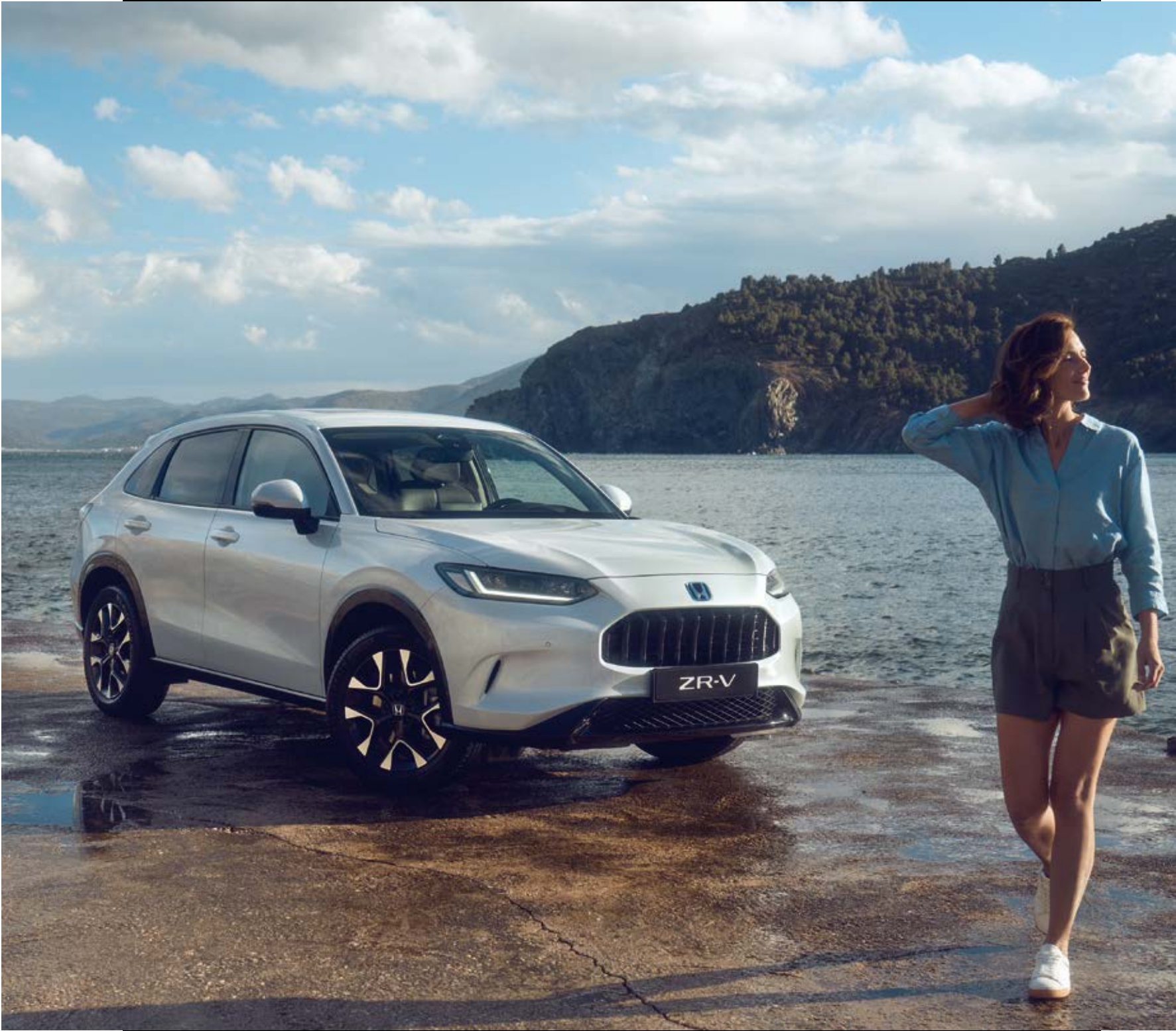
Abbildung zeigt ZR-V Advance in Diamond Dust Pearl.

Warnt beim Rückwärts-Ausparken vor sich von den Seiten nähernden Fahrzeugen, um einer Kollision vorzubeugen.