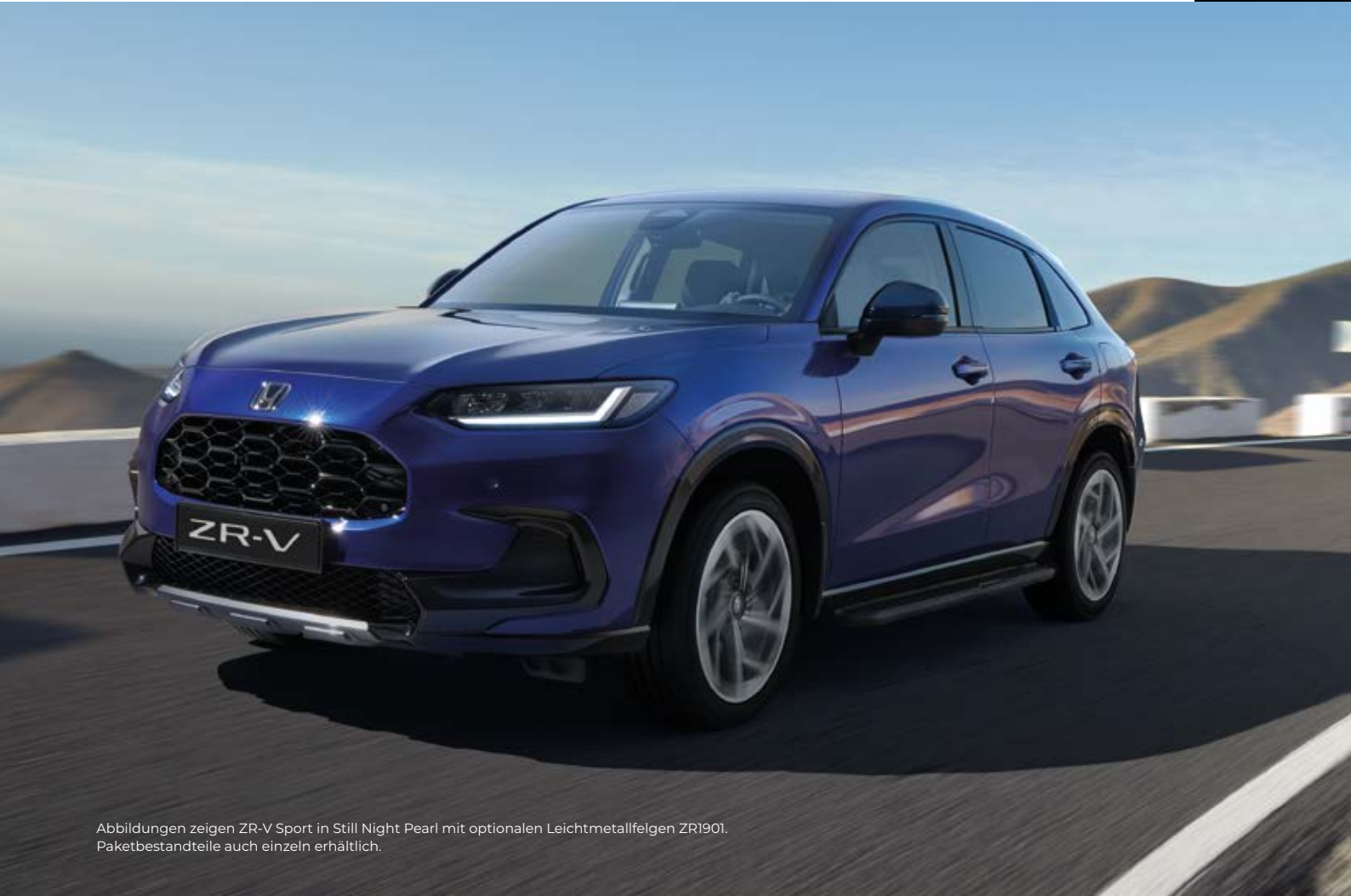
Abbildungen zeigen ZR-V Sport in Still Night Pearl mit optionalen Leichtmetallfelgen ZR1901. Paketbestandteile auch einzeln erhältlich.

Der Name sagt es bereits: Es ist das perfekte Paket für Abenteurer, die gerne die landschaftlich reizvolle Route nehmen. Das Paket enthält: Verzierung Frontstoßfänger und Heckklappenverkleidung in Dusk Grey Metallic sowie Trittbretter und Schmutzfänger.