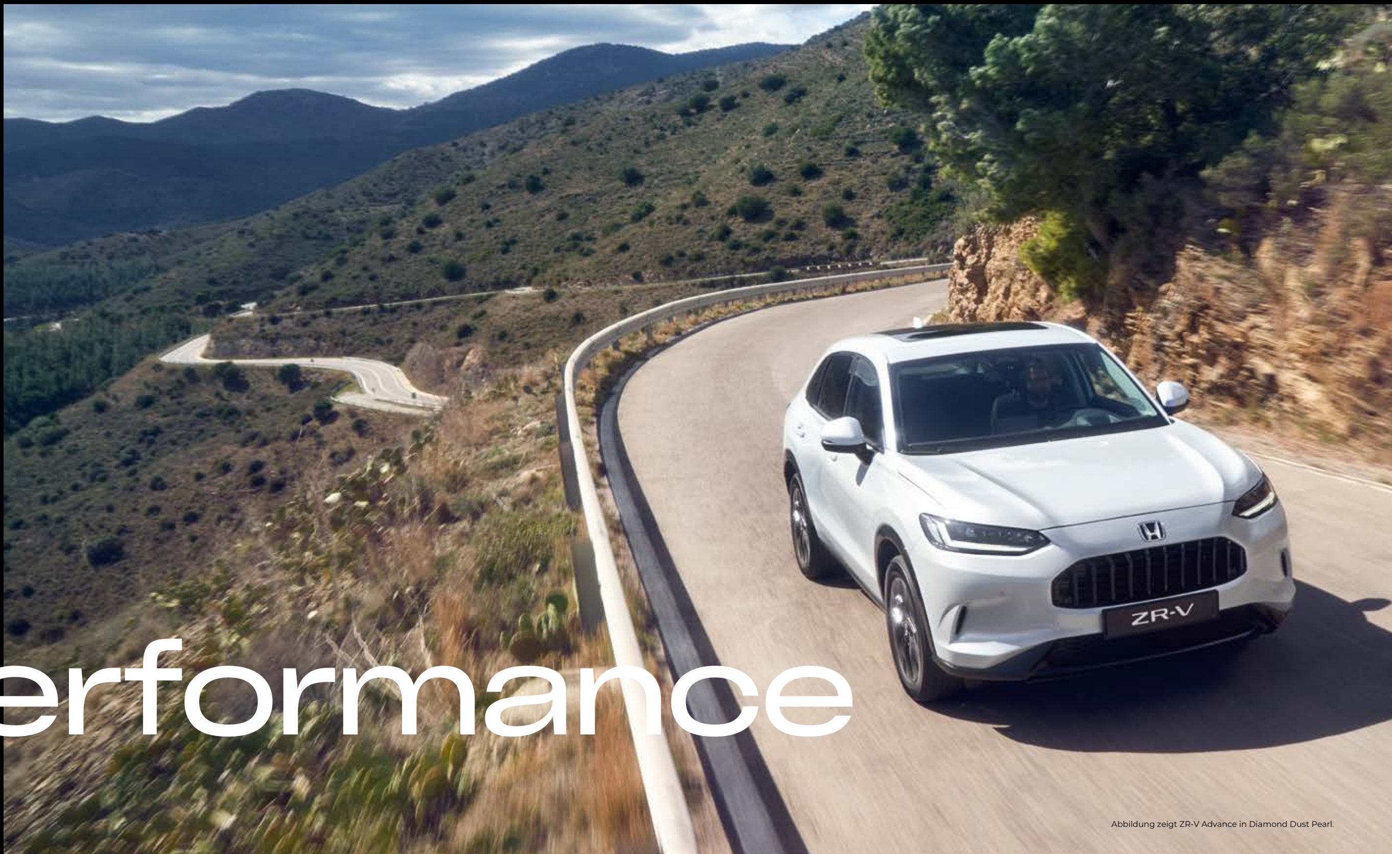
Abbildung zeigt ZR-V Advance in Diamond Dust Pearl.