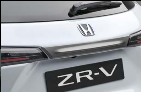
HECKKLAPPENVERKLEIDUNG Unterstreichen Sie den Premium-Look Ihres Fahrzeugs mit dieser attraktiven Heckklappenverkleidung.