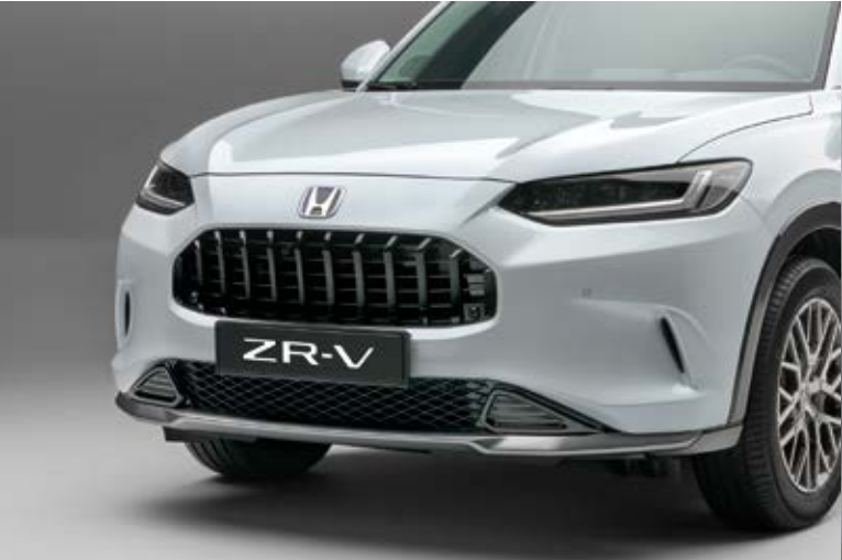
AERO-STOSSFÄNGER Betonen Sie das dynamische Styling Ihres ZR-V mit unserem unverwechselbaren Aero-Stoßfänger.