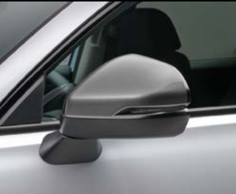
AUSSENSPIEGEL-ABDECKUNGEN Verleihen Sie Ihrem Auto mehr Individualität mit diesen eleganten Außenspiegel-Abdeckungen, die sich nahtlos ins Design des ZR-V einfügen.