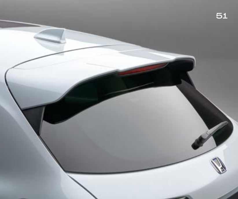
HECKKLAPPENSPOILER Unser Heckklappenspoiler in Wagenfarbe wurde entwickelt, um die Dachlinien aufzugreifen und den sportlichen Look zu betonen.