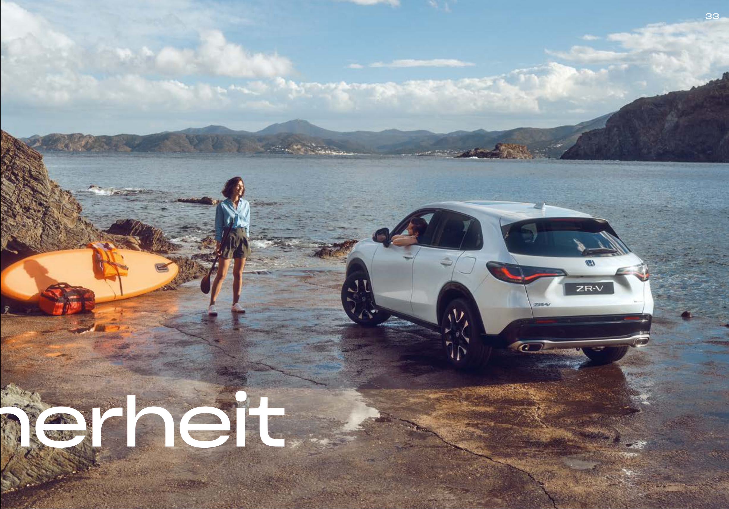
Abbildung zeigt ZR-V Advance in Diamond Dust Pearl.