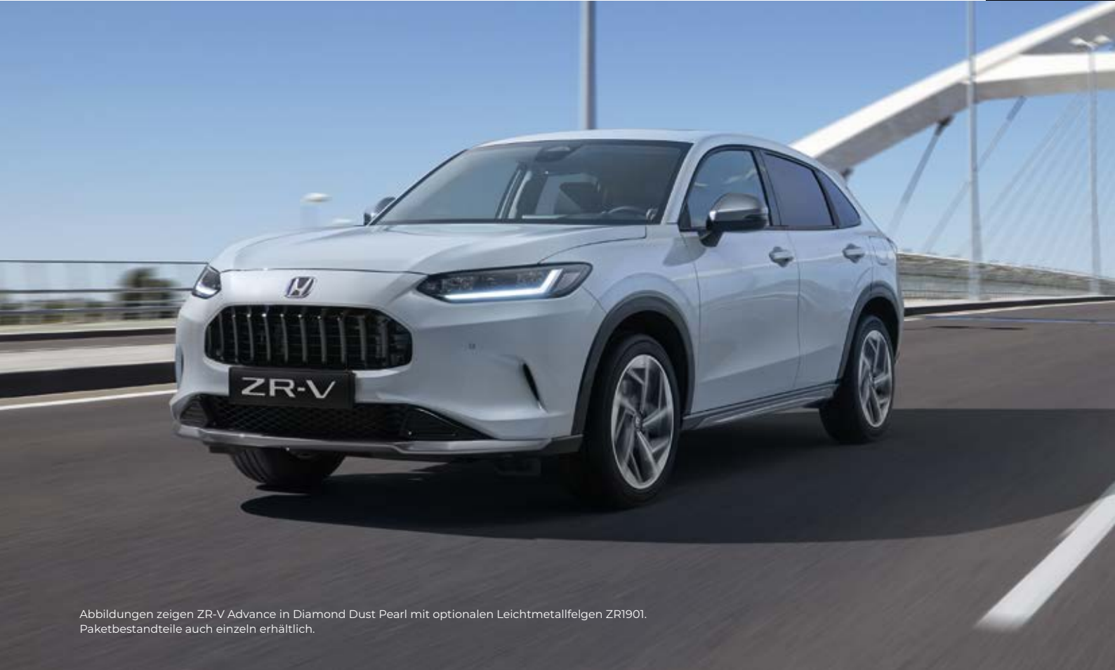
Abbildungen zeigen ZR-V Advance in Diamond Dust Pearl mit optionalen Leichtmetallfelgen ZR1901. Paketbestandteile auch einzeln erhältlich.

Das Aero-Paket wurde speziell entwickelt, um das dynamische Aussehen und Fahrgefühl des ZR-V zu unterstreichen. Das Paket enthält: einen Aero-Stoßfänger vorn, Heckklappenverkleidung, Seitenschweller und Außenspiegel-Abdeckungen – jeweils in Dusk Grey Metallic. Ein Heckklappenspoiler in Wagenfarbe verleiht dem ZR-V den letzten Schliff.