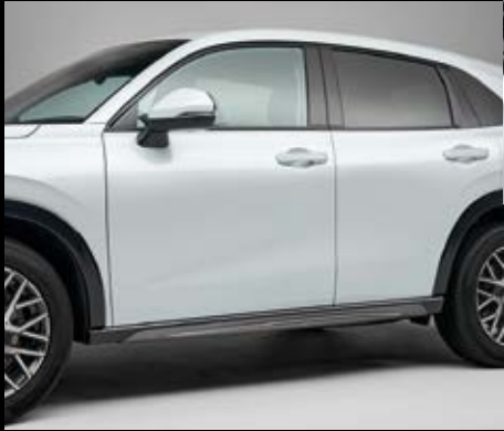
SEITENSCHWELLER Geben Sie Ihrem ZR-V ein sportliches Profil mit diesen stilvollen, schnittigen Seitenschwellern.