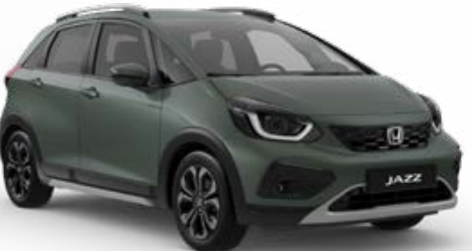
Sage Green Pearl