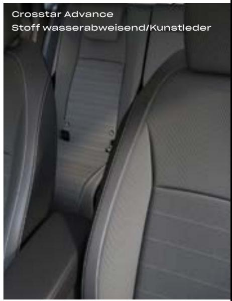
Crosstar Advance Stoff wasserabweisend/Kunstleder