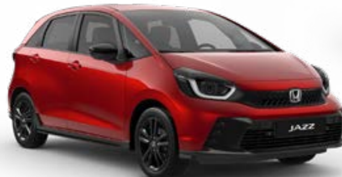
Premium Crystal Red Metallic