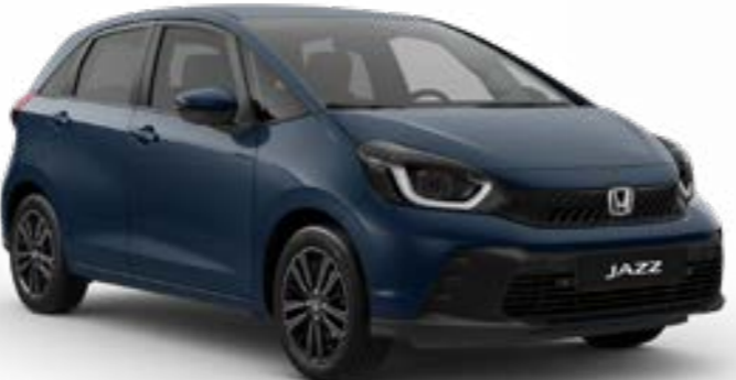
Seabed Blue Pearl