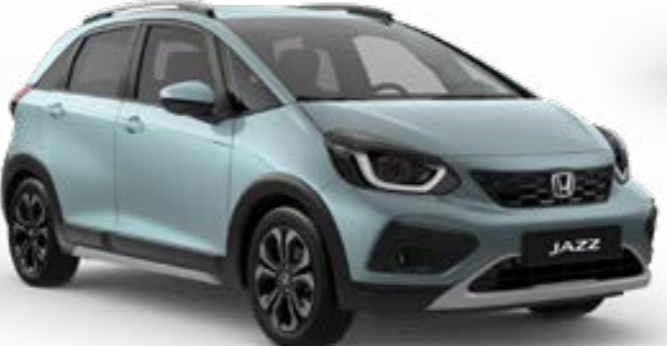
Fjord Mist Pearl