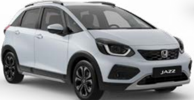
Premium Sunlight White Pearl