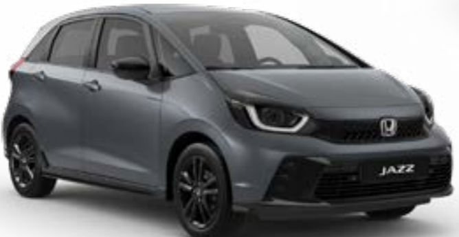
Urban Grey Pearl

Wir haben eine breite Palette an Farben kreiert, die perfekt zum stilvollen Jazz und zu Ihrem Lifestyle passen.