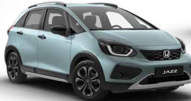
Fjord Mist Pearl