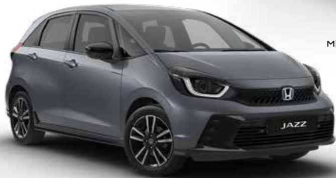
Urban Grey Pearl