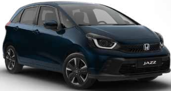
Midnight Blue Beam Metallic

Wir haben eine breite Palette an Farben kreiert, die perfekt zum stilvollen Jazz und zu Ihrem Lifestyle passen.