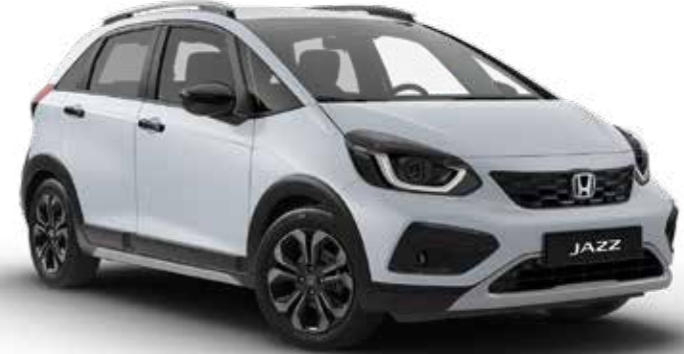
Premium Sunlight White Pearl