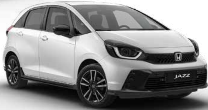
Platinum White Pearl