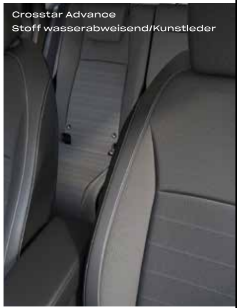
Crosstar Advance Stoff wasserabweisend/Kunstleder