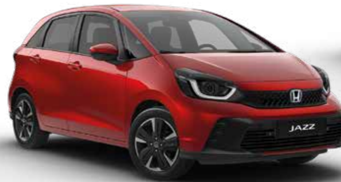
Premium Crystal Red Metallic