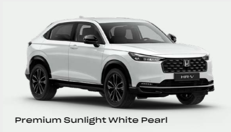
Premium Sunlight White Pearl