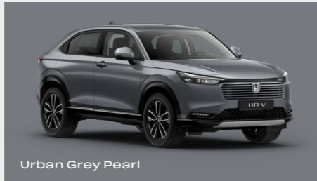
Urban Grey Pearl