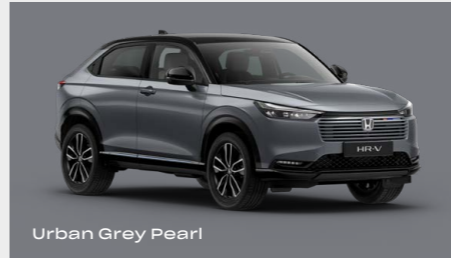
Urban Grey Pearl