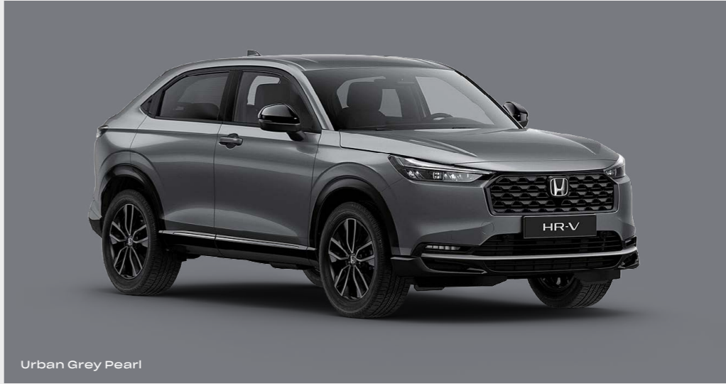
Urban Grey Pearl