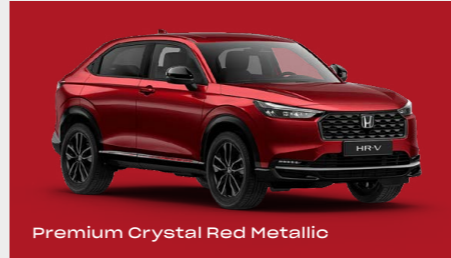
Premium Crystal Red Metallic