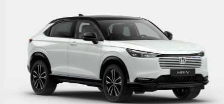
Premium Sunlight White Pearl