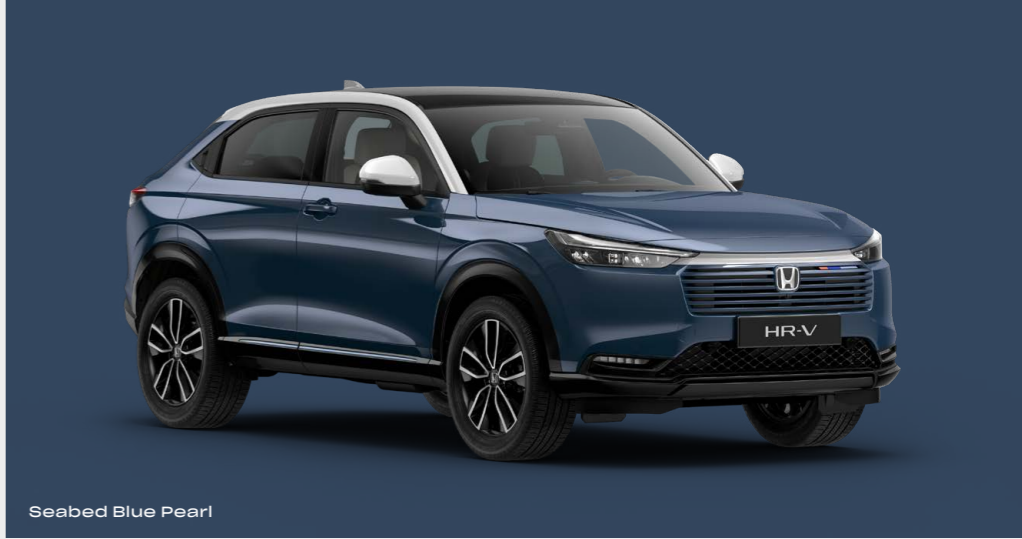
Seabed Blue Pearl