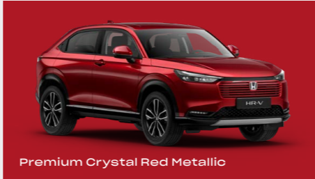
Premium Crystal Red Metallic