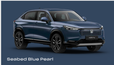
Seabed Blue Pearl