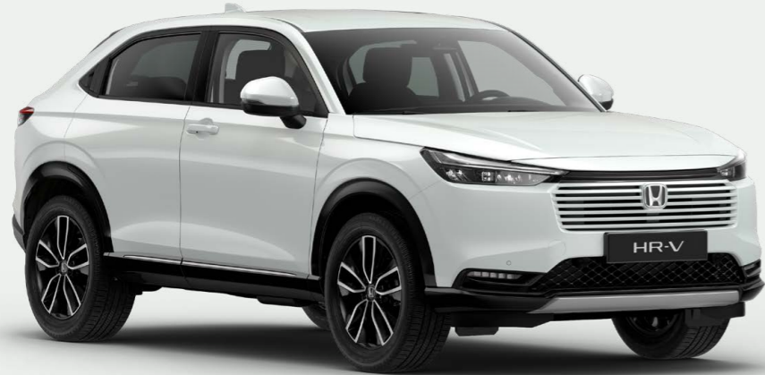
Premium Sunlight White Pearl