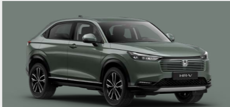
Sage Green Pearl