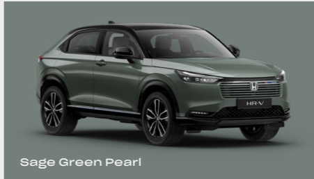
Sage Green Pearl