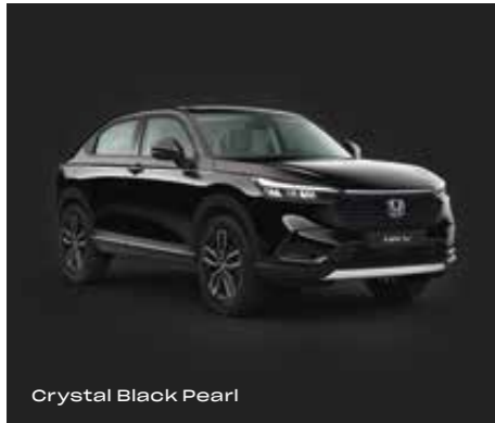
Crystal Black Pearl