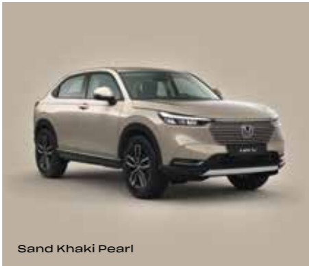
Sand Khaki Pearl