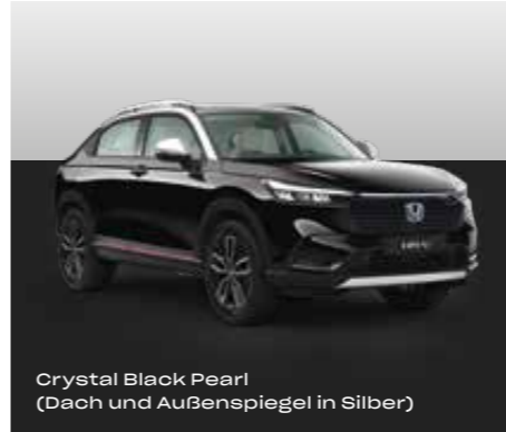
Crystal Black Pearl (Dach und Außenspiegel in Silber)