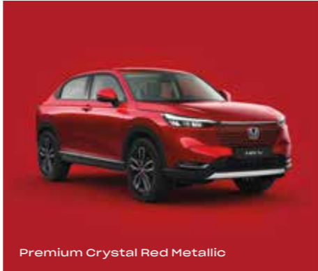
Premium Crystal Red Metallic