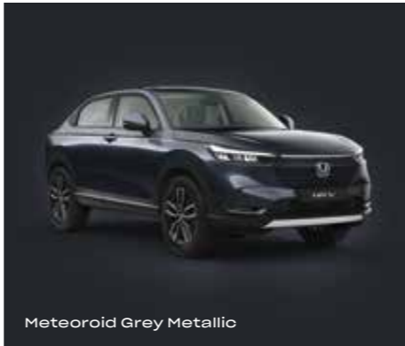
Meteoroid Grey Metallic