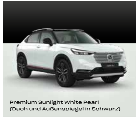
Premium Sunlight White Pearl (Dach und Außenspiegel in Schwarz)