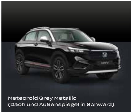
Meteoroid Grey Metallic (Dach und Außenspiegel in Schwarz)