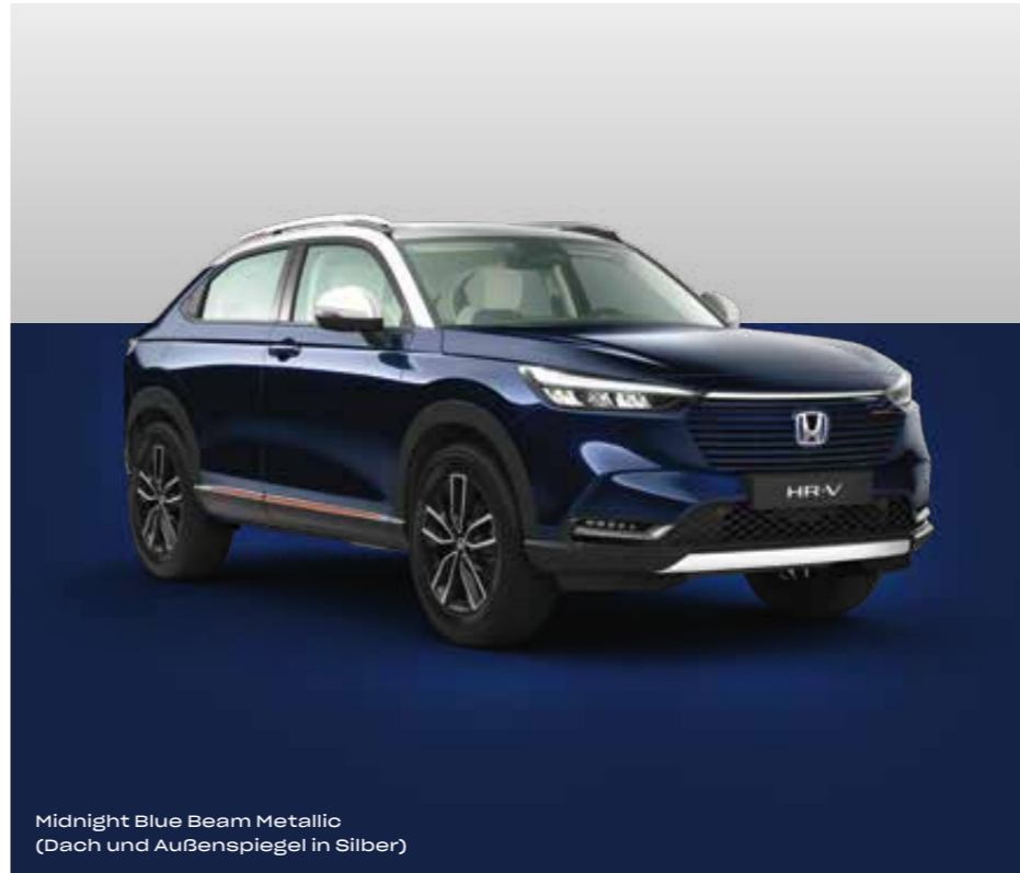
Midnight Blue Beam Metallic (Dach und Außenspiegel in Silber)