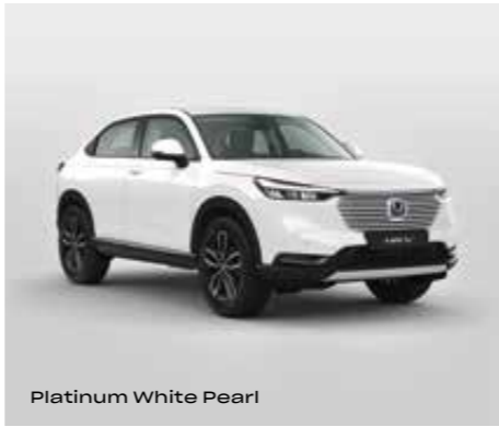
Platinum White Pearl