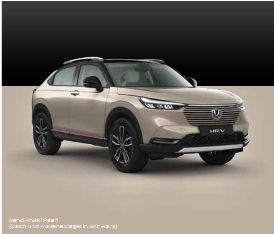
Sand Khaki Pearl (Dach und Außenspiegel in Schwarz)