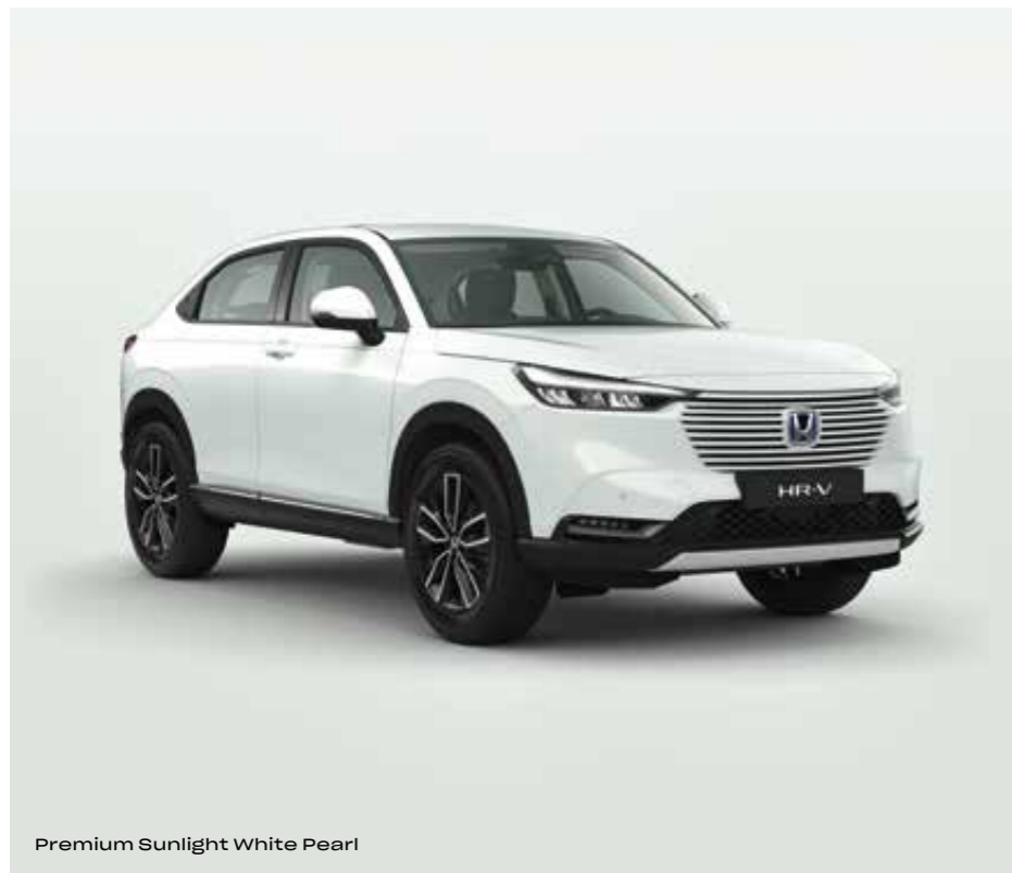
Premium Sunlight White Pearl