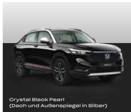
Crystal Black Pearl (Dach und Außenspiegel in Silber)