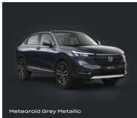
Meteoroid Grey Metallic