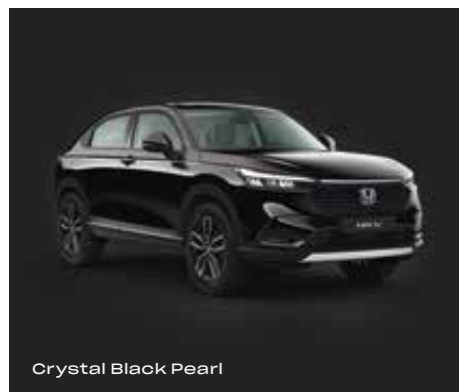
Crystal Black Pearl