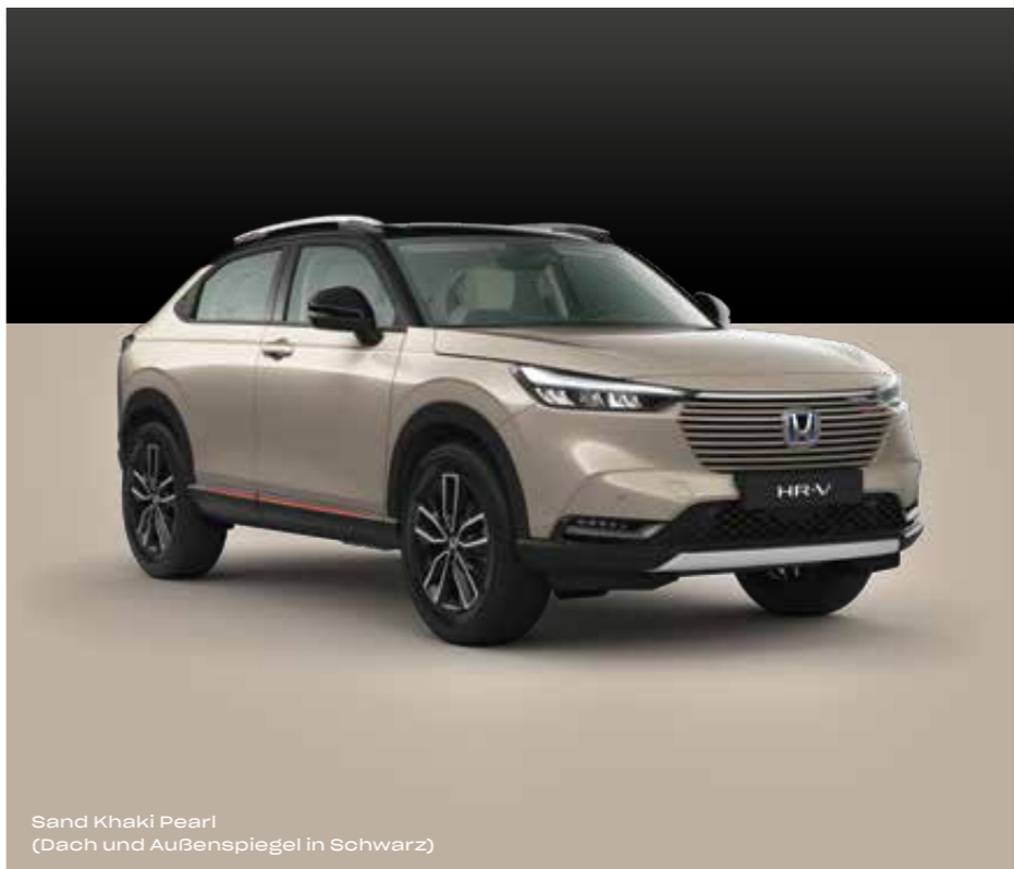
Sand Khaki Pearl (Dach und Außenspiegel in Schwarz)