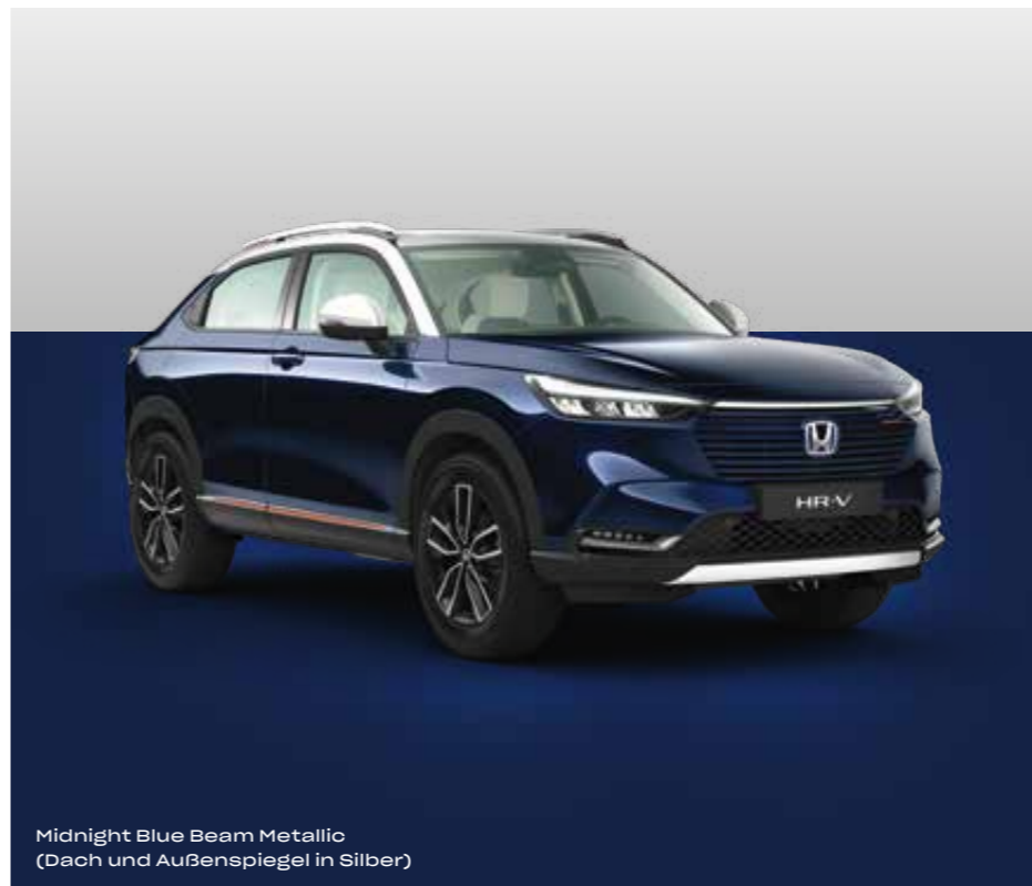
Midnight Blue Beam Metallic (Dach und Außenspiegel in Silber)