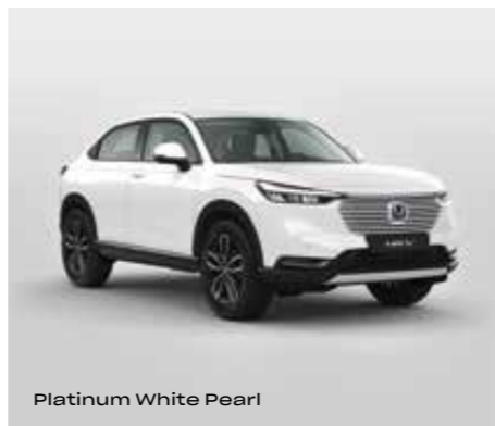
Platinum White Pearl