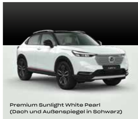
Premium Sunlight White Pearl (Dach und Außenspiegel in Schwarz)