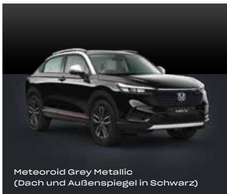
Meteoroid Grey Metallic (Dach und Außenspiegel in Schwarz)