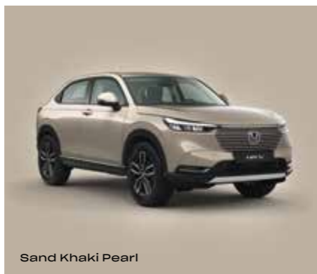
Sand Khaki Pearl