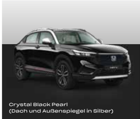
Crystal Black Pearl (Dach und Außenspiegel in Silber)