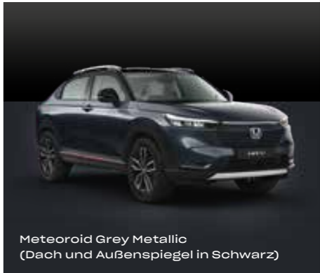
Meteoroid Grey Metallic (Dach und Außenspiegel in Schwarz)