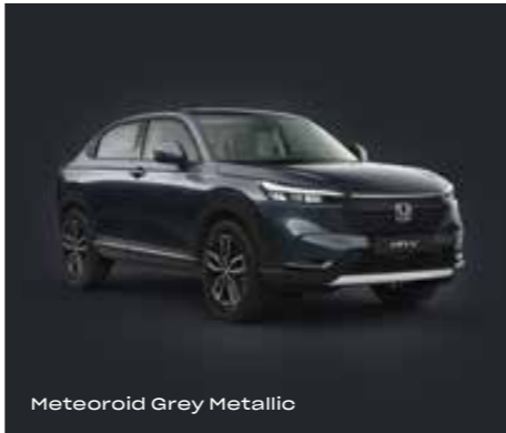
Meteoroid Grey Metallic