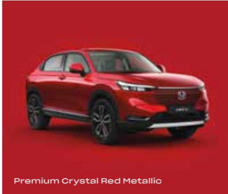
Premium Crystal Red Metallic