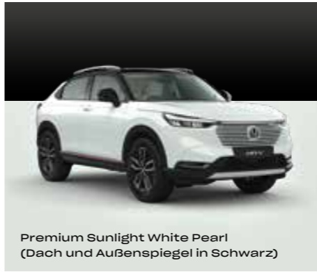
Premium Sunlight White Pearl (Dach und Außenspiegel in Schwarz)