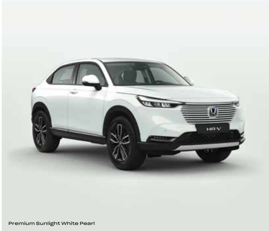
Premium Sunlight White Pearl