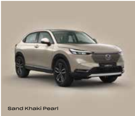
Sand Khaki Pearl