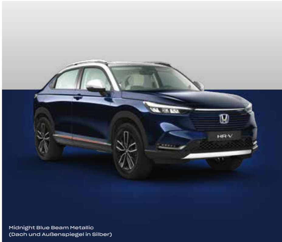
Midnight Blue Beam Metallic (Dach und Außenspiegel in Silber)