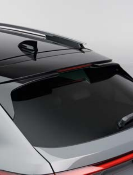
DACHSPOILER-ERWEITERUNG Wenn Sie einen sportlichen Look bevorzugen, ist die Honda Original-Dachspoiler-Erweiterung genau das Richtige für Sie.