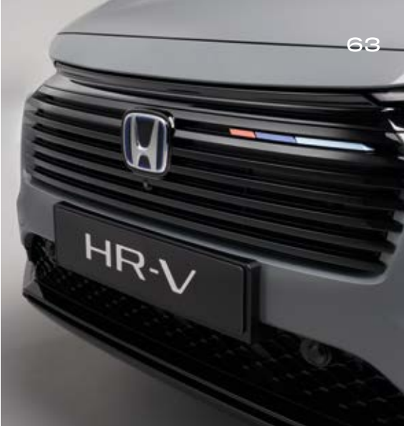
SCHWARZER KÜHLERGRILL Verändern Sie die komplette Front Ihres HR-V, indem Sie den serienmäßigen Kühlergrill in Wagenfarbe durch einen in Berlina Black lackierten Kühlergrill ersetzen.