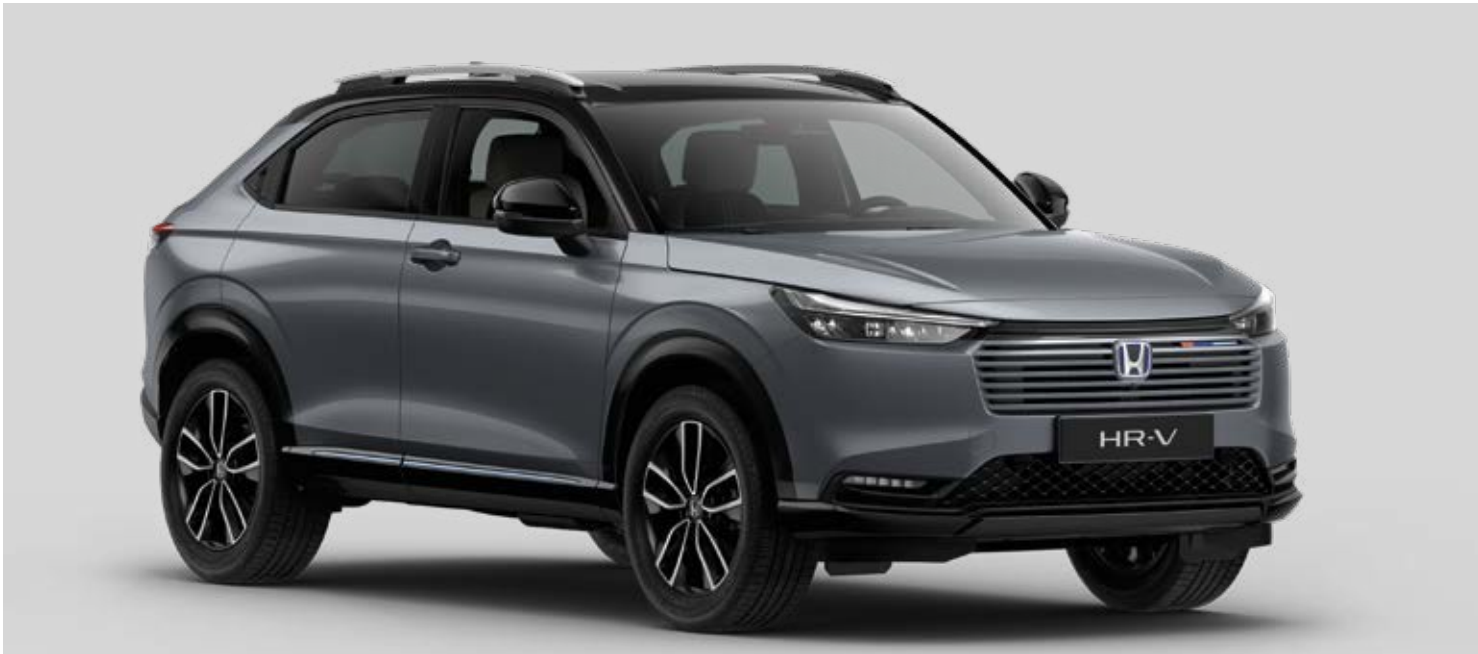
Abbildungen zeigen HR-V e:HEV Advance Style in Urban Grey Pearl. (Zweifarbblackierung, Dach und Außenspiegel in Schwarz). Kraftstoffverbrauch HR-V e:HEV Advance Style in l/100 km: kombiniert 5,4. CO 2 -Emissionen in g/km: kombiniert 122. CO 2 -Klasse: D.

Eine vollständige Übersicht aller Ausstattungsmerkmale finden Sie in der Preisliste für den HR-V.