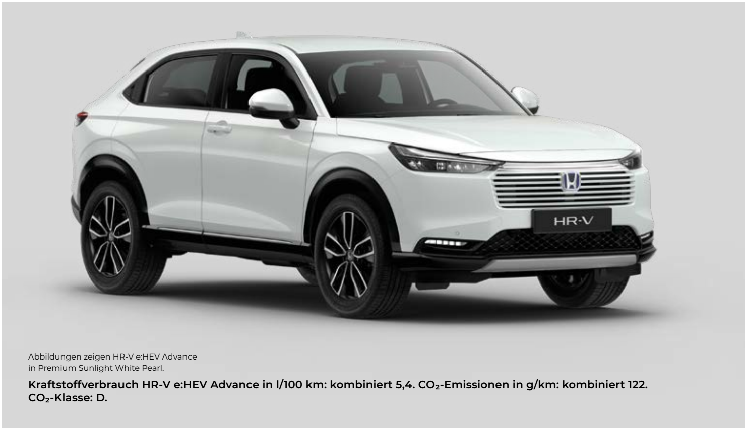
Abbildungen zeigen HR-V e:HEV Advance in Premium Sunlight White Pearl. Kraftstoffverbrauch HR-V e:HEV Advance in l/100 km: kombiniert 5,4. CO 2 -Emissionen in g/km: kombiniert 122. CO 2 -Klasse: D.