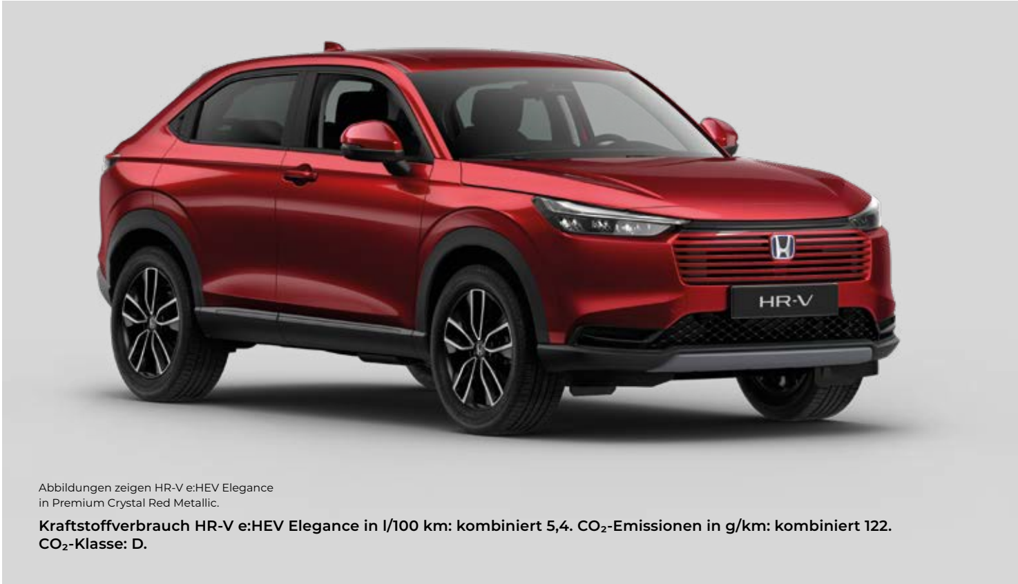
Abbildungen zeigen HR-V e:HEV Elegance in Premium Crystal Red Metallic. Kraftstoffverbrauch HR-V e:HEV Elegance in l/100 km: kombiniert 5,4. CO 2 -Emissionen in g/km: kombiniert 122. CO 2 -Klasse: D.