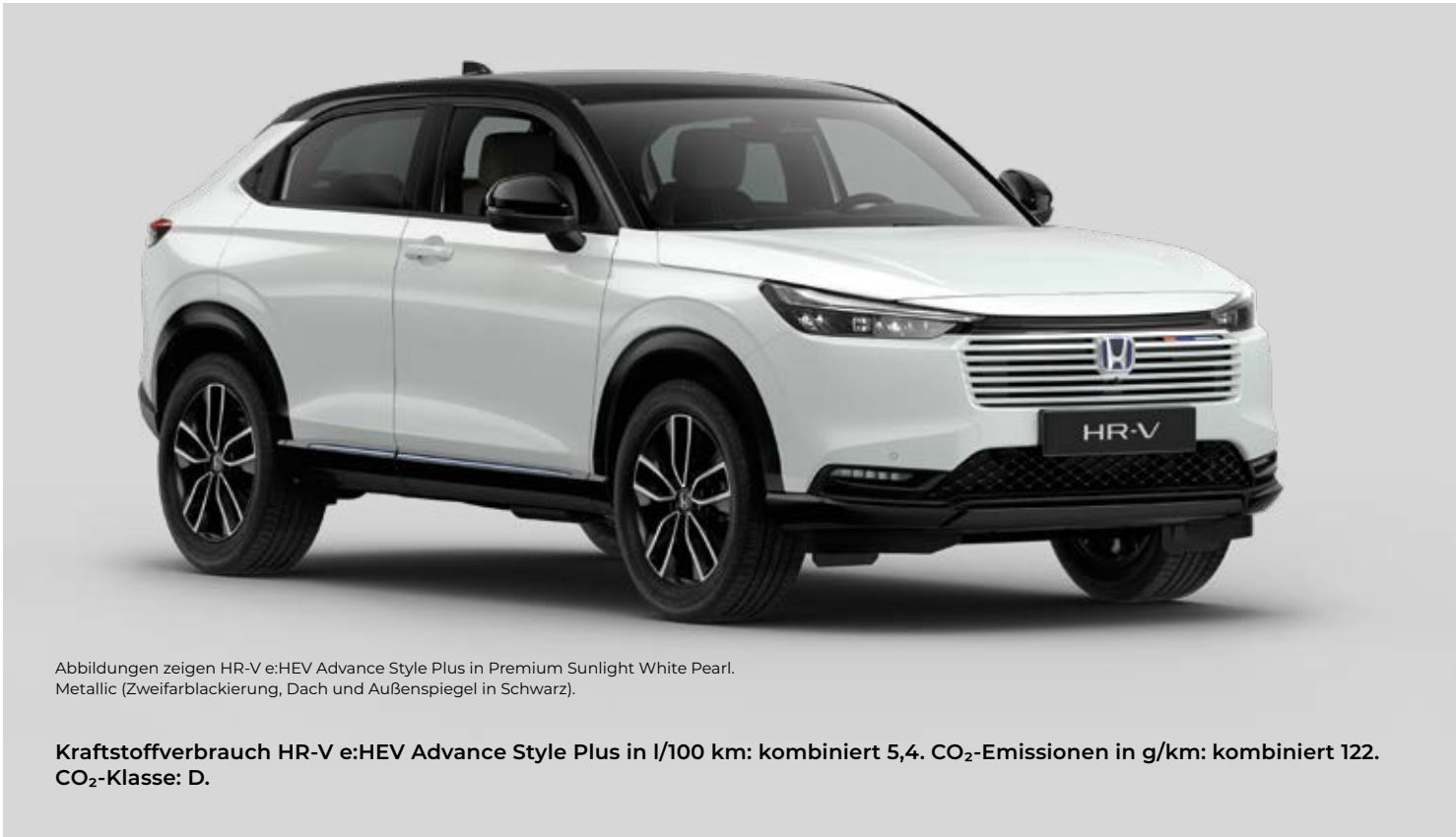
Abbildungen zeigen HR-V e:HEV Advance Style Plus in Premium Sunlight White Pearl. Metallic (Zweifarbblackierung, Dach und Außenspiegel in Schwarz).

Kraftstoffverbrauch HR-V e:HEV Advance Style Plus in l/100 km: kombiniert 5,4. CO 2 -Emissionen in g/km: kombiniert 122. CO 2 -Klasse: D.