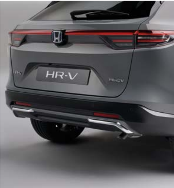
HECKDIFFUSOR SPORT Genauso wie der Sport-Frontstoßfänger verfügt der Heckdiffusor Sport über einen Chrom-Akzent und betont das dynamische Auftreten.