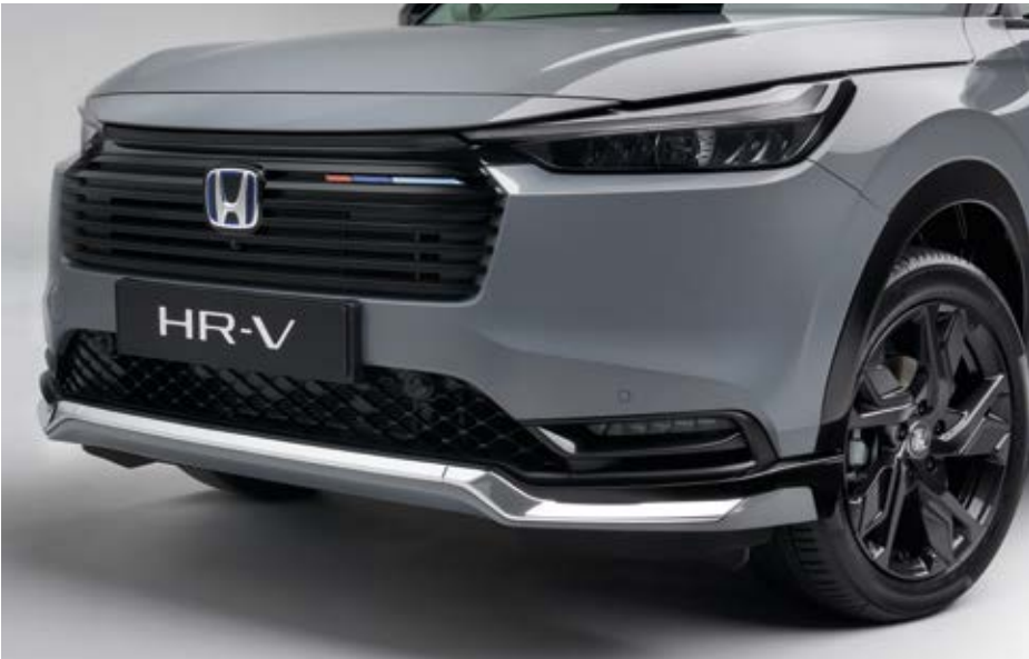
SPORT-FRONTSTOSSFÄNGER Verstärken Sie das dynamische Aussehen Ihres Fahrzeugs mit dem Sport-Frontstoßfänger mit Chrom-Akzent.