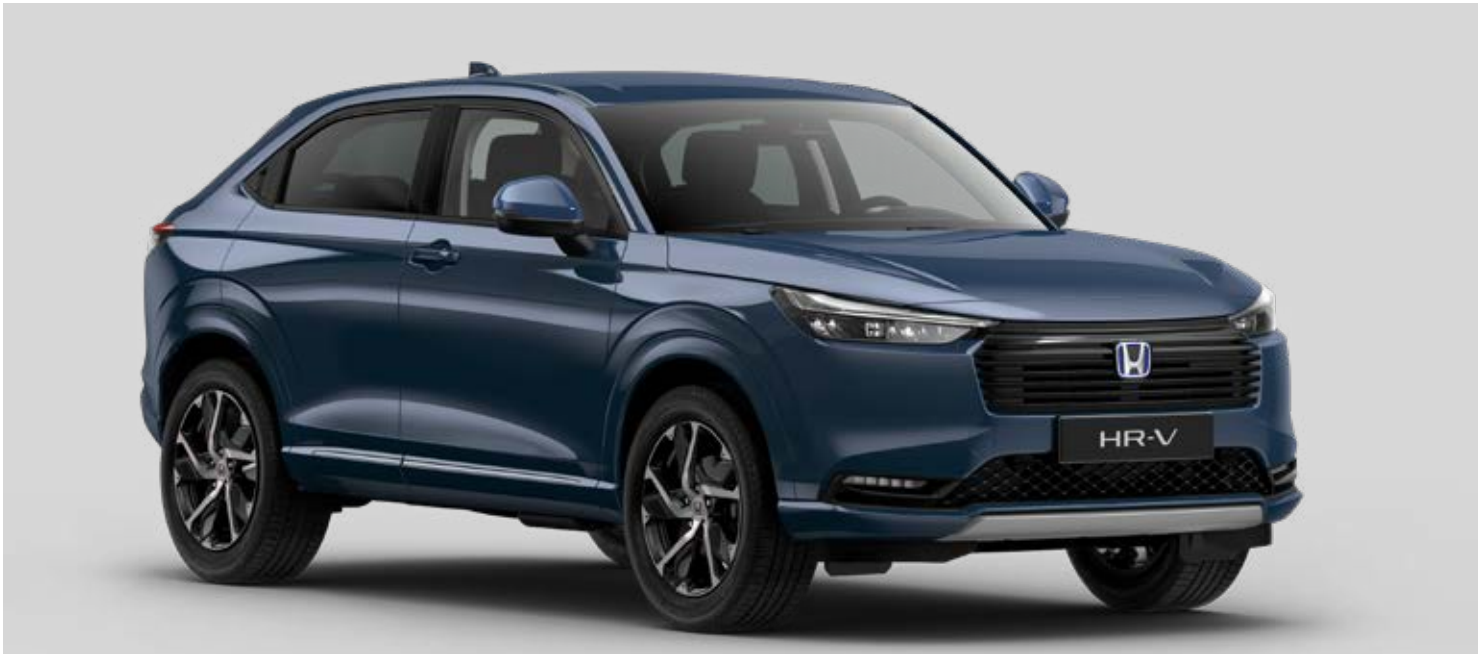
Abbildungen zeigen HR-V e:HEV Advance Plus in Seabed Blue Pearl. Kraftstoffverbrauch HR-V e:HEV Advance Plus in l/100 km: kombiniert 5,4. CO 2 -Emissionen in g/km: kombiniert 122. CO 2 -Klasse: D.

Eine vollständige Übersicht aller Ausstattungsmerkmale finden Sie in der Preisliste für den HR-V.