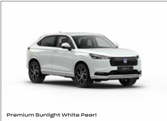
Premium Sunlight White Pearl