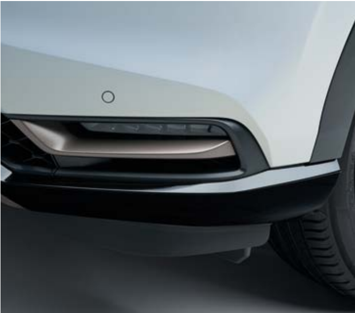
NEBELSCHEINWERFER-EINFASSUNG Auf die kleinen Details kommt es an. Die Nebelscheinwerfer-Einfassung in Patina Bronze ergänzt perfekt das fließende Design der Front Ihres HR-V.