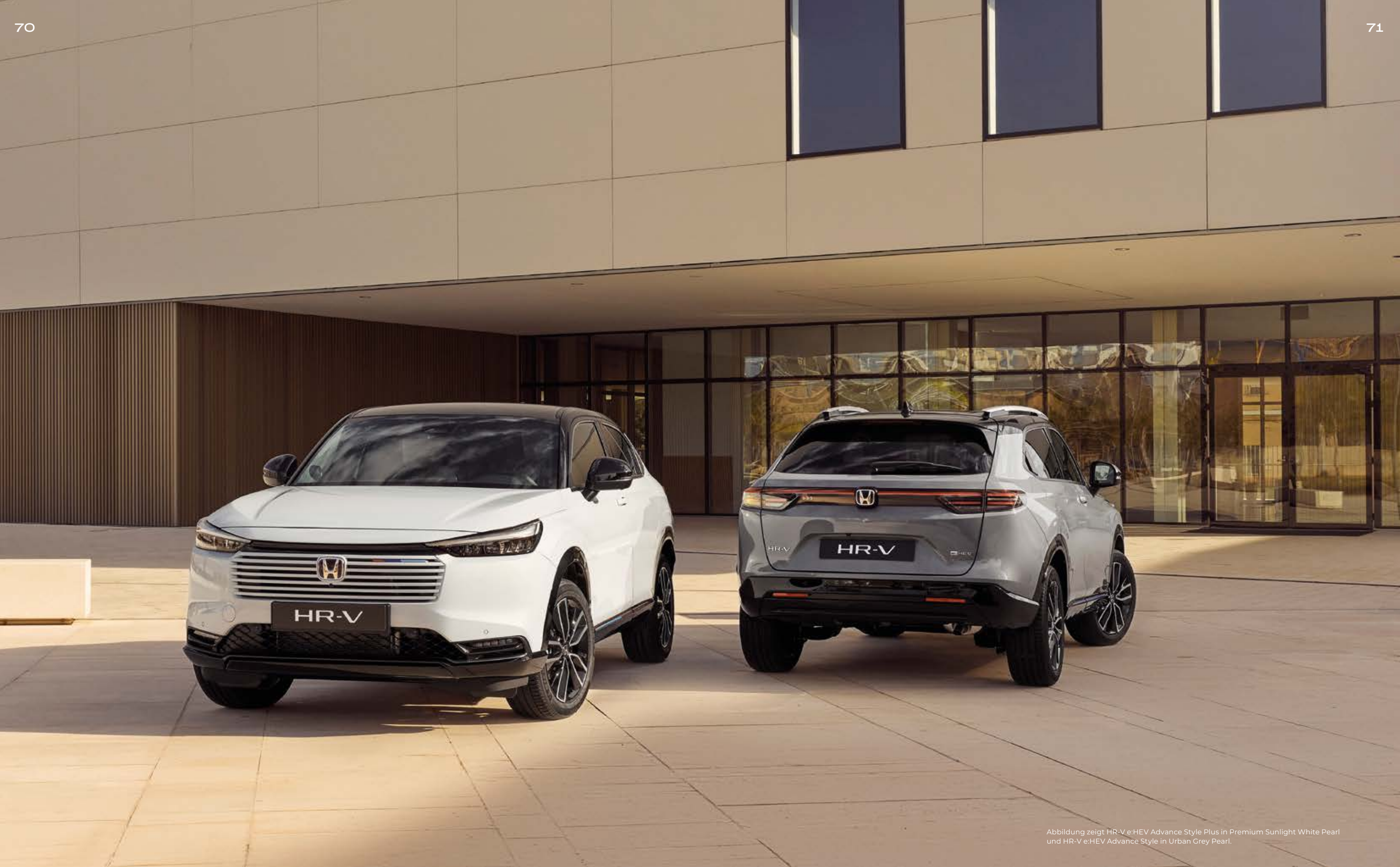
Abbildung zeigt HR-V e:HEV Advance Style Plus in Premium Sunlight White Pearl und HR-V e:HEV Advance Style in Urban Grey Pearl.