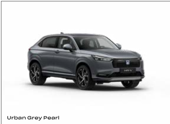
Urban Grey Pearl