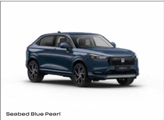
Seabed Blue Pearl