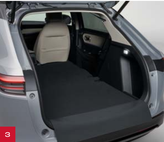
Abbildungen zeigen HR-V e:HEV Advance Style in Urban Grey Pearl.