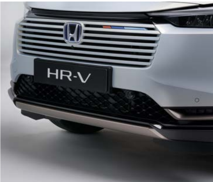
UNTERER FRONTSTOSSFÄNGER Der untere Frontstoßfänger, standardmäßig am Fahrzeug, unterstreicht – in Patina Bronze lackiert – die Raffinesse Ihres HR-V.