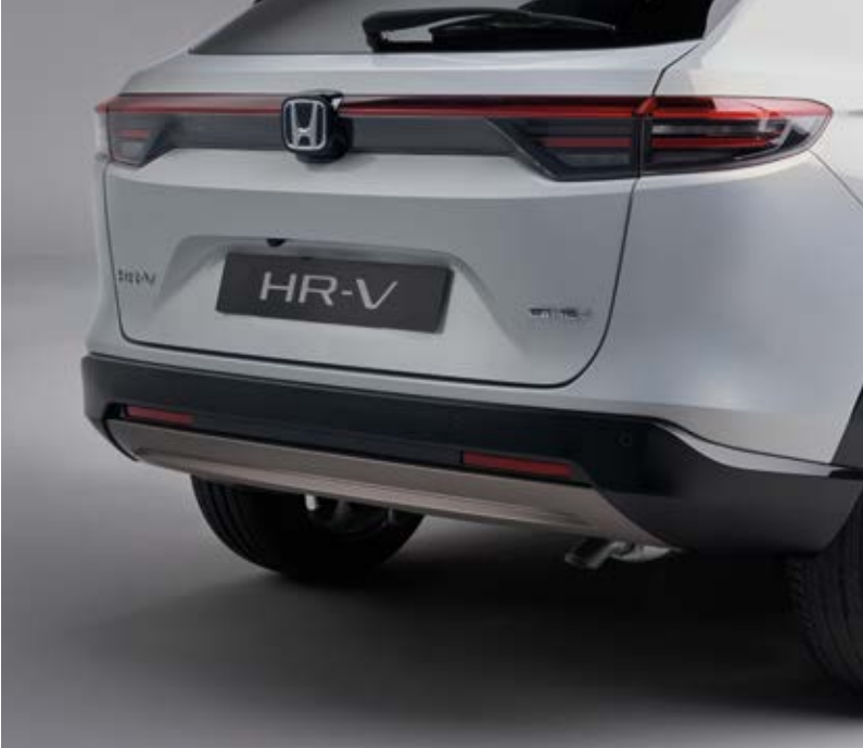
UNTERER HECKSTOSSFÄNGER Der untere Heckstoßfänger, standardmäßig am Fahrzeug, unterstreicht – in Patina Bronze lackiert – die hochwertige Anmutung Ihres HR-V.