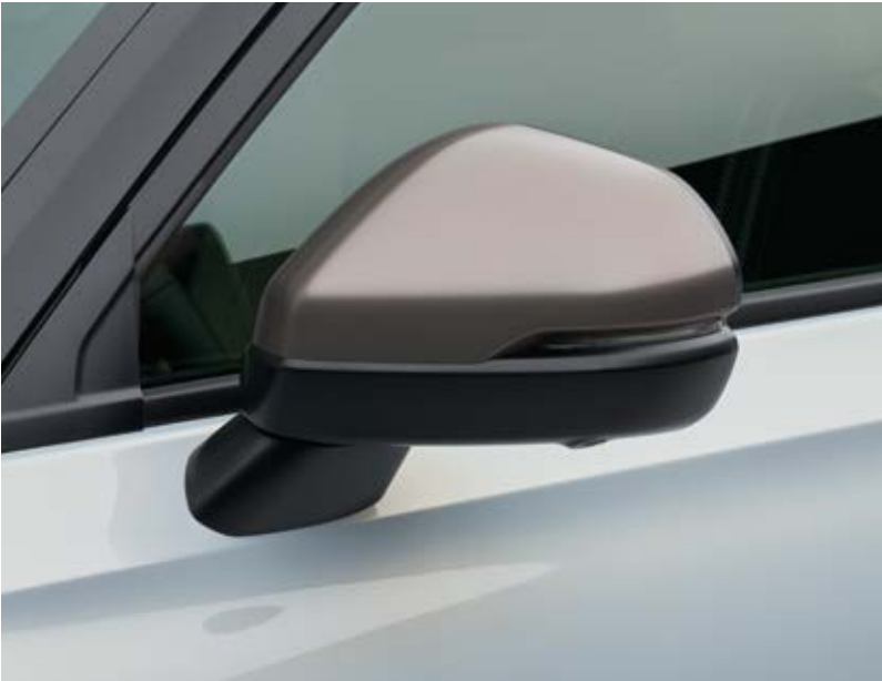
AUSSENSPIEGEL-ABDECKUNGEN Fügen Sie ein wenig Einzigartigkeit mit den stilvollen Außenspiegel-Abdeckungen in Patina Bronze hinzu.