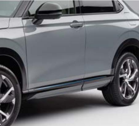
SEITENSCHWELLERAUFSATZ Die Seitenschwelleraufsätze (2 Teile pro Seite) verleihen Ihrem Fahrzeug einen muskulösen Look.