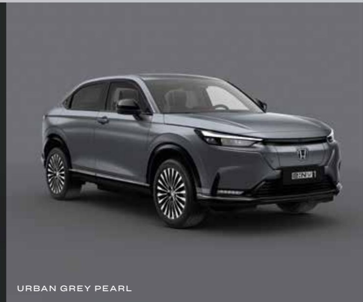
URBAN GREY PEARL