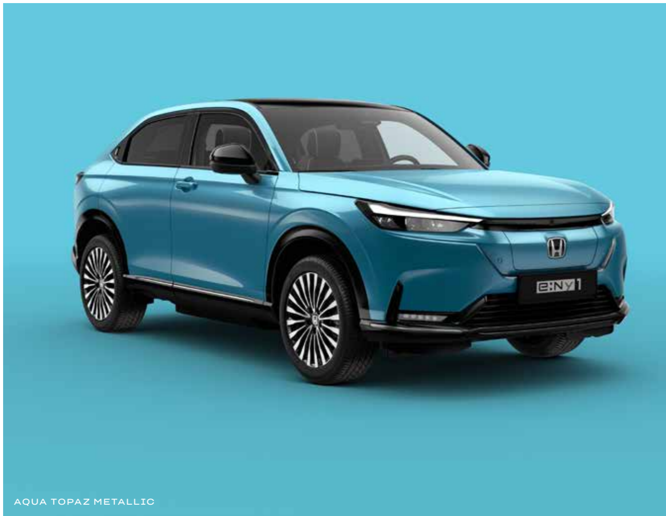
AQUA TOPAZ METALLIC

Der e:Ny1 ist in fünf attraktiven Farben erhältlich – darunter die exklusive Lackierung „Aqua Topaz Metallic“.