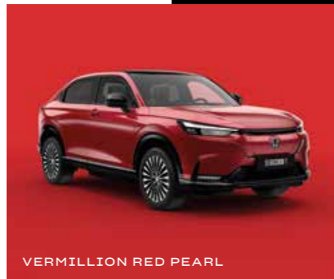
VERMILLION RED PEARL