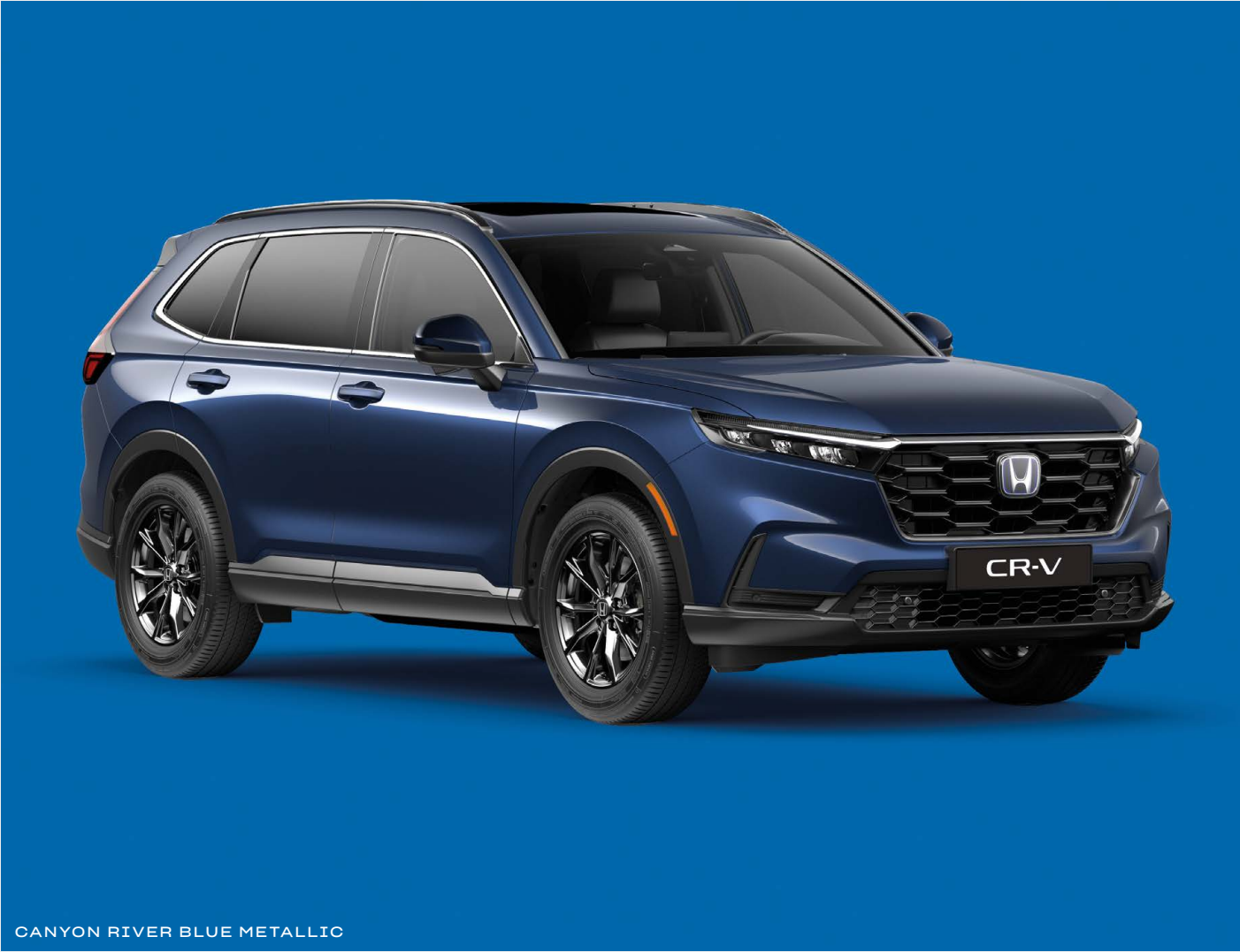
CANYON RIVER BLUE METALLIC

- nicht verfügbar Bei den hier genannten Preisen handelt es sich um unverbindliche Preisempfehlungen von Honda Deutschland (inkl. 19 % MwSt.)