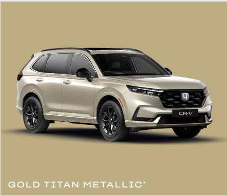
GOLD TITAN METALLIC*