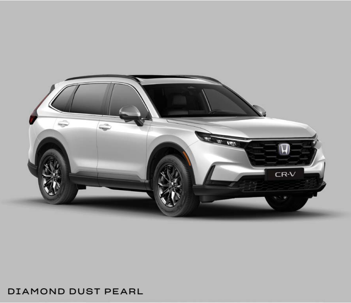
DIAMOND DUST PEARL