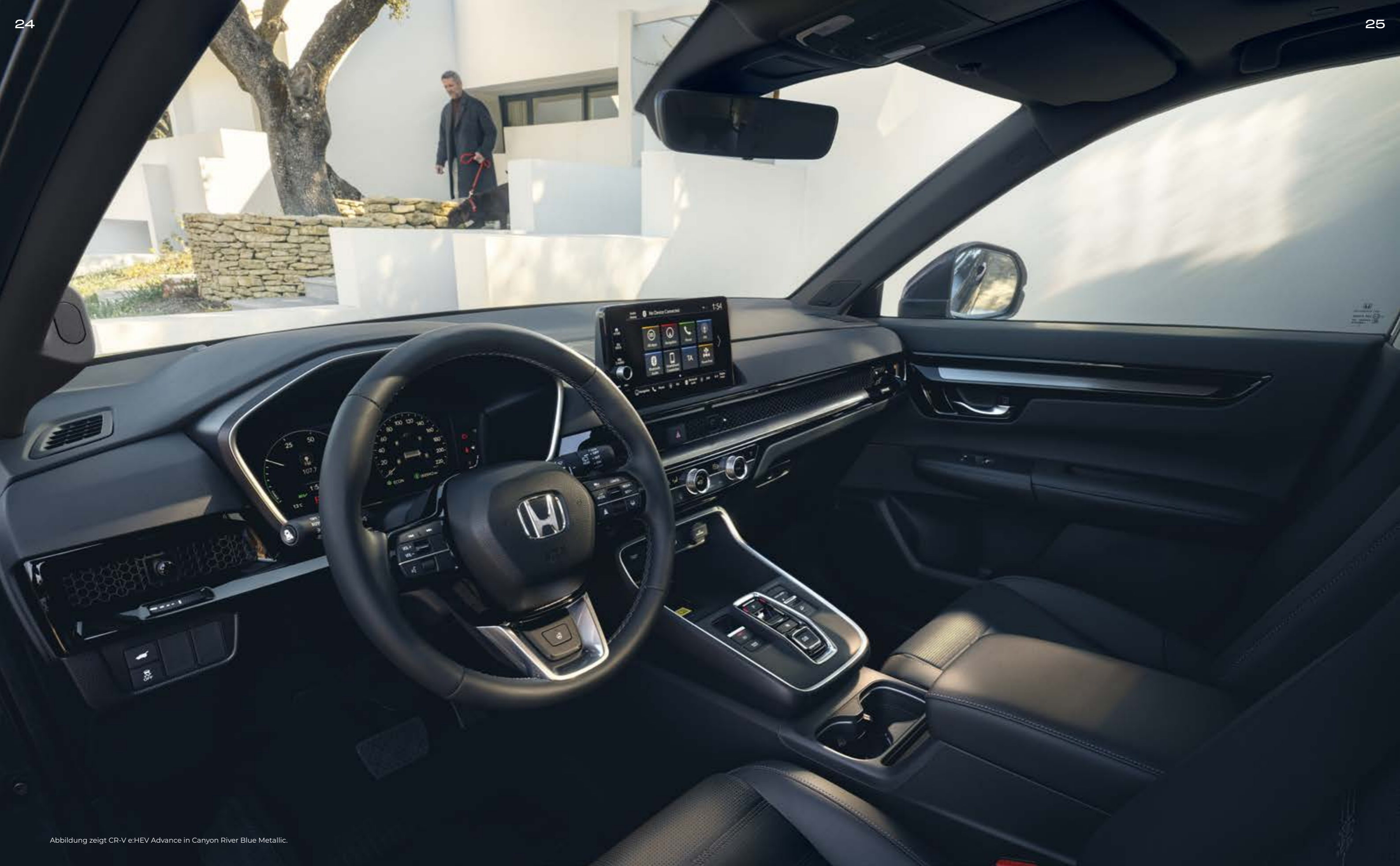
Abbildung zeigt CR-V e:HEV Advance in Canyon River Blue Metallic.