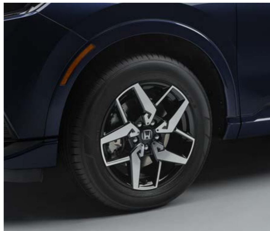
Abbildung zeigt CR-V e:HEV Advance in Canyon River Blue Metallic mit optionalen Leichtmetallfelgen CR1811.