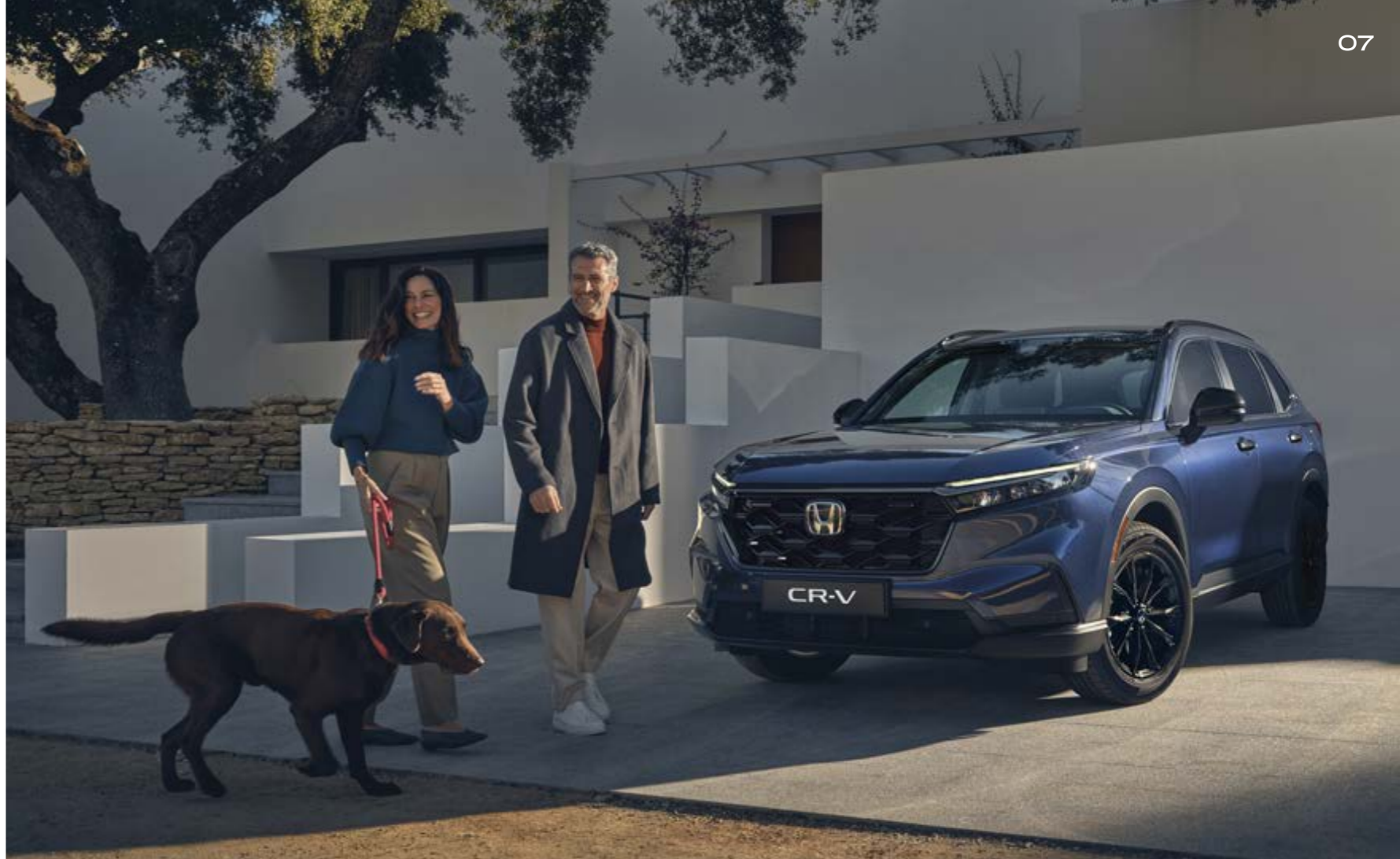
Abbildungen zeigen CR-V e:HEV Advance in Canyon River Blue Metallic.

Kraftstoffverbrauch CR-V e:HEV AWD in l/100 km: kombiniert 6,7. CO 2 -Emissionen in g/km: kombiniert 152. CO 2 -Klasse: E.