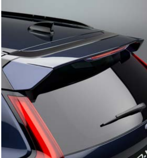
HECKKLAPPEN-SPOILER Der Heckklappenspoiler in Wagenfarbe ergänzt die Linienführung des Daches und akzentuiert den sportlichen Look.