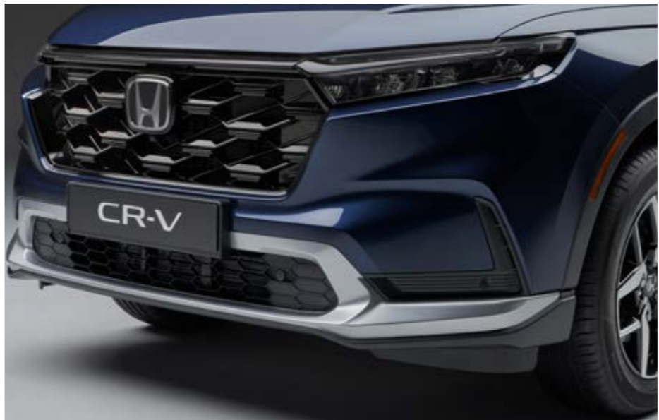
AERO-STOSSFÄNGER VORN Unterstreichen Sie das dynamische und elegante Design Ihres CR-V mit dem aerodynamischen Frontstoßfänger.

Das Paket enthält: Aero-Stoßfänger vorn, Heckstoßfänger, Außenspiegel-Abdeckungen, Seitenschweller in Lunar Silver und Heckklappen-Spoiler in Wagenfarbe.