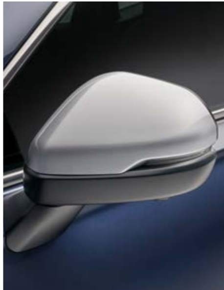
AUSSENSPIEGEL-ABDECKUNGEN Verleihen Sie Ihrem CR-V mehr Individualität mit diesen eleganten Außenspiegel-Abdeckungen in Lunar Silver, die sich nahtlos ins Design des Fahrzeugs einfügen.