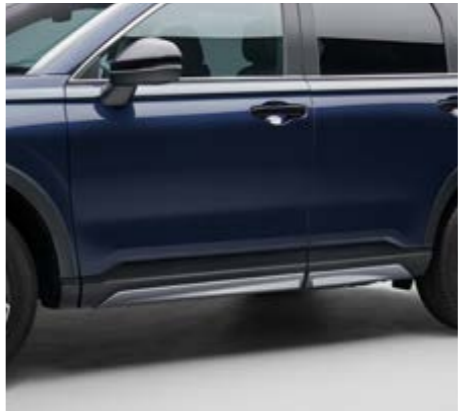
SEITENSCHWELLER Geben Sie Ihrem Fahrzeug ein aufregendes und sportliches Profil mit diesen stilvollen, schnittigen Seitenschwellern in Lunar Silver.