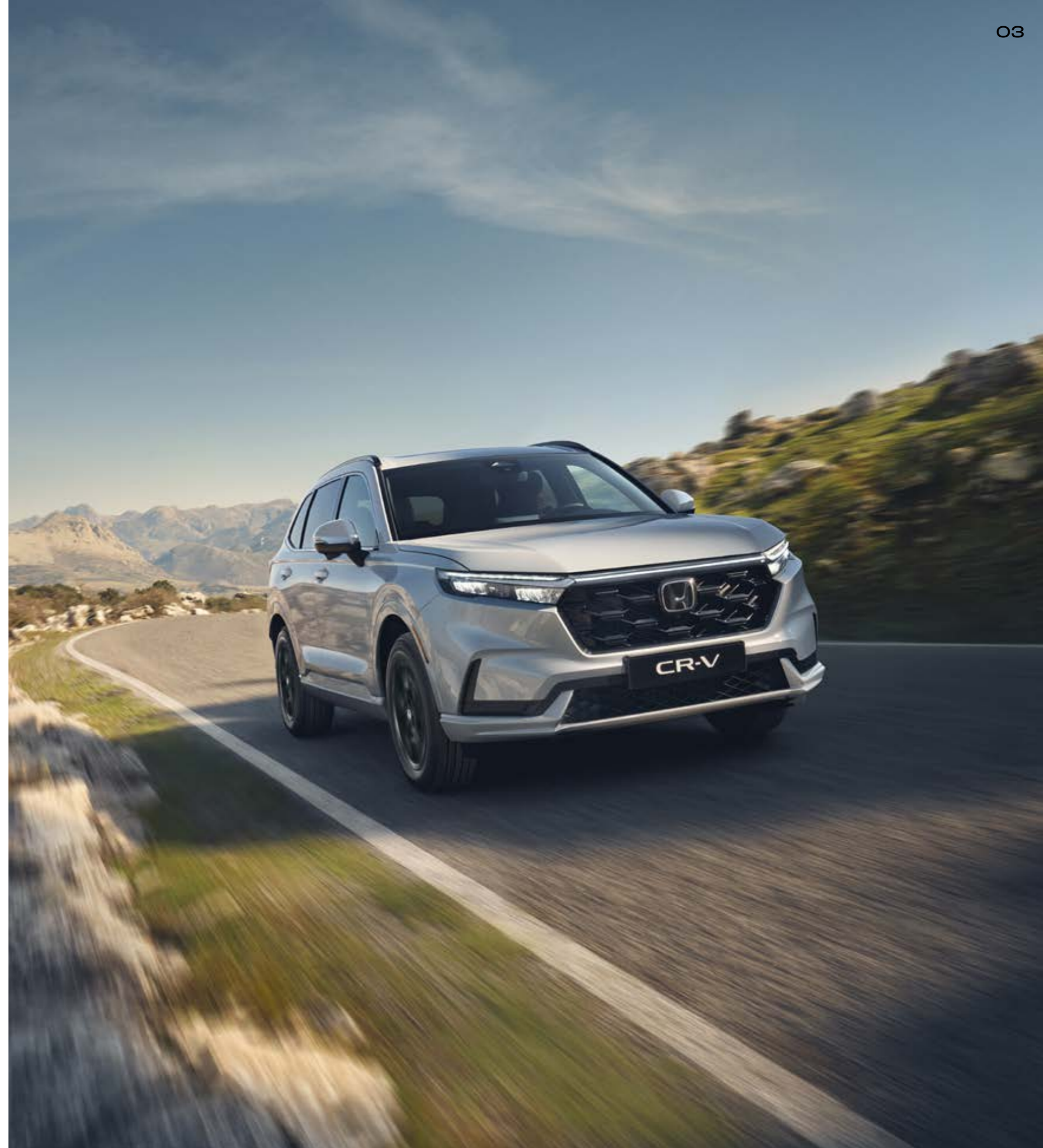
Abbildung zeigt CR-V e:PHEV Advance Tech in Diamond Dust Pearl.

Energieverbrauch CR-V e:PHEV: Kraftstoffverbrauch gewichtet, kombiniert: 2,6 l/100 km. Stromverbrauch gewichtet, kombiniert: 11,7 kWh/100 km. CO 2 -Emissionen in g/km gewichtet, kombiniert: 59–60. CO 2 -Klasse gewichtet, kombiniert: B. Kraftstoffverbrauch bei entladener Batterie kombiniert: 6,2–6,3 l/100 km. CO 2 -Klasse bei entladener Batterie: E. Elektrische Reichweite (EAER): 77–78 km. Kraftstoffverbrauch CR-V e:HEV 2WD in l/100 km: kombiniert 6,0. CO 2 -Emissionen in g/km: kombiniert 136. CO 2 -Klasse: E. Kraftstoffverbrauch CR-V e:HEV AWD in l/100 km: kombiniert 6,7. CO 2 -Emissionen in g/km: kombiniert 152. CO 2 -Klasse: E.