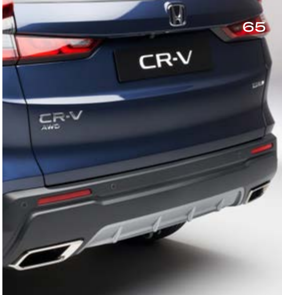
HECKSTOSSFÄNGER Der Heckstoßfänger ergänzt den perfekt sportlichen Look sowie den aerodynamischen Frontstoßfänger und die Seitenschweller.