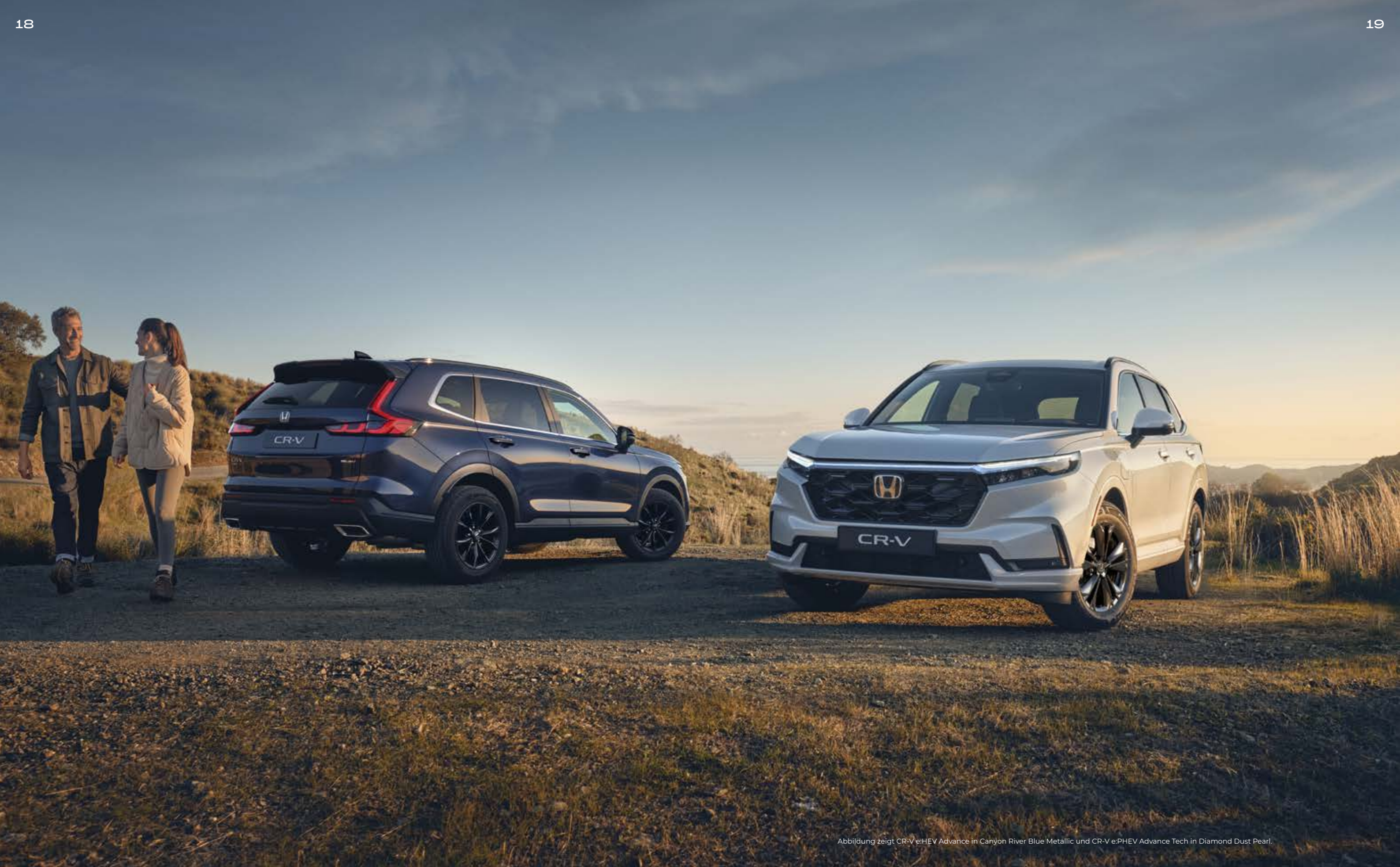
Abbildung zeigt CR-V e:HEV Advance in Canyon River Blue Metallic und CR-V e:PHEV Advance Tech in Diamond Dust Pearl.