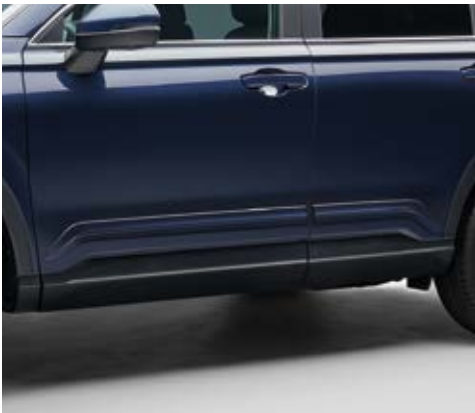
SEITENSCHUTZLEISTEN IN WAGENFARBE

Dieses praktische Paket macht Ihren CR-V zum idealen Begleiter auf Ihren Reisen. Die Ganzjahresmatten und die Kofferraumwanne mit Trennwänden sind besonders praktisch im Herbst und im Winter, während die Einstiegs-Leisten und Seitenschutzleisten den Lack Ihres Fahrzeugs vor Dellen und Kratzern schützen.