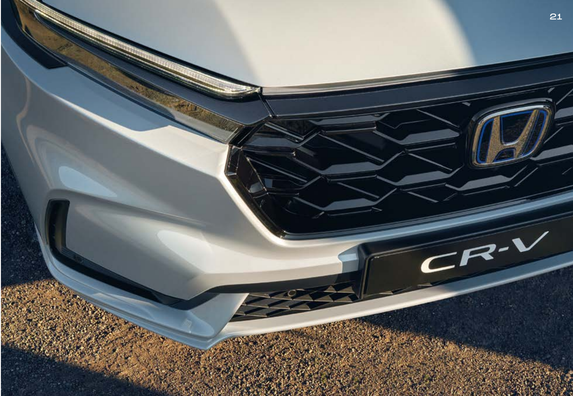
Abbildungen zeigen CR-V ePHEV Advance Tech in Diamond Dust Pearl.