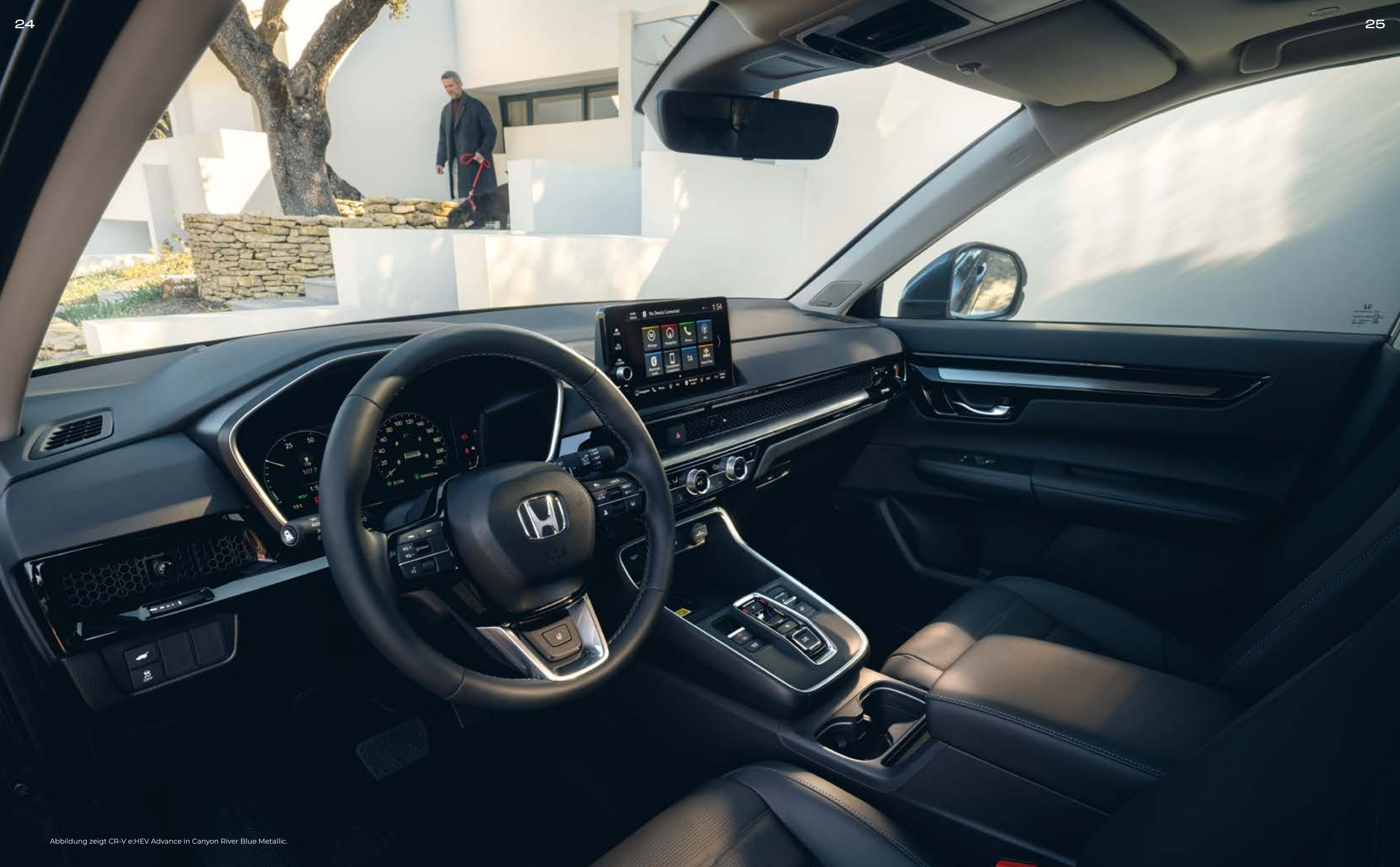
Abbildung zeigt CR-V e:HEV Advance in Canyon River Blue Metallic.