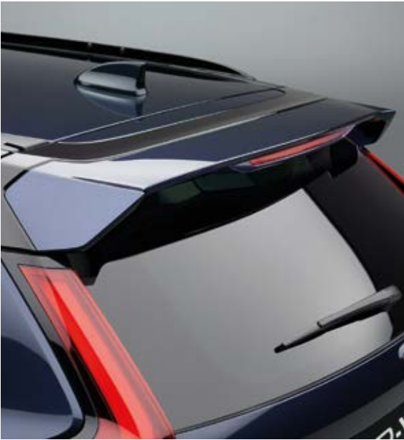
HECKKLAPPEN-SPOILER Der Heckklappenspoiler in Wagenfarbe ergänzt die Linienführung des Daches und akzentuiert den sportlichen Look.