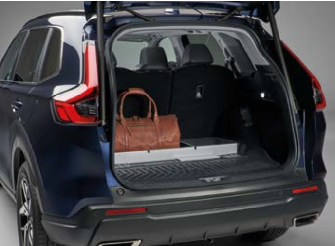
KOFFERRAUMWANNE MIT ABTRENNUNGEN

Die attraktiven Einstiegsleisten aus Edelstahl sind mit einem CR-V Logo versehen und schützen die Türschweller des Fahrzeugs vor Kratzern. Das Set besteht aus je zwei Einstiegsleisten für vorn und hinten.