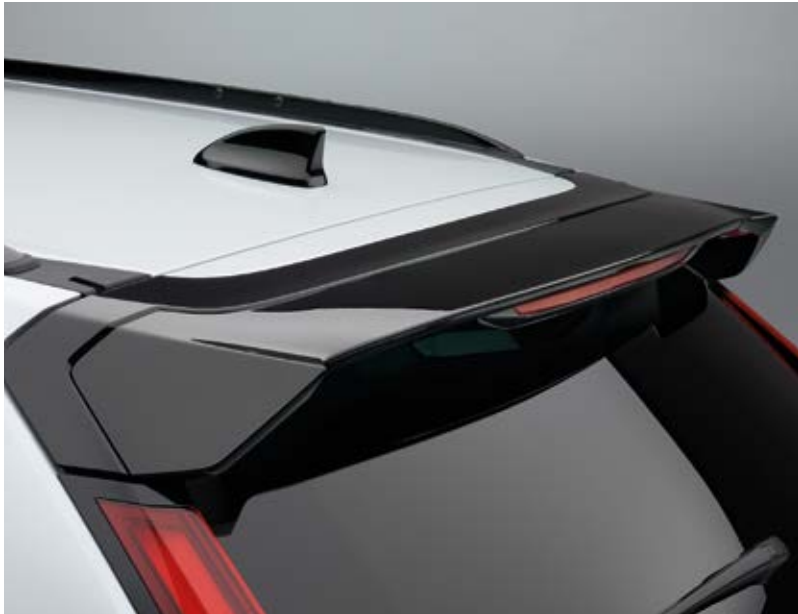
HECKKLAPPEN-SPOILER Der Heckklappen-Spoiler in Berlina Black wurde entwickelt, um die Dachlinie aufzugreifen und den sportlichen Look zu betonen.