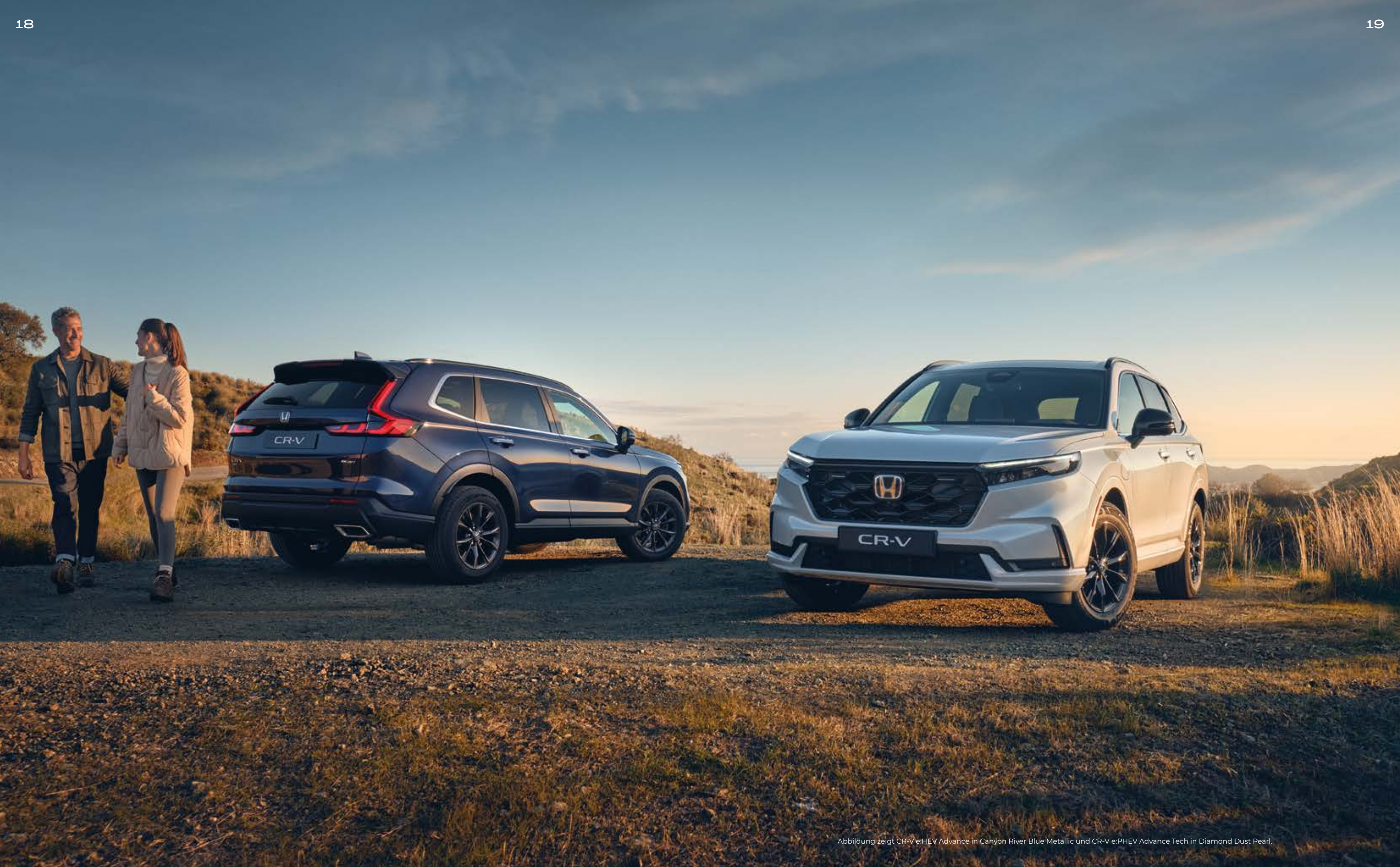
Abbildung zeigt CR-V e:HEV Advance in Canyon River Blue Metallic und CR-V e:PHEV Advance Tech in Diamond Dust Pearl.