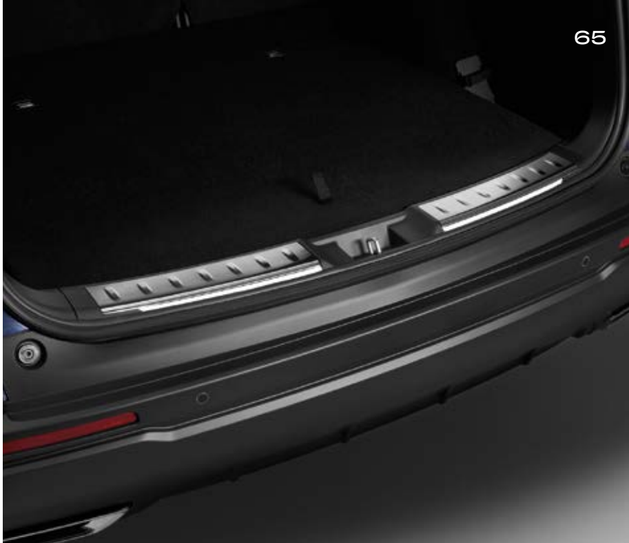
BELEUCHTETE LADEKANTEN-SCHUTZLEISTEN Schützen Sie die Ladekante Ihres CR-V mit diesen Ladekanten-Schutzleisten aus gebürstetem Edelstahl. Diese leuchten beim Öffnen der Hackklappe auf und verbessern die Sicht bei Nacht.