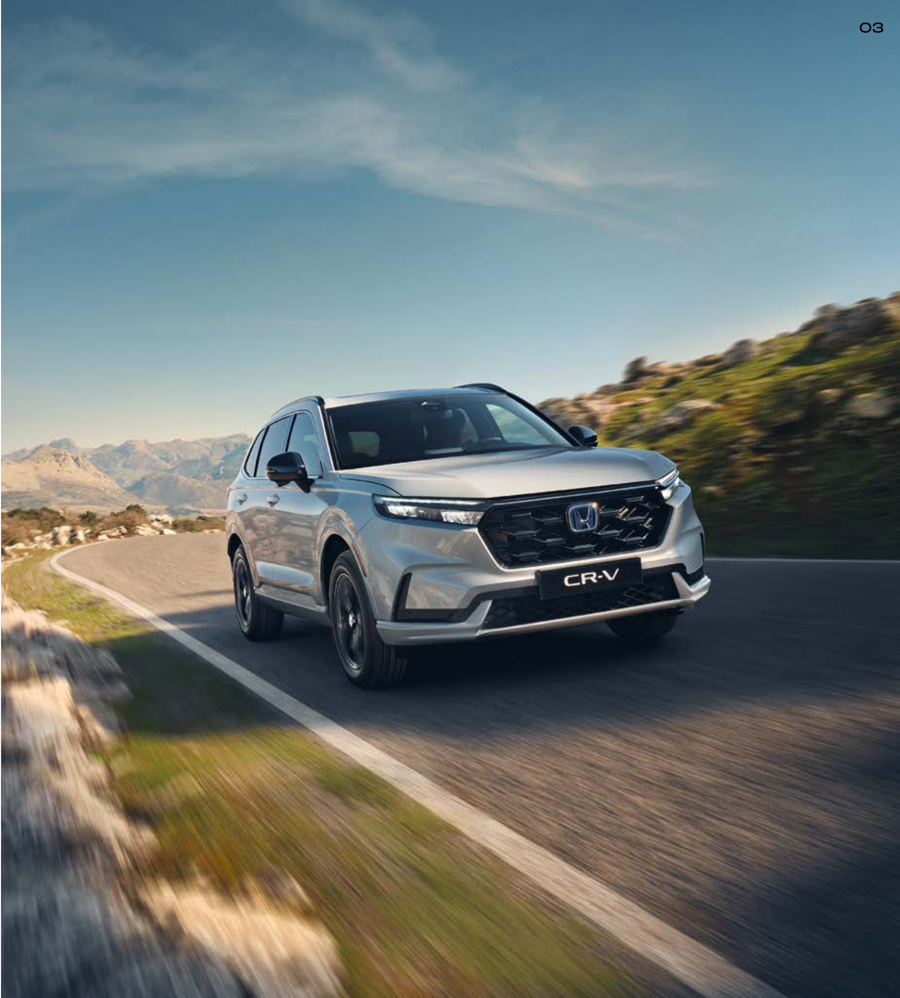
Abbildung zeigt CR-V e:PHEV Advance Tech in Diamond Dust Pearl.

Energieverbrauch CR-V e:PHEV: Kraftstoffverbrauch gewichtet, kombiniert: 2,6 l/100 km. Stromverbrauch gewichtet, kombiniert: 11,6 kWh/100 km. CO 2 -Emissionen in g/km gewichtet, kombiniert: 59. CO 2 -Klasse gewichtet, kombiniert: B. Kraftstoffverbrauch bei entladener Batterie kombiniert: 6,2 l/100 km. CO 2 -Klasse bei entladener Batterie: E. Elektrische Reichweite (EAER): 78 km. Kraftstoffverbrauch CR-V e:HEV 2WD in l/100 km: kombiniert 6,0. CO 2 -Emissionen in g/km: kombiniert 135. CO 2 -Klasse: D. Kraftstoffverbrauch CR-V e:HEV AWD in l/100 km: kombiniert 6,7. CO 2 -Emissionen in g/km: kombiniert 151-152. CO 2 -Klasse: E.