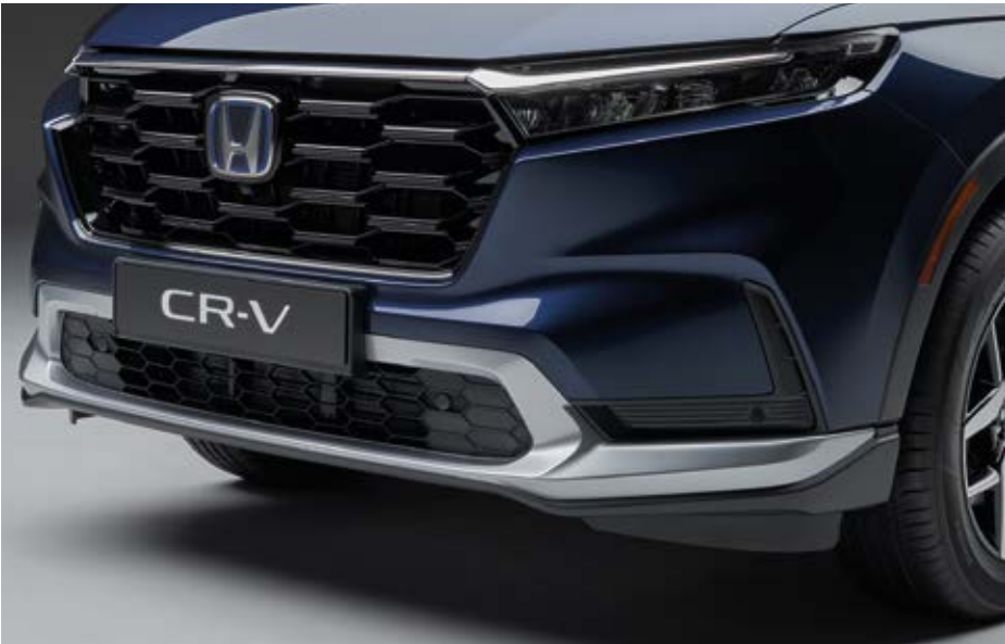
AERO-STOSSFÄNGER VORN Unterstreichen Sie das dynamische und elegante Design Ihres CR-V mit dem aerodynamischen Frontstoßfänger.

Das Paket enthält: Aero-Stoßfänger vorn, Heckstoßfänger, Außenspiegel-Abdeckungen, Seitenschweller in Lunar Silver und Heckklappen-Spoiler in Wagenfarbe.