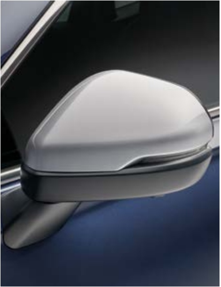
AUSSENSPIEGEL-ABDECKUNGEN Verleihen Sie Ihrem CR-V mehr Individualität mit diesen eleganten Außenspiegel-Abdeckungen in Lunar Silver, die sich nahtlos ins Design des Fahrzeugs einfügen.