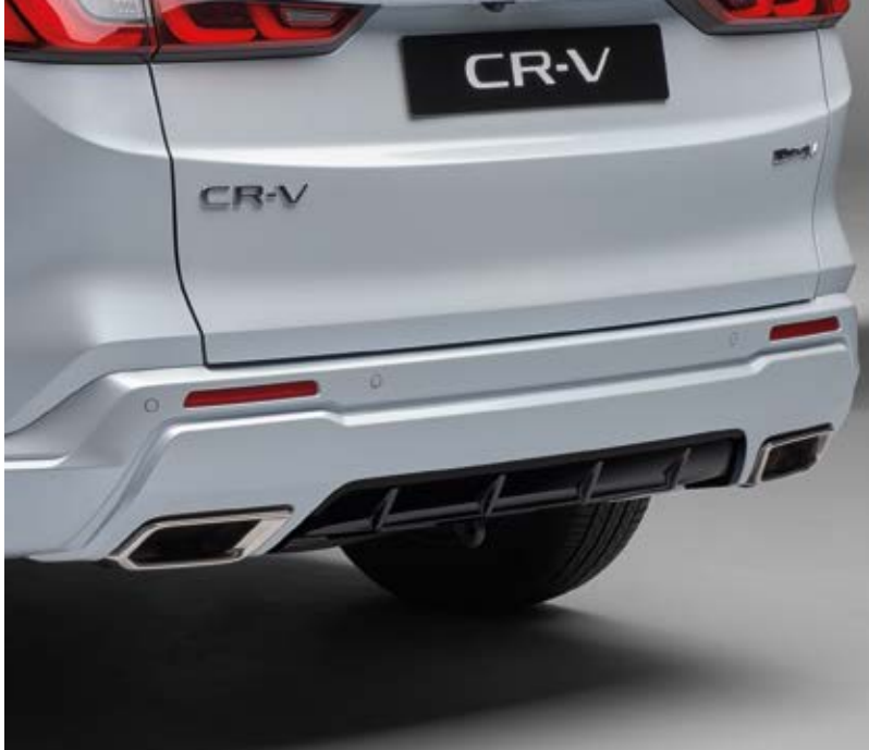
HECKSTOSSFÄNGER Vollenden Sie den Look Ihres CR-V mit dem Heckstoßfänger in Wagenfarbe und Akzenten in Berlina Black. Er passt perfekt zum aerodynamischen Frontstoßfänger und den Seitenschwellern.

Das Paket enthält: Aero-Stoßfänger vorn in Wagenfarbe, Heckstoßfänger in Wagenfarbe/Schwarz, Seitenschweller und Heckklappen-Spoiler in Berlina Black.