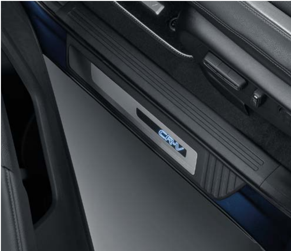
BELEUCHTETE EINSTIEGSLEISTEN Verleihen Sie dem Innenraum Ihres CR-V noch mehr Style mit den beleuchteten Einstiegsleisten. Die Oberfläche aus Edelstahl hat ein leuchtendes CR-V-Logo und leuchtet elegant beim Öffnen der Tür.