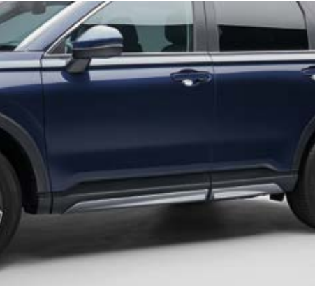
SEITENSCHWELLER Geben Sie Ihrem Fahrzeug ein aufregendes und sportliches Profil mit diesen stilvollen, schnittigen Seitenschwellern in Lunar Silver.