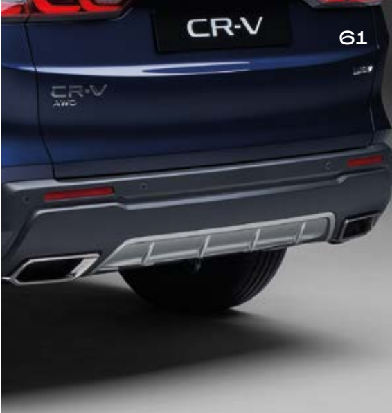
HECKSTOSSFÄNGER Der Heckstoßfänger ergänzt den perfekt sportlichen Look sowie den aerodynamischen Frontstoßfänger und die Seitenschweller.