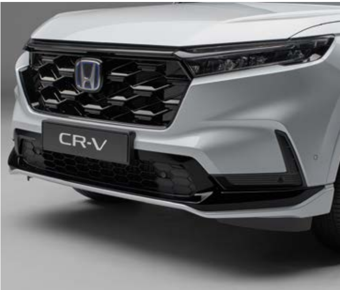
AERO-STOSSFÄNGER VORN Betonen Sie das dynamische Design Ihres CR-V mit dem aerodynamischen Frontstoßfänger. Die Kombination aus Wagenfarbe und Berlina Black lässt die Front besonders hochwertig wirken.