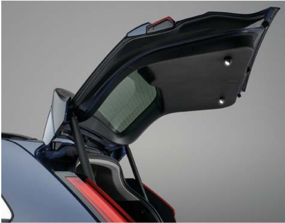
HECKKLAPPENBELEUCHTUNG Die Heckklappenbeleuchtung wurde entwickelt, um den Komfort und die Sicherheit zu erhöhen, indem sie nicht nur den Kofferraum, sondern auch den Bereich hinter dem Auto erhellt. Die LED-Leuchten an der Innenseite der Heckklappe sorgen für gute und gleichmäßige Ausleuchtung des Kofferraums – selbst bei voller Beladung.