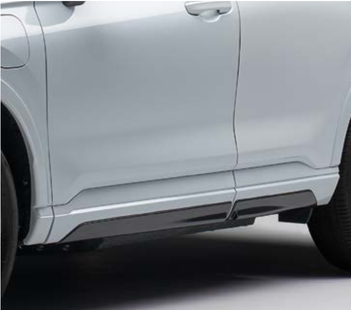
SEITENSCHWELLER Unterstreichen Sie den sportlichen Charakter Ihres Fahrzeugs mit den Seitenschwellern.