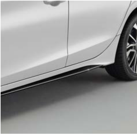
SEITENSCHWELLER Die Seitenschweller in Berlina Black verleihen Ihrem Fahrzeug einen muskulösen Look.