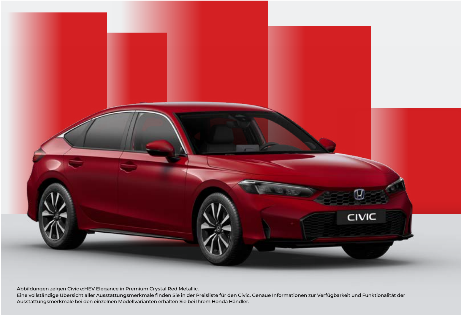
Abbildungen zeigen Civic e:HEV Elegance in Premium Crystal Red Metallic. Eine vollständige Übersicht aller Ausstattungsmerkmale finden Sie in der Preisliste für den Civic. Genaue Informationen zur Verfügbarkeit und Funktionalität der Ausstattungsmerkmale bei den einzelnen Modellvarianten erhalten Sie bei Ihrem Honda Händler.