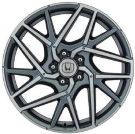
02 18"-LEICHTMETALLFELGE CI1812 Die 18"-Leichtmetallfelge CI1812 verfügt über eine Diamond-Cut-Oberfläche mit einer matten Klarlackbeschichtung und Rombo Silber-Elementen.

Mit der Leichtmetallfelgen-Auswahl für den Civic bringen Sie eine Extraportion Design auf die Straße.