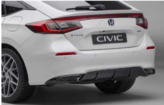
ZIERLEISTE FÜR HECKSTOSSFÄNGER Das Heck wird durch einen Diffusor in glänzendem Berlina Black veredelt.