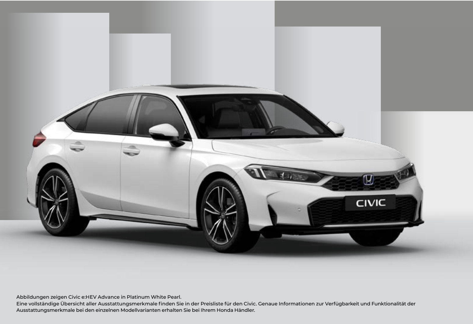
Abbildungen zeigen Civic e:HEV Advance in Platinum White Pearl. Eine vollständige Übersicht aller Ausstattungsmerkmale finden Sie in der Preisliste für den Civic. Genaue Informationen zur Verfügbarkeit und Funktionalität der Ausstattungsmerkmale bei den einzelnen Modellvarianten erhalten Sie bei Ihrem Honda Händler.