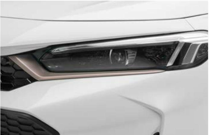
SCHEINWERFER-EINFASSUNGEN Für einen stilvollen Auftritt sind die Scheinwerfer mit einer Einfassung in Bronze-Optik versehen.