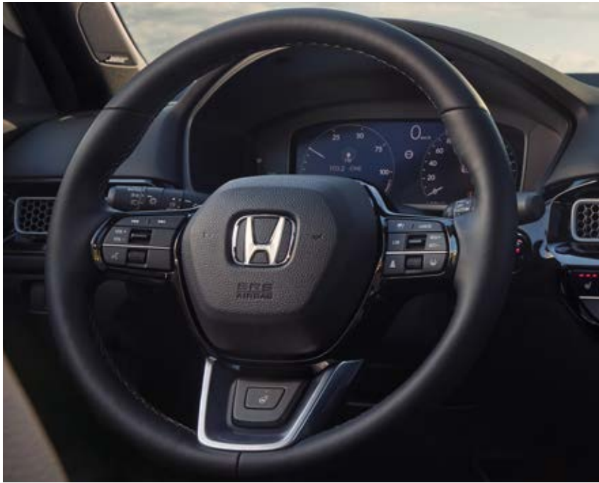
△ BEHEIZBARES MULTIFUNKTIONSLLENKRAD*