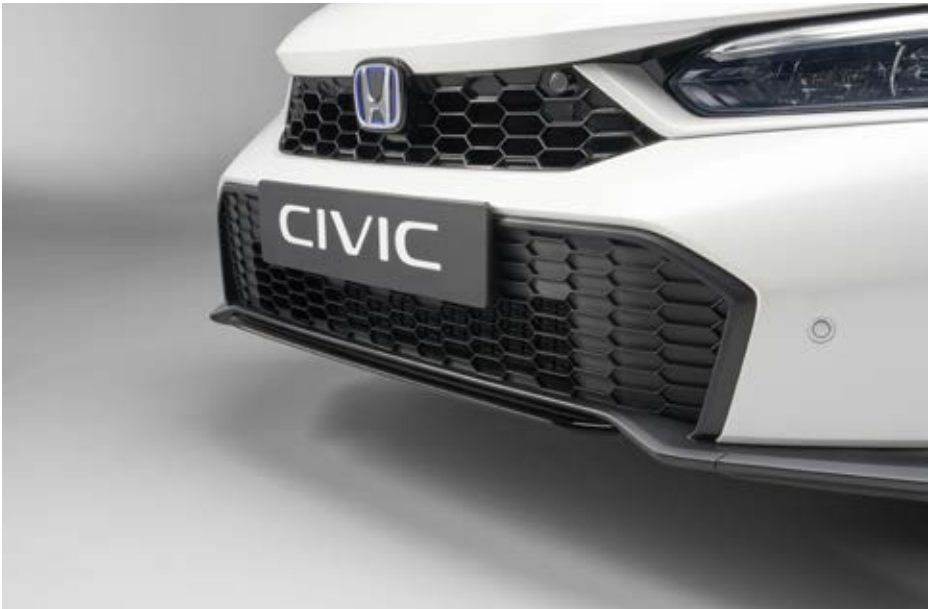
UNTERE KÜHLERGRILL-ZIERLEISTE Verleihen Sie Ihrem Civic mit dieser glänzend schwarzen unteren Kühlergrill-Zierleiste einen noch sportlicheren Look.

Das Paket enthält: Ducktail-Heckspoiler, untere Kühlergrill-Zierleiste und Seitenschweller in Berlina Black sowie das Black Emblem-Paket in Dark Chrome, bei den Varianten Elegance und Advance zusätzlich Außenspiegel-Abdeckungen in Berlina Black.