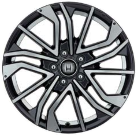
01 18"-LEICHTMETALLFELGE CI1811 Die 18"-Leichtmetallfelge CI1811 hat eine Diamond-Cut-Oberfläche mit glänzender Klarlackbeschichtung und Gunpowder Black-Elementen.