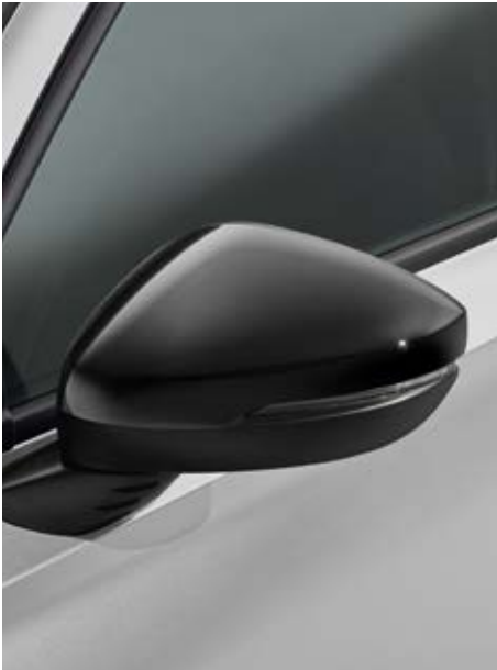
AUSSENSPIEGEL-ABDECKUNGEN Machen Sie Ihren Civic mit den stilvollen Außenspiegel-Abdeckungen in Berlina Black noch ein wenig einzigartiger.