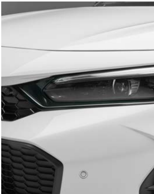
SCHEINWERFER-EINFASSUNGEN Diese Scheinwerfer-Einfassungen verleihen der Frontpartie des Fahrzeugs noch mehr Ausdruck.