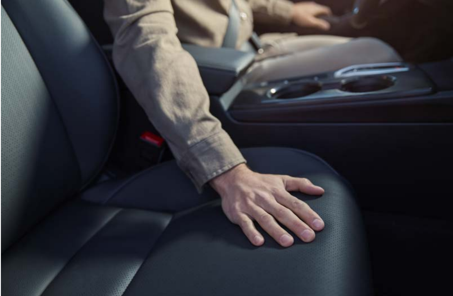
△ ERGONOMISCHE, KÖRPERSTABILISIERENDE VORDERSITZE