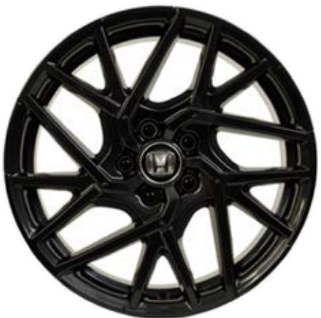
03 18"-LEICHTMETALLFELGE CI1813 Die 18"-Leichtmetallfelge CI1813 zeichnet sich durch die schwarze Volllackierung mit Klarlack aus.