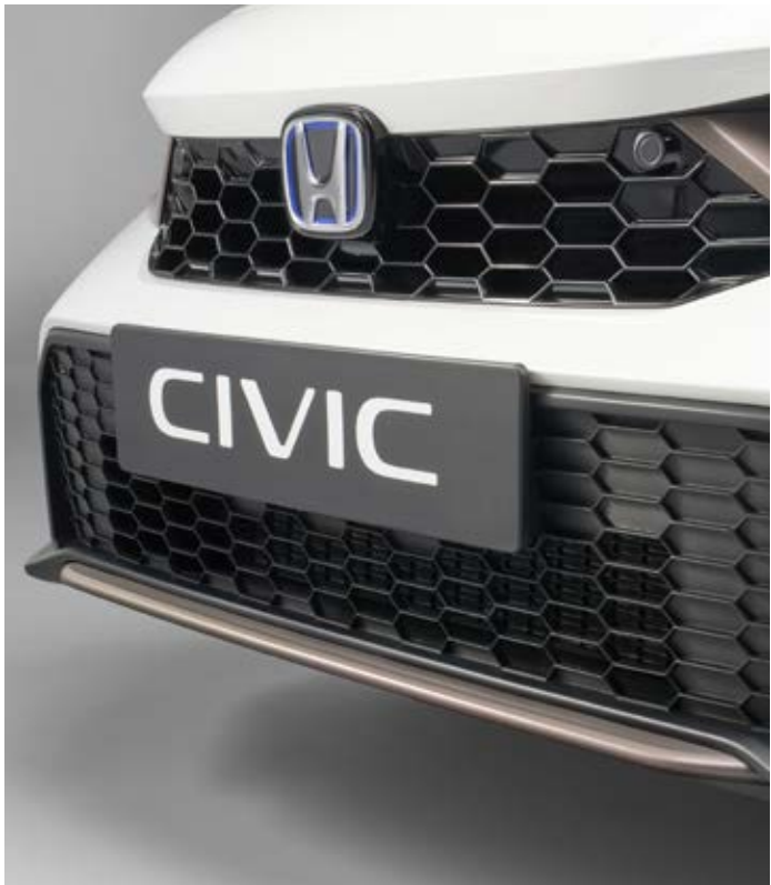
UNTERE KÜHLERGRILL-ZIERLEISTE Für einen raffinierten Look sorgt eine bronzefarbene Zierleiste unter dem vorderen Kühlergrill.