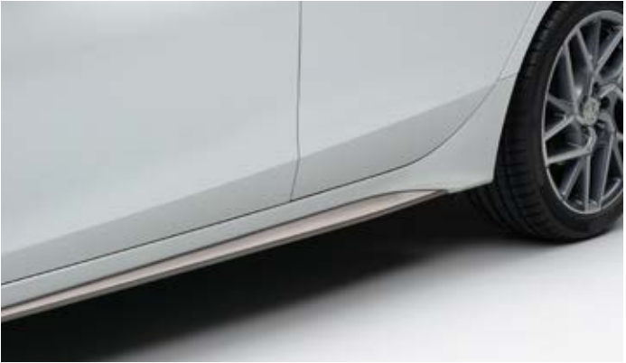
SEITENSCHWELLER Diese dynamischen Verzierungen unterstreichen das schnittige Seitenprofil.