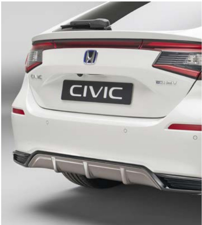
ZIERLEISTE FÜR HECKSTOSSFÄNGER Der kontrastierende Diffusor des Stoßfängers ergänzt das Heck um einen dynamischen, sportlichen Akzent.