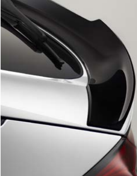
DUCKTAIL-HECKSPOILER Dieser Ducktail-Heckspoiler in Berlina Black verleiht der Heckansicht des Civic eine sportlich-dynamische Note.