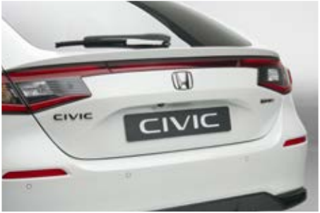
SCHWARZE EMBLEME FÜR VORN UND HINTEN Auf die kleinen Details kommt es an. Das Black Emblem-Paket ergänzt perfekt den sportlichen Look Ihres Civic. Es enthält zwei schwarze Honda Embleme für vorn und hinten, einen schwarzen Civic Schriftzug sowie einen schwarzen e:HEV Schriftzug – alle Teile in Dark Chrome.