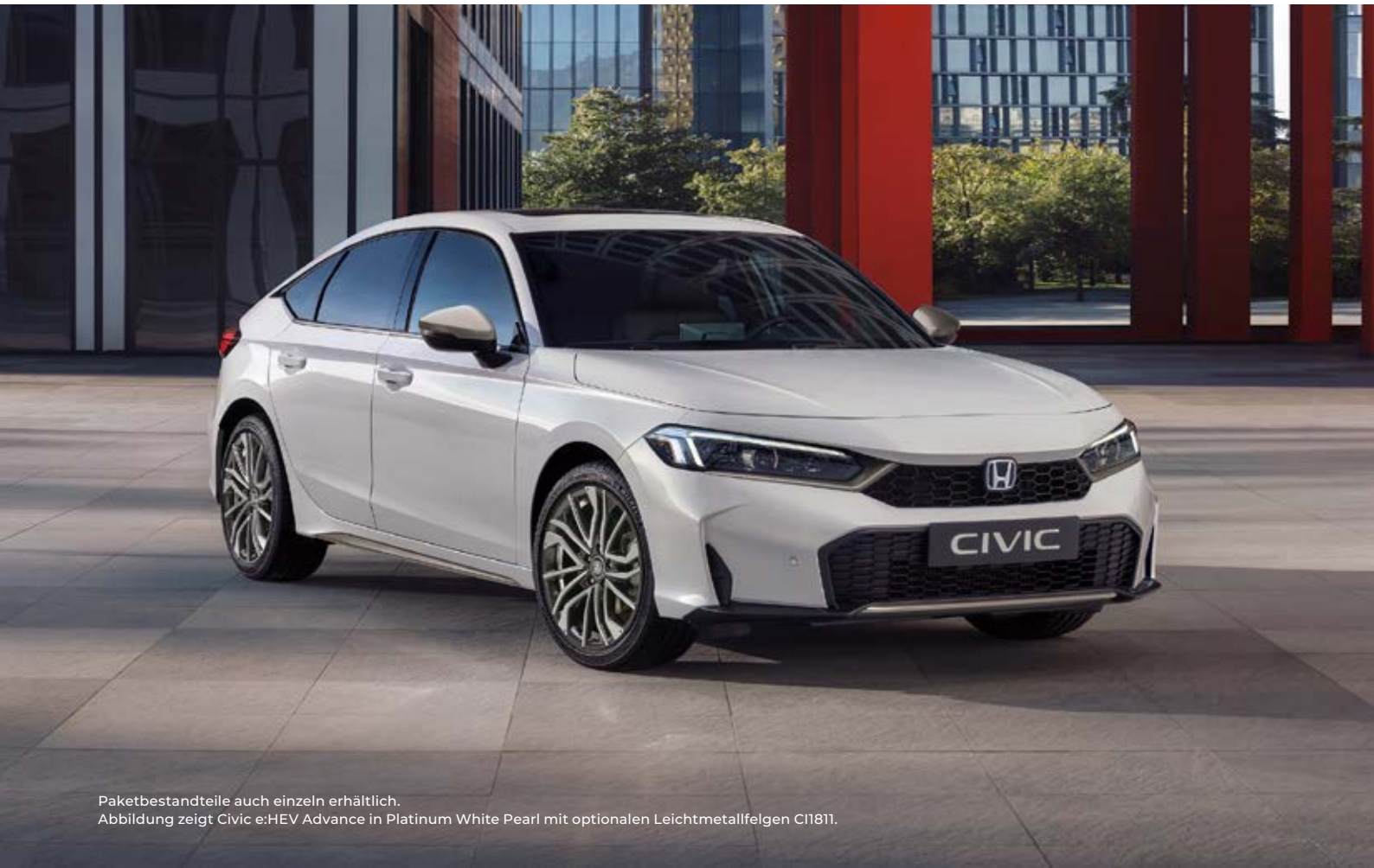
Paketbestandteile auch einzeln erhältlich. Abbildung zeigt Civic e:HEV Advance in Platinum White Pearl mit optionalen Leichtmetallfelgen C11811.

Das Paket enthält: eine untere Kühlergrill-Zierleiste, eine Zierleiste für den Heckstoßfänger, Seitenschweller, Scheinwerfer-Einfassungen und Außenspiegel-Abdeckungen in Patina Bronze.