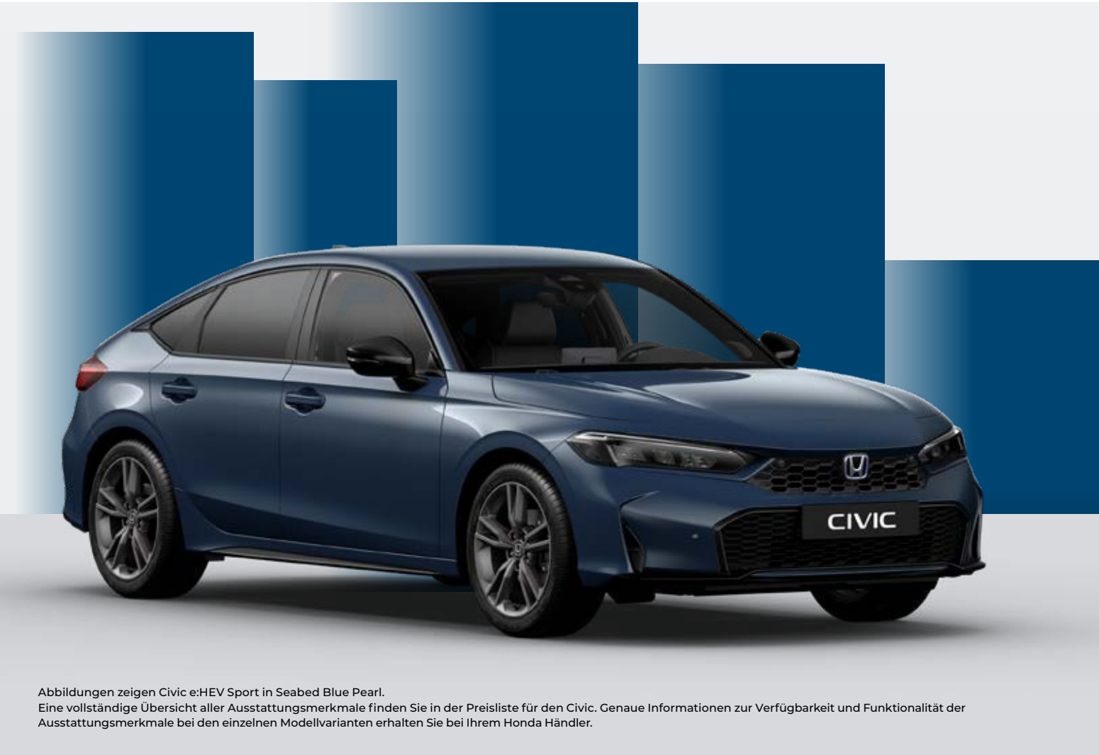
Abbildungen zeigen Civic e:HEV Sport in Seabed Blue Pearl. Eine vollständige Übersicht aller Ausstattungsmerkmale finden Sie in der Preisliste für den Civic. Genaue Informationen zur Verfügbarkeit und Funktionalität der Ausstattungsmerkmale bei den einzelnen Modellvarianten erhalten Sie bei Ihrem Honda Händler.