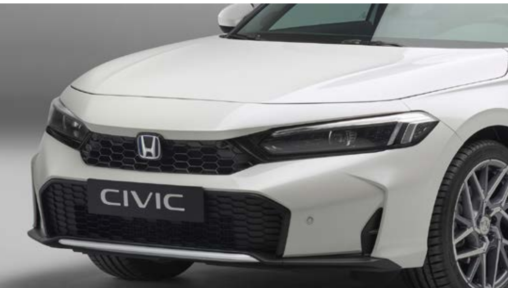
FRONTGRILL Verleihen Sie der Front Ihres Civic mit glänzendem Schwarz einen auffälligen neuen Look.

Das Paket enthält: einen Frontgrill, eine Zierleiste für den Heckstoßfänger und Scheinwerfer-Einfassungen.