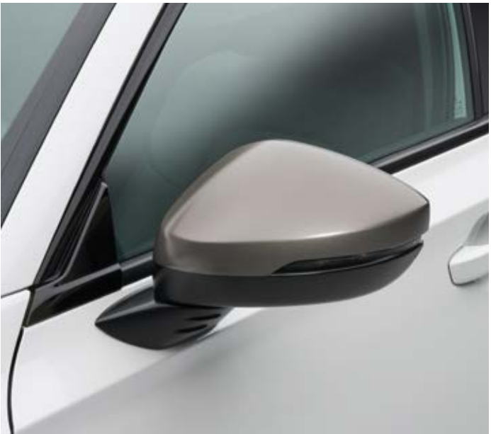
AUSSENSPIEGEL-ABDECKUNGEN Ein Hauch von Bronze verleiht den Außenspiegeln einen hochwertigen, individuellen Look.