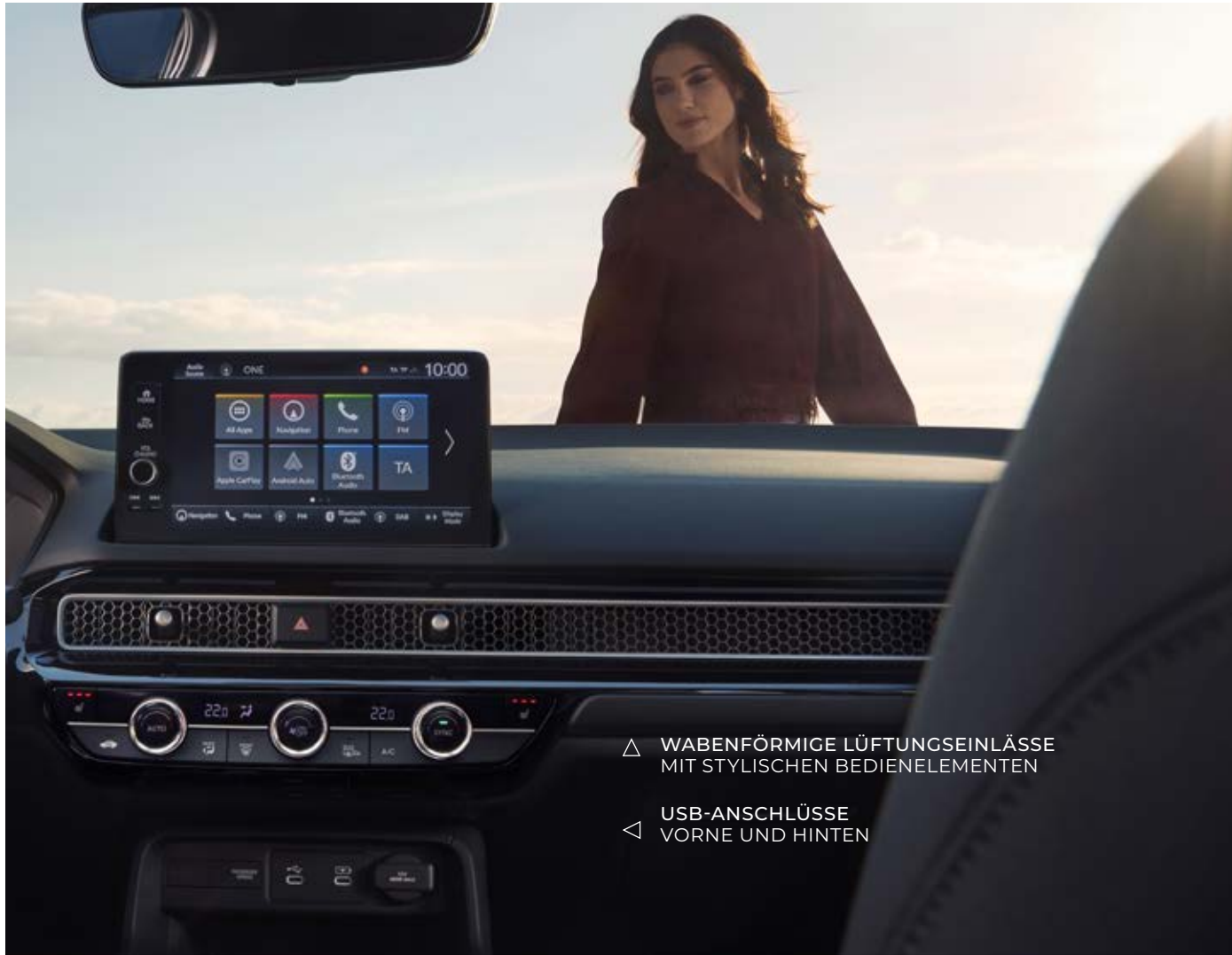
△ WABENFÖRMIGE LÜFTUNGSEINLÄSSE MIT STYLISCHEN BEDIENELEMENTEN ◁ USB-ANSCHLÜSSE VORNE UND HINTEN