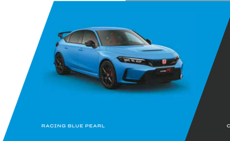
RACING BLUE PEARL