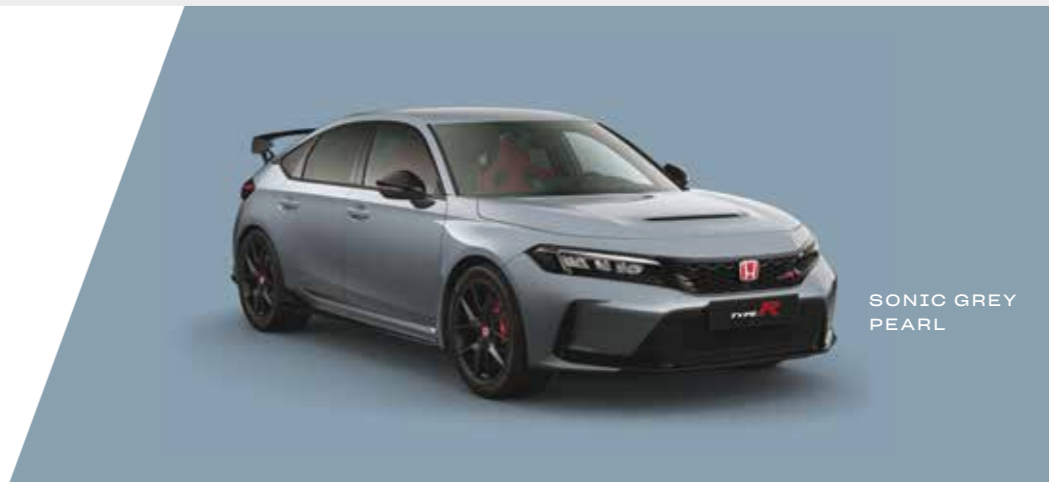
SONIC GREY PEARL