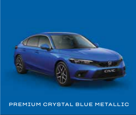
PREMIUM CRYSTAL BLUE METALLIC