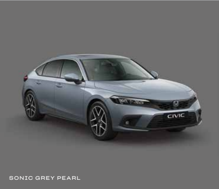
SONIC GREY PEARL