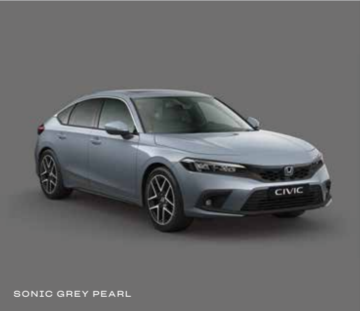
SONIC GREY PEARL