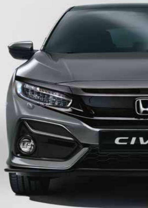
POLISHED METAL METALLIC