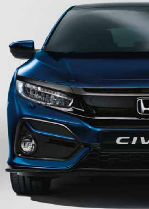
OBSIDIAN BLUE METALLIC