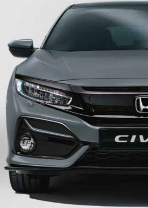
SONIC GREY PEARL