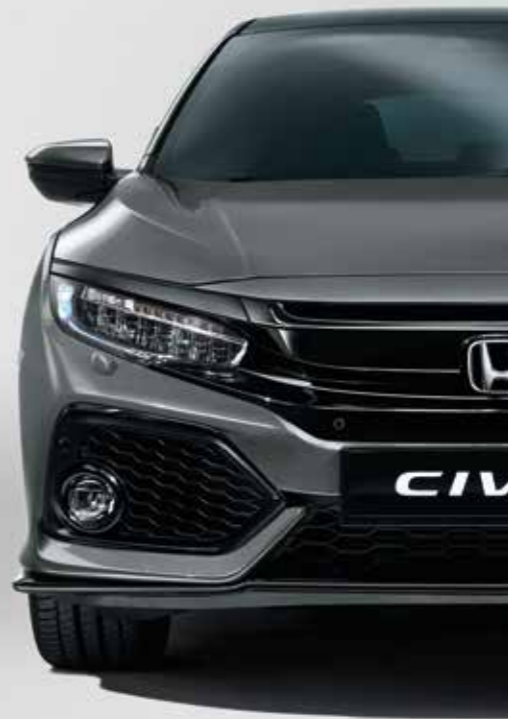
POLISHED METAL METALLIC