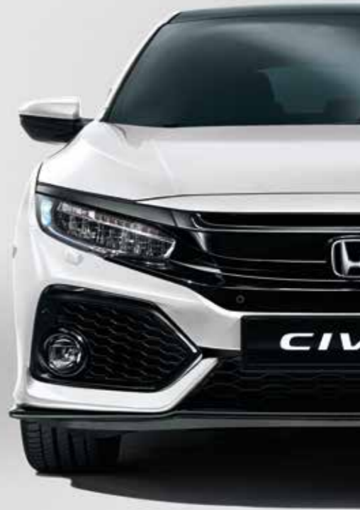
WHITE ORCHID PEARL