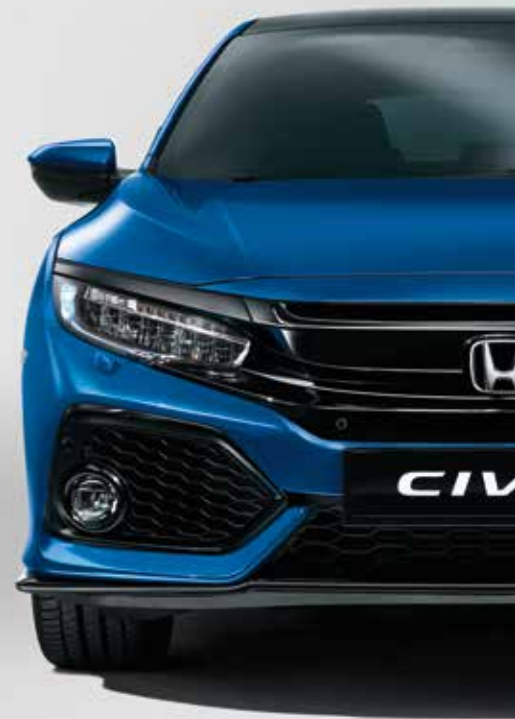
BRILLIANT SPORTY BLUE METALLIC