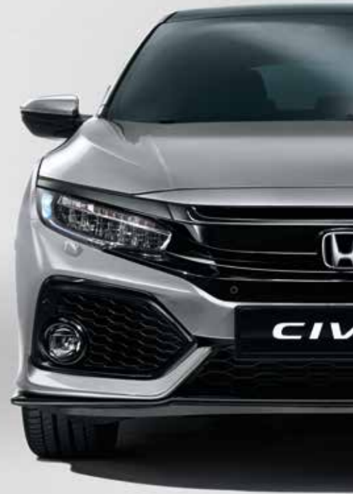
LUNAR SILVER METALLIC