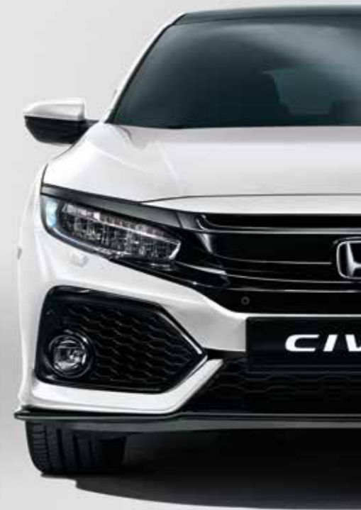
WHITE ORCHID PEARL