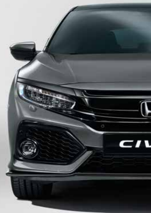
POLISHED METAL METALLIC