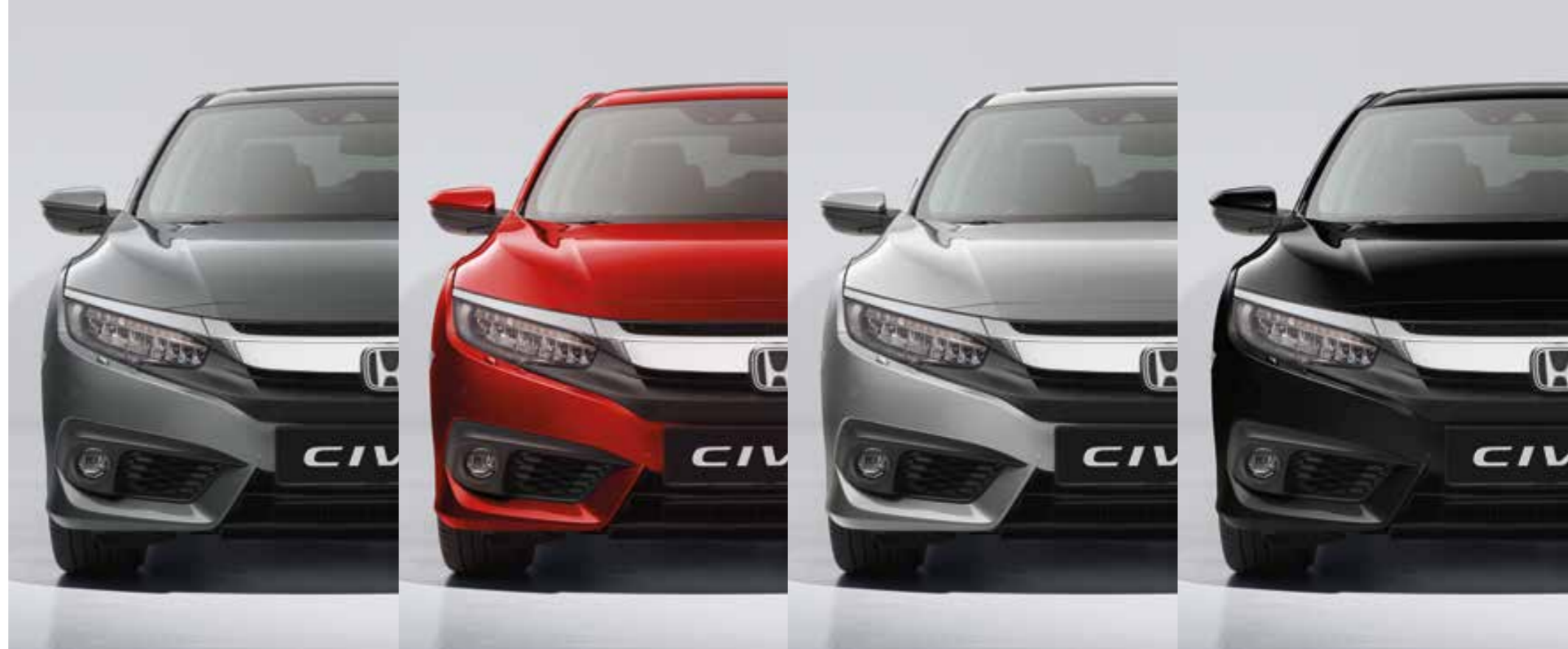
POLISHED METAL METALLIC

In Einklang mit der Flexibilität der Civic Limousine bieten wir Ihnen attraktive Lackierungen, mit denen Sie Ihrer Persönlichkeit Ausdruck verleihen können.