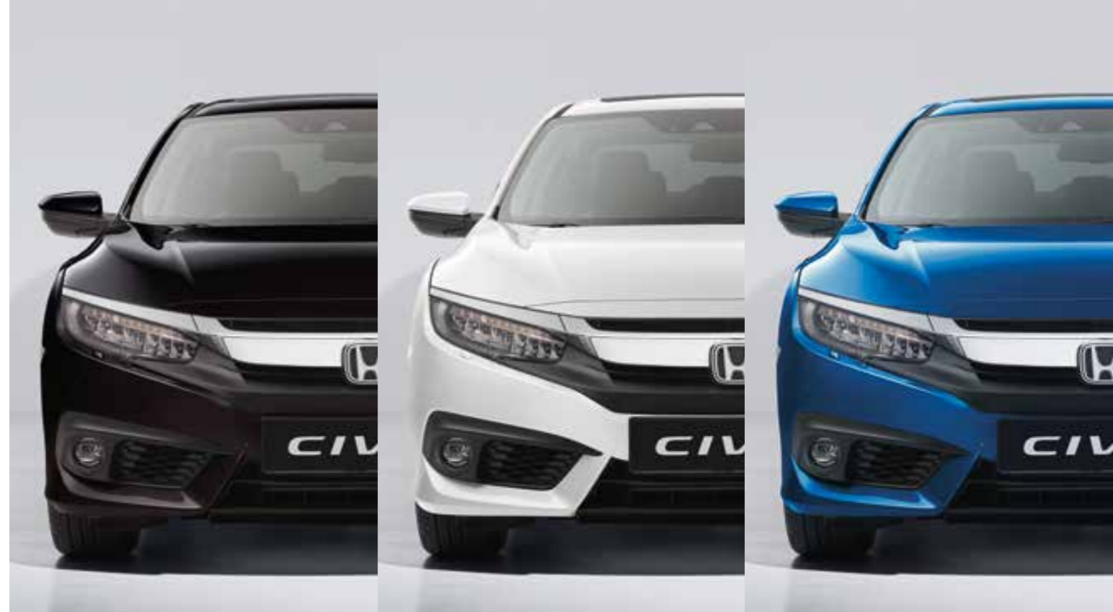
MIDNIGHT BURGUNDY PEARL