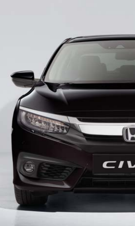
MIDNIGHT BURGUNDY PEARL