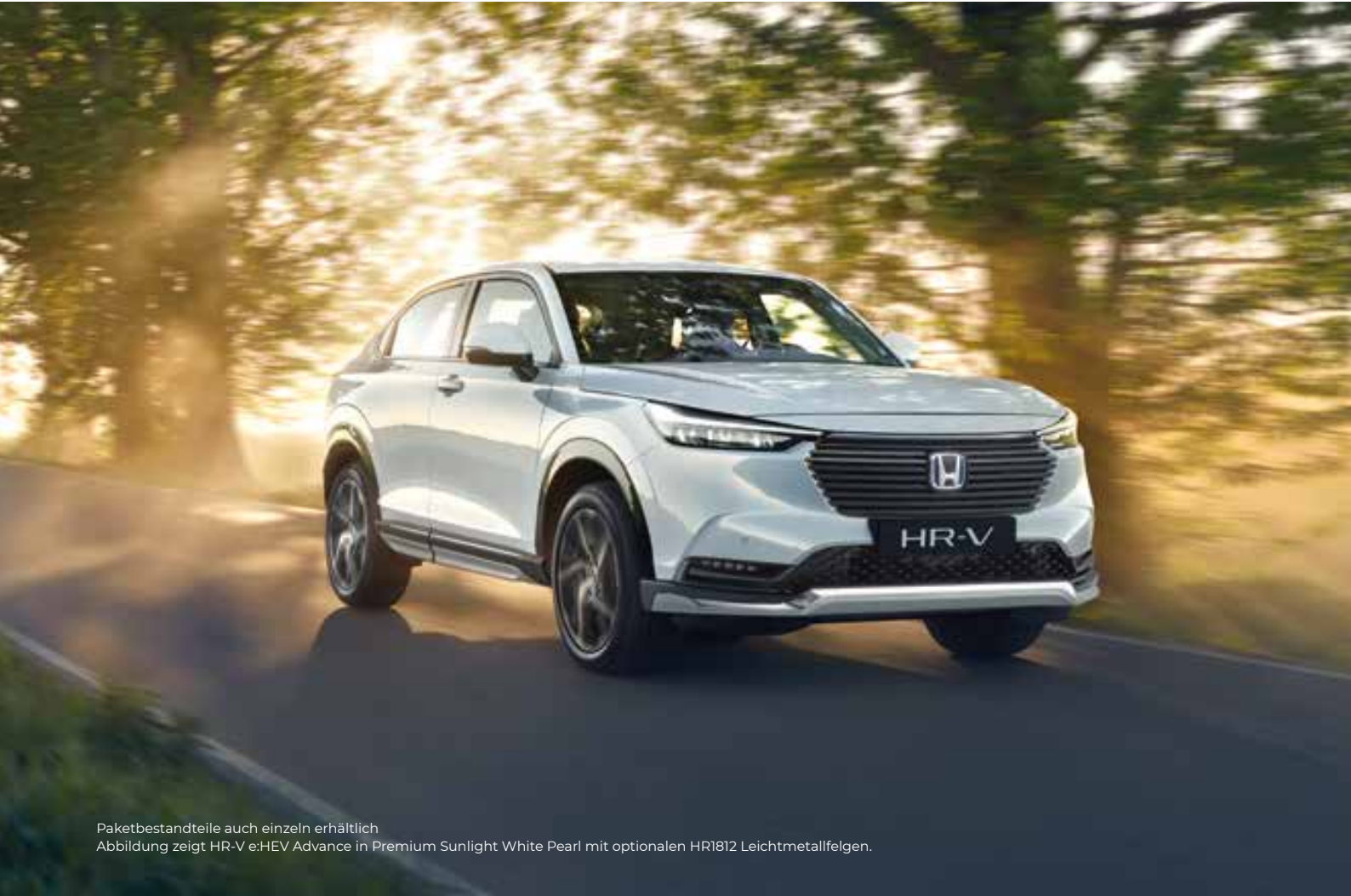
Paketbestandteile auch einzeln erhältlich Abbildung zeigt HR-V e:HEV Advance in Premium Sunlight White Pearl mit optionalen HR1812 Leichtmetallfelgen.