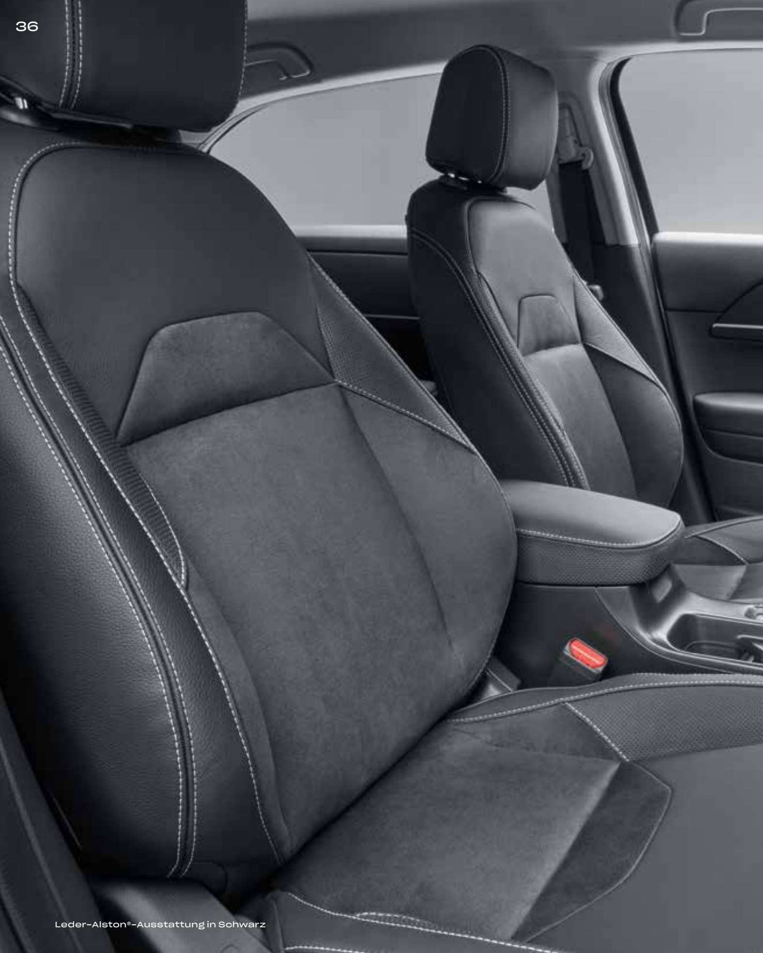
Leder-Alston®-Ausstattung in Schwarz