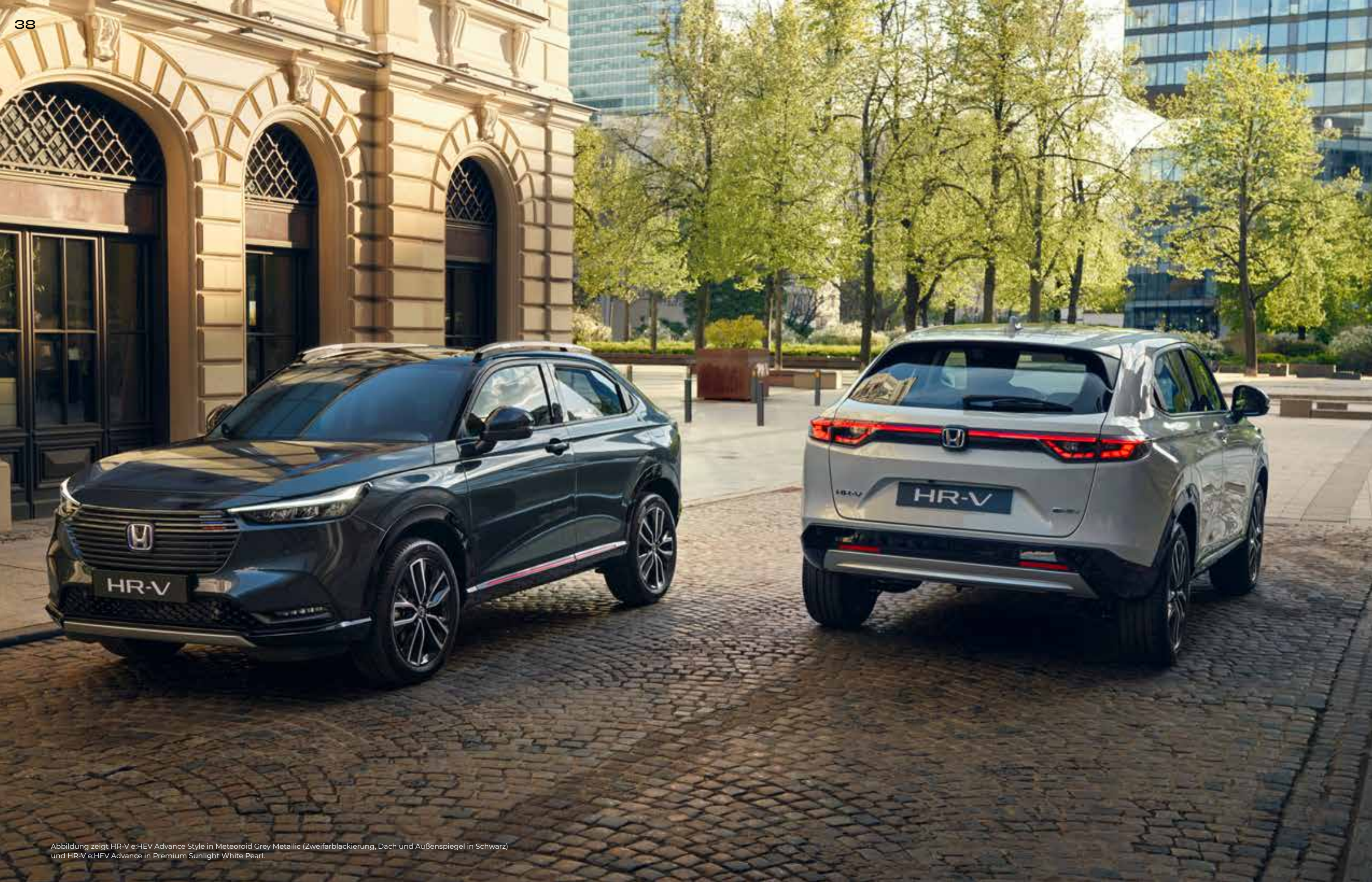
Abbildung zeigt HR-V e:HEV Advance Style in Meteoroid Grey Metallic (Zweifarbblackierung, Dach und Außenspiegel in Schwarz) und HR-V e:HEV Advance in Premium Sunlight White Pearl.