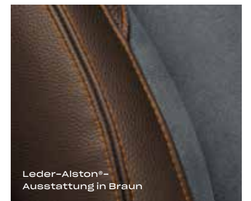
Leder-Alston®- Ausstattung in Braun