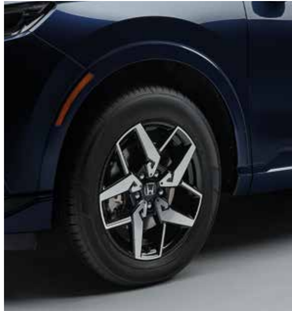
RADLAUFDEKORATION Diese Radlaufdekorationen in Wagenfarbe lassen Ihren CR-V noch souveräner erscheinen.