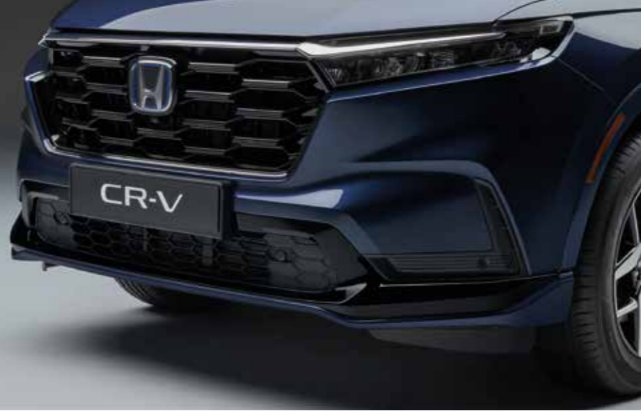
AERODYNAMISCH GEFORMTER FRONTSTOSSFÄNGER Verleihen Sie Ihrem Fahrzeug ein unverkennbar dynamisches Styling mit unserem Frontstoßfänger in Wagenfarbe und Akzenten in Berlina Black.