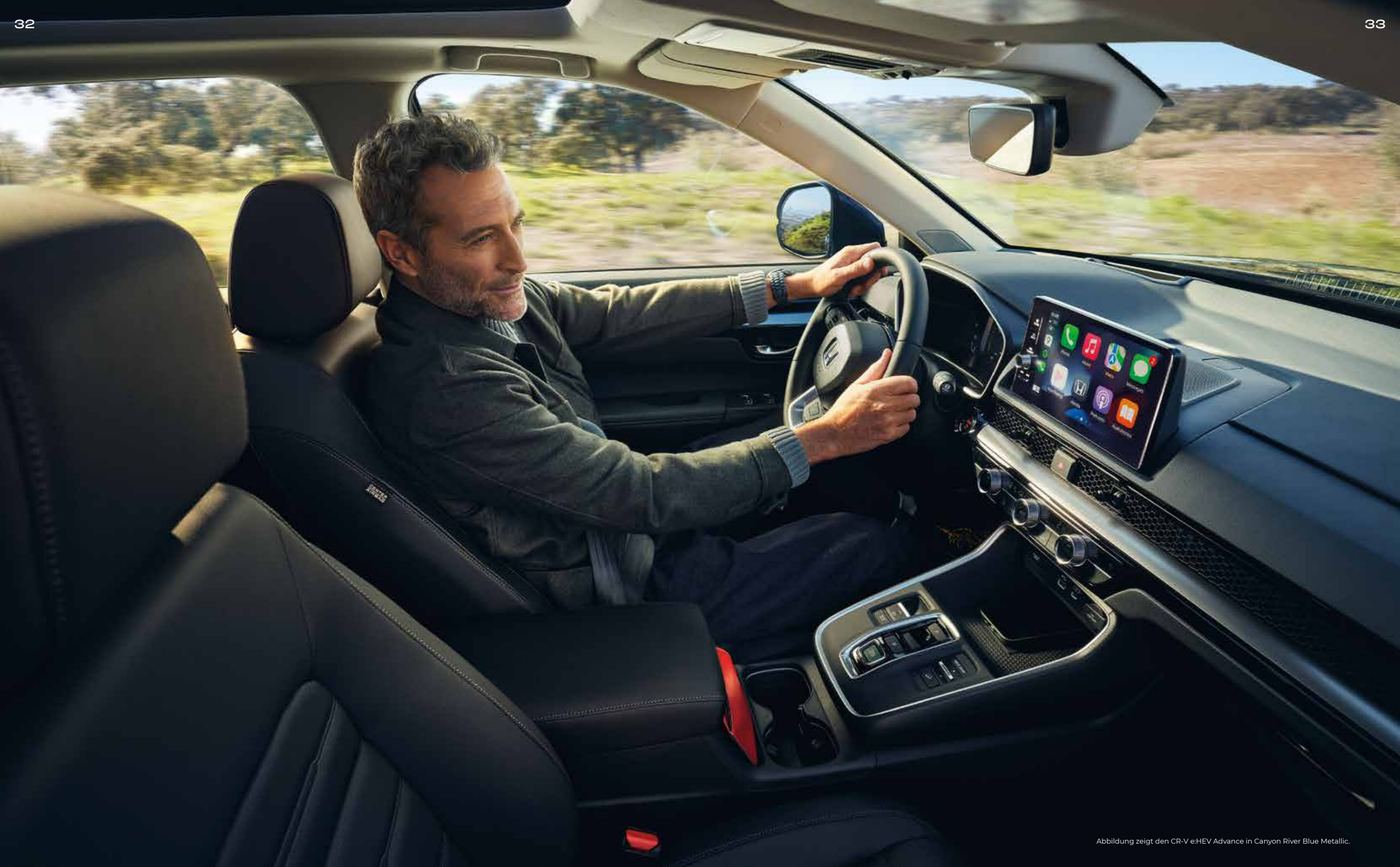
Abbildung zeigt den CR-V e:HEV Advance in Canyon River Blue Metallic.