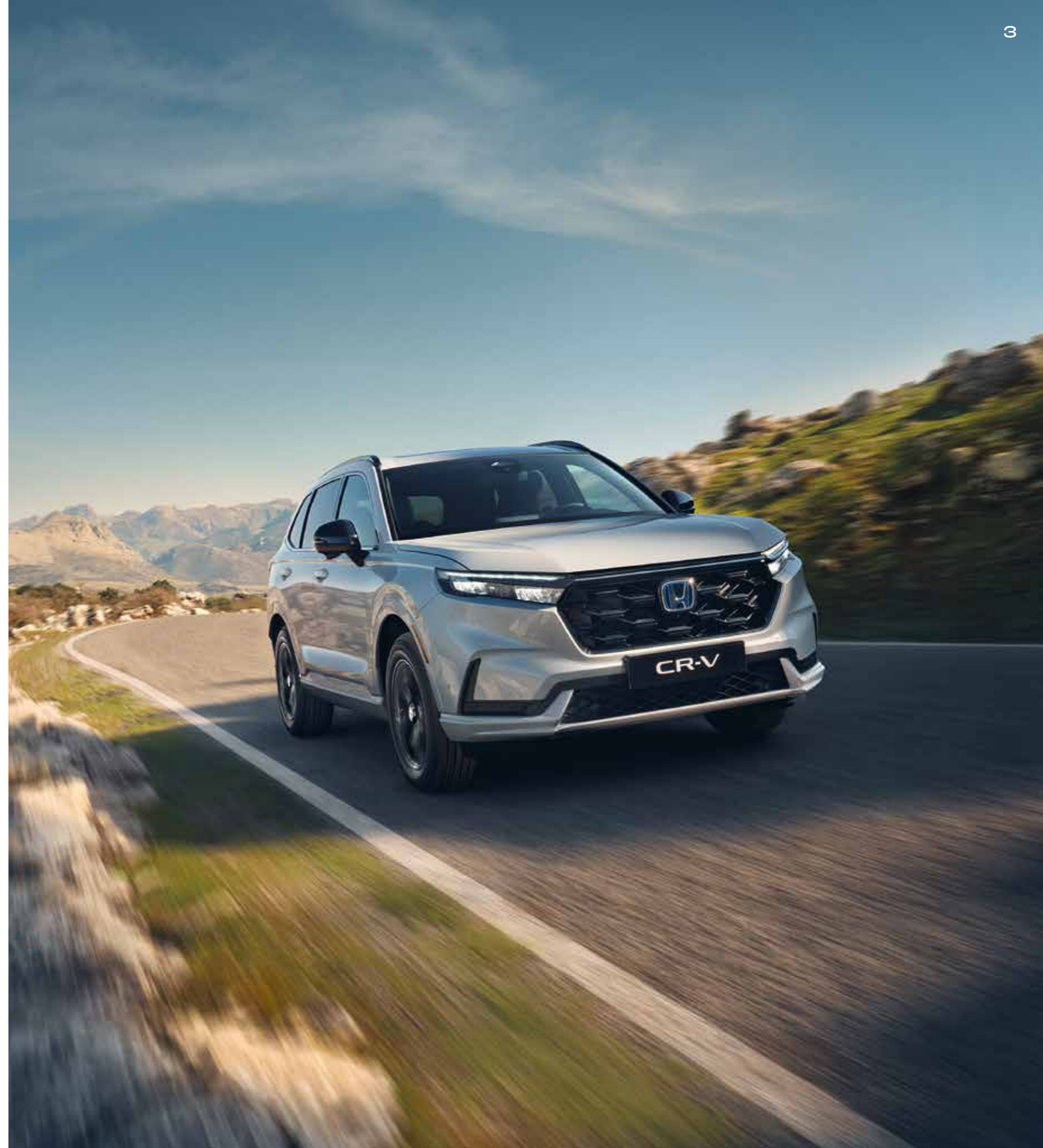
Abbildung zeigt den CR-V e:PHEV Advance Tech in Diamond Dust Pearl.

Kraftstoffverbrauch CR-V e:PHEV im Hybridbetrieb in l/100 km (nach WLTP): Kurzstrecke (niedrig) 5,5; Stadtrand (mittel) 5,0; Landstraße (hoch) 5,3; Autobahn (Höchstwert) 7,8; kombiniert 6,2. CO 2 -Emission in g/km (nach WLTP): kombiniert 139. Energieverbrauch CR-V e:PHEV im Hybrid- und Elektrobetrieb (nach WLTP): (gewichtet, kombiniert) 0,8 l Kraftstoff/100 km und 15,5 kWh Strom/100 km. CO 2 -Emission: (gewichtet, kombiniert) 18 g/km. Elektrische Reichweite (EAER) 82 km und (EAER city) 105 km