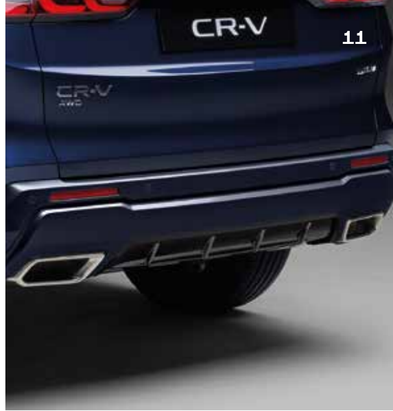
HECKSTOSSFÄNGER Betonen Sie das dynamische Aussehen Ihres CR-V mit diesem Heckstoßfänger in Wagenfarbe mit Akzenten in mit Berlina Black.