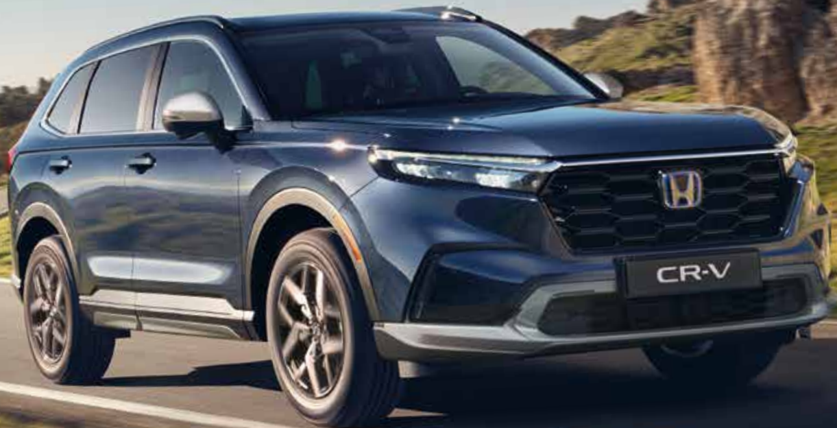
Abbildung zeigt CR-V e:HEV Advance in Canyon River Blue Metallic mit Aero-Paket und Leichtmetallfelgen CR1811.