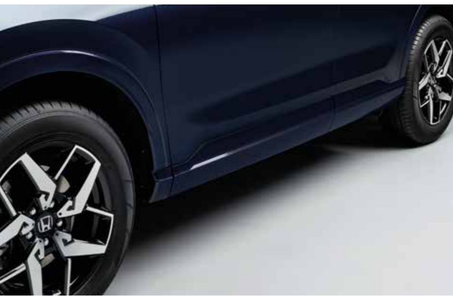
SEITENSCHWELLER Verstärken Sie das sportliche Profil Ihres CR-V mit diesen stilvollen und schnittigen Seitenschwellern in Wagenfarbe.