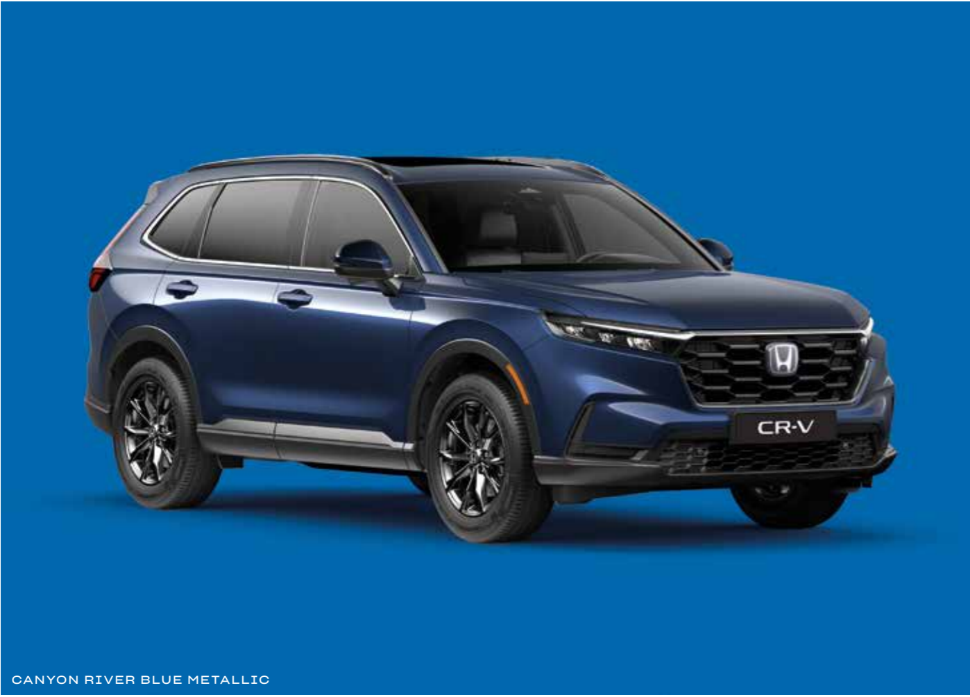
CANYON RIVER BLUE METALLIC

Passend zur Flexibilität des CR-V bieten wir Ihnen attraktive Lackierungen, mit denen Sie Ihrer Persönlichkeit Ausdruck verleihen können.