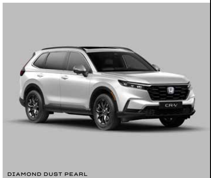
DIAMOND DUST PEARL