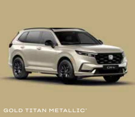
GOLD TITAN METALLIC*