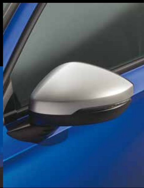
AUSSENSPIEGEL-ABDECKUNGEN Führen Sie das Nordic Silver-Thema mit diesen passenden Außenspiegel-Abdeckungen fort.