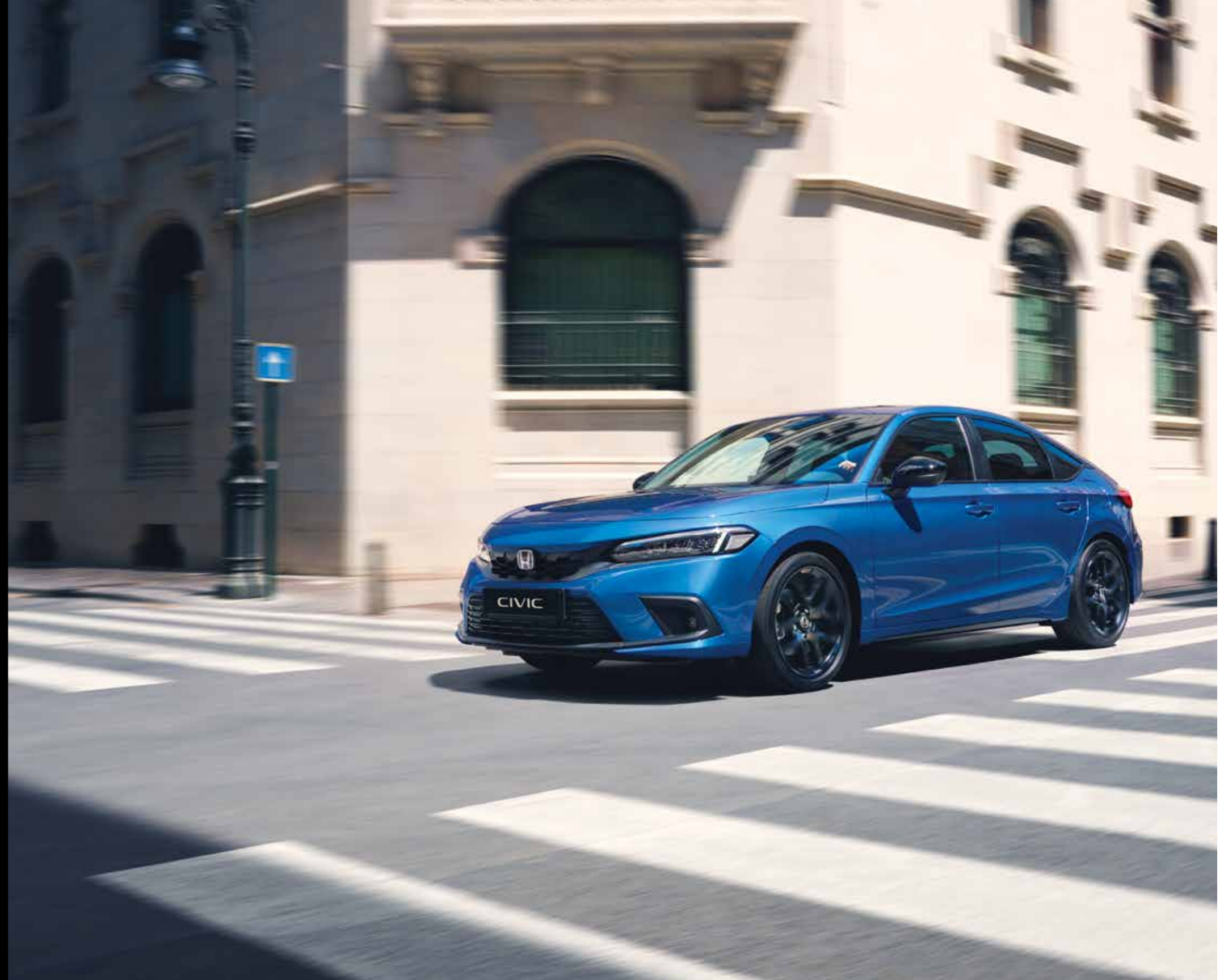
Abbildung zeigt Civic e:HEV Sport in Premium Crystal Blue Metallic.

Kraftstoffverbrauch Civic e:HEV in l/100 km: kombiniert 4,7–5,0. CO 2 -Emissionen in g/km: kombiniert 108–114. CO 2 -Klasse: C.