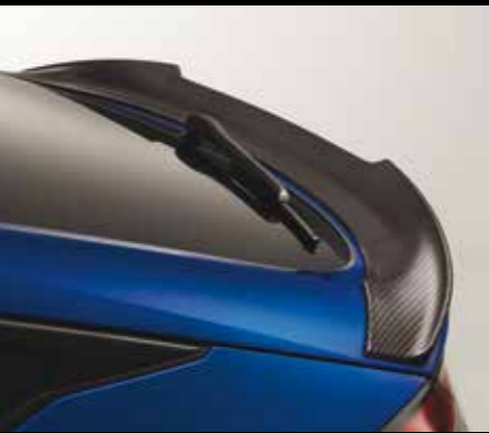
DUCKTAIL-HECKSPOILER Der Ducktail-Heckspoiler in Carbon-Optik sorgt für einen sportlichen Look der Heckklappe.