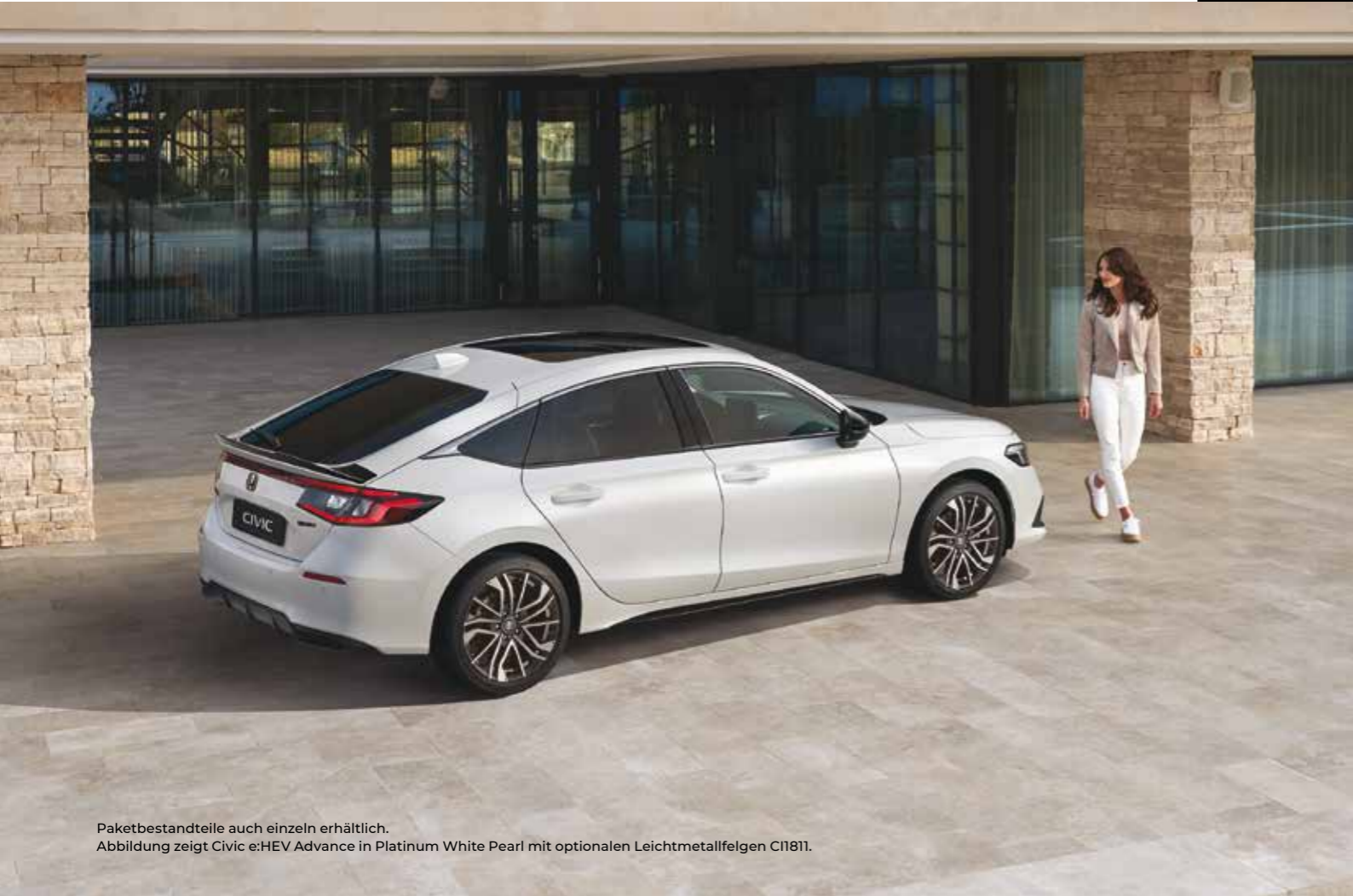
Paketbestandteile auch einzeln erhältlich. Abbildung zeigt Civic e:HEV Advance in Platinum White Pearl mit optionalen Leichtmetallfelgen CI1811.

Mit diesem Paket verstärken Sie den sportlichen Look Ihres Civic. Das Paket enthält: Ducktail-Heckspoiler und Seitenschweller in Berlina Black sowie das Black Emblem-Paket in Dark Chrome, bei den Varianten Elegance und Advance zusätzlich Außenspiegel-Abdeckungen in Berlina Black.