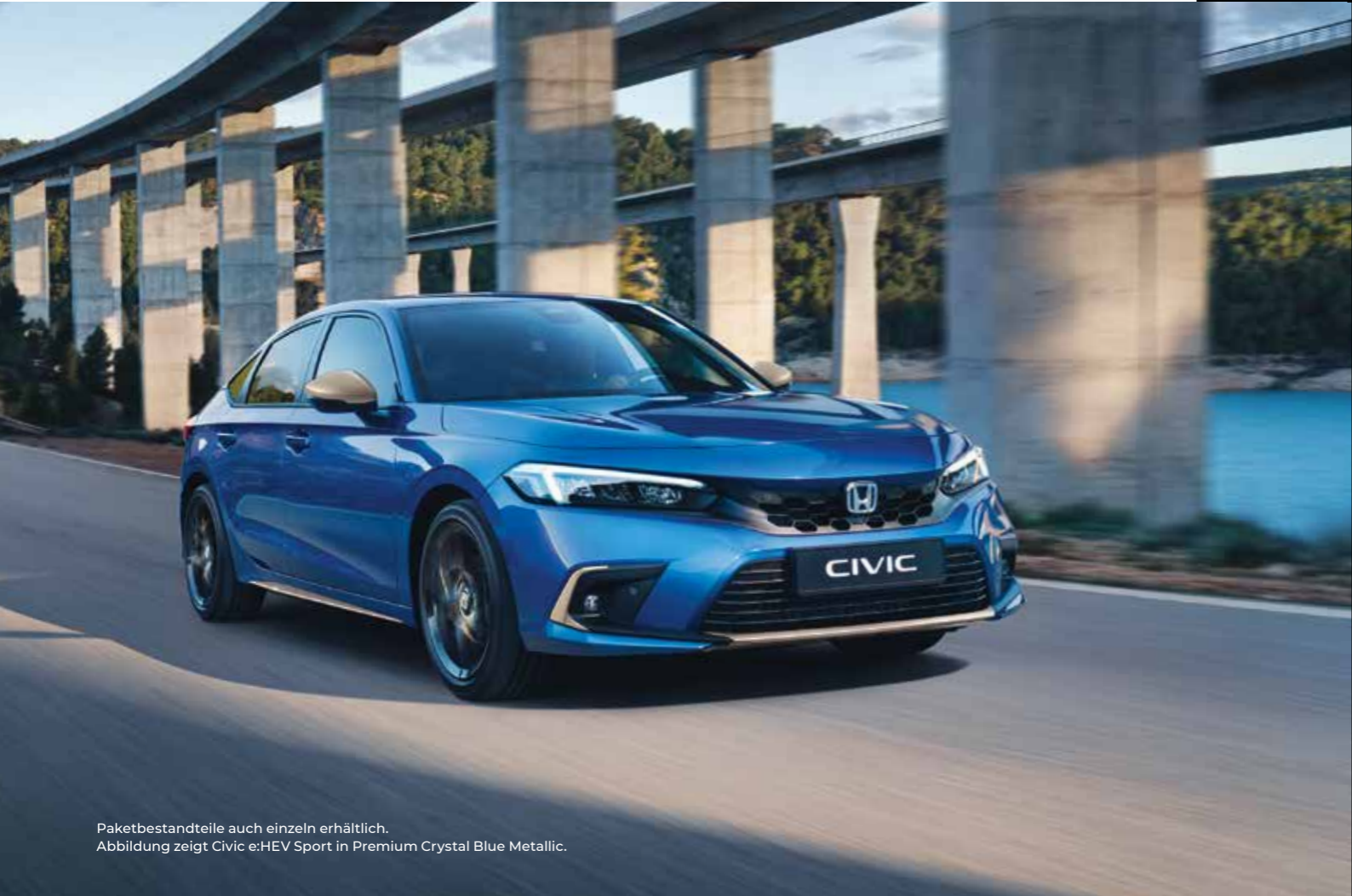
Paketbestandteile auch einzeln erhältlich. Abbildung zeigt Civic e:HEV Sport in Premium Crystal Blue Metallic.

Das Ilmenite Titanium-Paket ist ein Eye-Catcher. Das Paket enthält: Stoßstangen-Zierleisten für vorn und hinten, Seitenschweller-Satz, Nebelscheinwerfer-Einfassungen und Außenspiegel-Abdeckungen – alle Teile in Ilmenite Titanium.