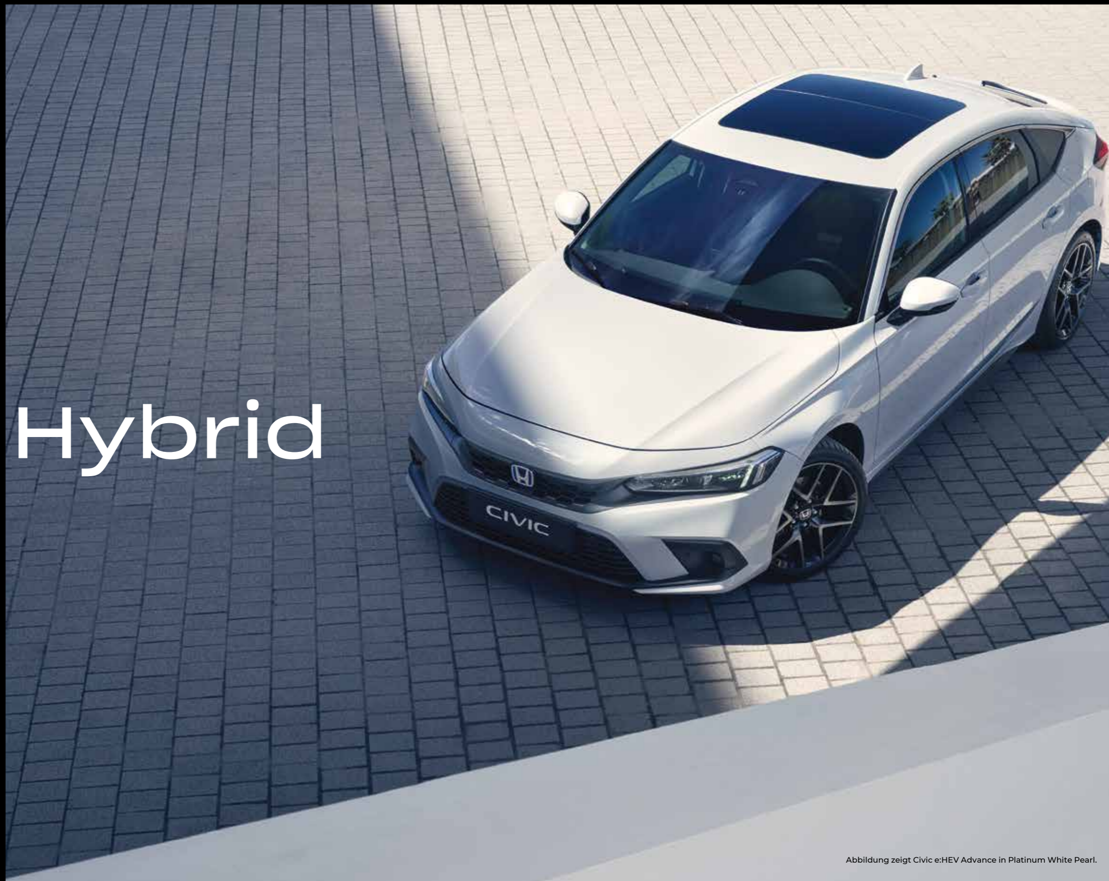
Abbildung zeigt Civic e:HEV Advance in Platinum White Pearl.