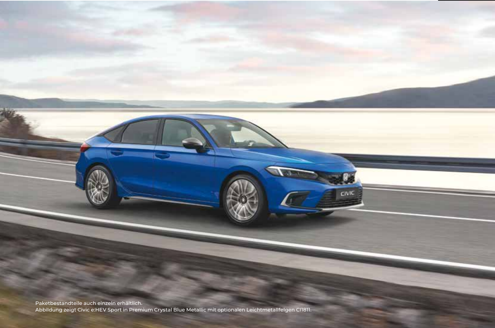
Paketbestandteile auch einzeln erhältlich. Abbildung zeigt Civic e:HEV Sport in Premium Crystal Blue Metallic mit optionalen Leichtmetallfelgen C11811.

Veredeln Sie das Premium-Feeling Ihres Civic mit dem Nordic Silver-Paket. Das Paket enthält: Stoßstangen-Zierleisten vorn und hinten, einen Seitenschweller-Satz, Nebelscheinwerfer-Einfassungen und Außenspiegel-Abdeckungen – alle in Nordic Silver gehalten.