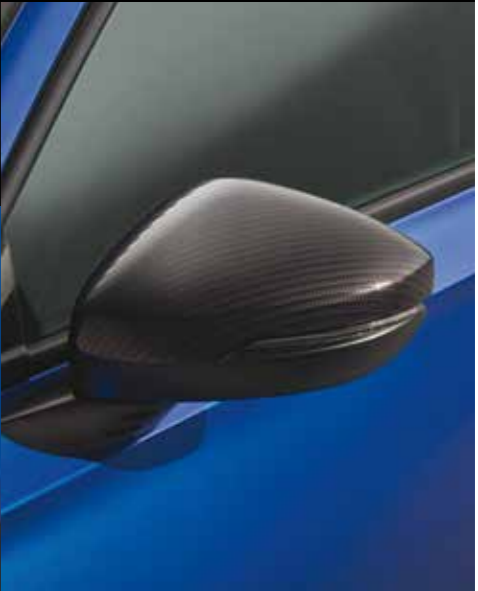
AUSSENSPIEGEL-ABDECKUNGEN Die Außenspiegel-Abdeckungen in Carbon-Optik lassen Ihr Fahrzeug noch dynamischer wirken.