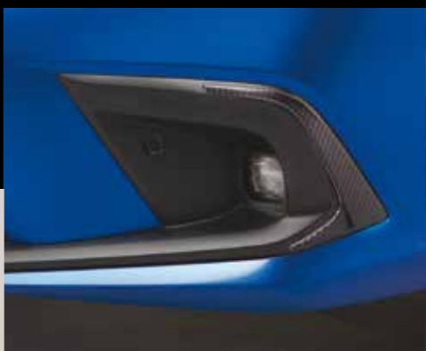
NEBELSCHEINWERFER-EINFASSUNG Die Nebelscheinwerfer-Einfassung in Carbon-Optik ergänzt perfekt das fließende Design der Front Ihres Civic.