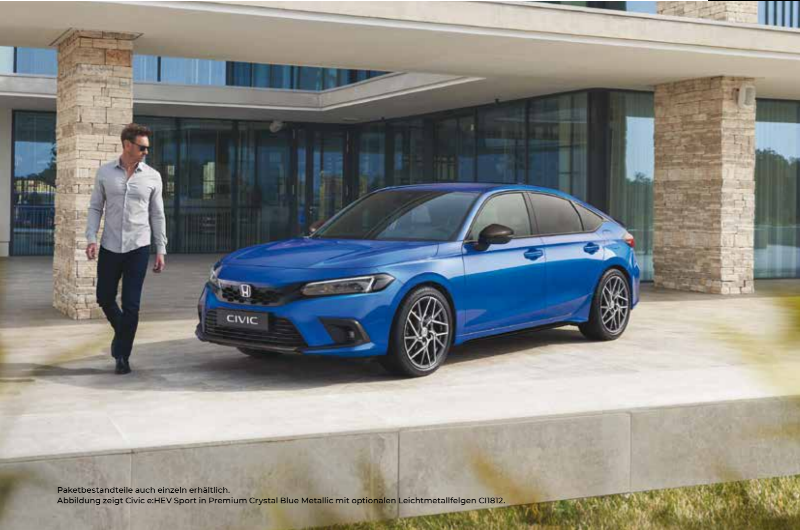
Paketbestandteile auch einzeln erhältlich. Abbildung zeigt Civic e:HEV Sport in Premium Crystal Blue Metallic mit optionalen Leichtmetallfelgen CI1812.

Das Carbon Style-Paket hat alles, was sich ein Sportwagen-Liebhaber für sein Auto wünscht. Das Paket enthält: Stoßstangen-Zierleiste vorn und hinten, Nebelscheinwerfer-Einfassung, Heckspoiler und Außenspiegel-Abdeckungen im Carbon-Look. Das Carbon Style-Paket ist auch als „Light“-Version ohne Außenspiegel-Abdeckungen erhältlich.