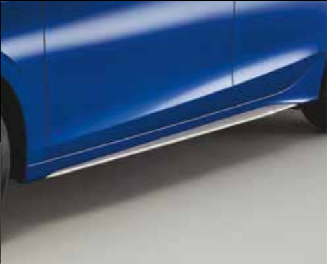
SEITENSCHWELLER Mit den Seitenschwellern in Nordic Silver bekommt Ihr Civic das gewisse Extra.