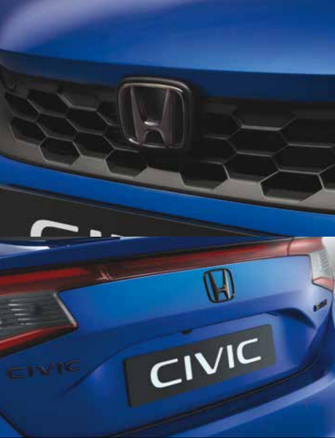
SCHWARZE EMBLEME FÜR VORN UND HINTEN Auf die kleinen Details kommt es an. Das Black Emblem-Paket ergänzt perfekt den sportlichen Look Ihres Civic. Es enthält zwei schwarze Honda Embleme für vorn und hinten, einen schwarzen Civic Schriftzug sowie einen schwarzen e:HEV Schriftzug – alle Teile in Dark Chrome.