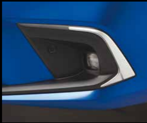
NEBELSCHEINWERFER-EINFASSUNG Die Nebelscheinwerfer-Einfassung in Nordic Silver ergänzt perfekt das fließende Design der Front Ihres Civic.