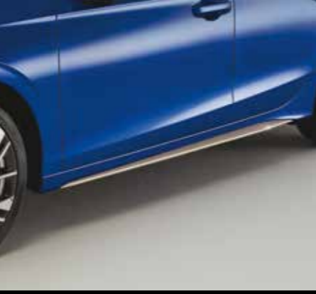
SEITENSCHWELLER Die Seitenschweller in Ilmenite Titanium demonstrieren sportlichen Look.