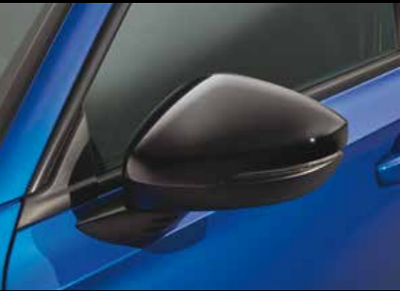
AUSSENSPIEGEL-ABDECKUNGEN Machen Sie Ihren Civic mit den stilvollen Außenspiegel-Abdeckungen in Berlina Black noch ein wenig einzigartiger.