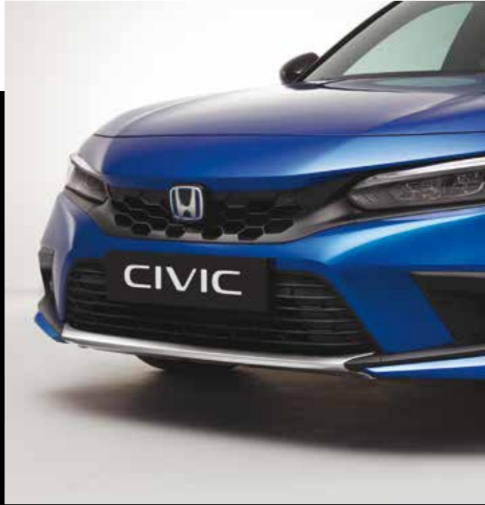
STOSSSTANGEN-ZIERLEISTEN Für eine sportlich-elegante Note gibt es die Stoßstangen-Zierleisten in Nordic Silver für vorn und hinten.