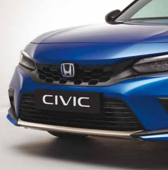
STOSSSTANGEN-ZIERLEISTEN Noch profilierter sieht der Civic mit den Stoßstangen-Zierleisten für vorn und hinten in Ilmenite Titanium aus.