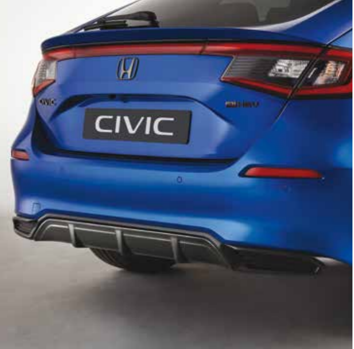
STOSSSTANGEN-ZIERLEISTEN Die Stoßstangen-Zierleisten im Carbon-Look für vorn und hinten geben Ihrem Auto ein sportlich-dynamisches Profil.