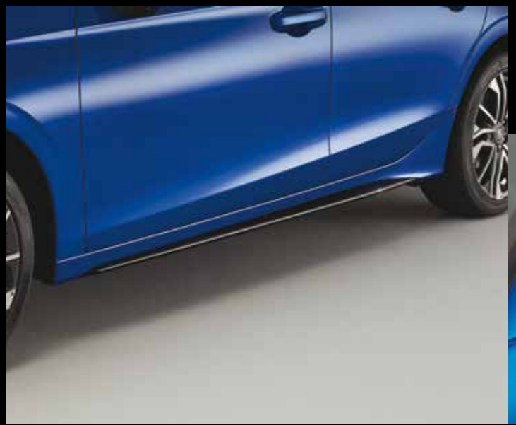
SEITENSCHWELLER Die Seitenschweller in Berlina Black verleihen Ihrem Fahrzeug einen muskulösen Look.