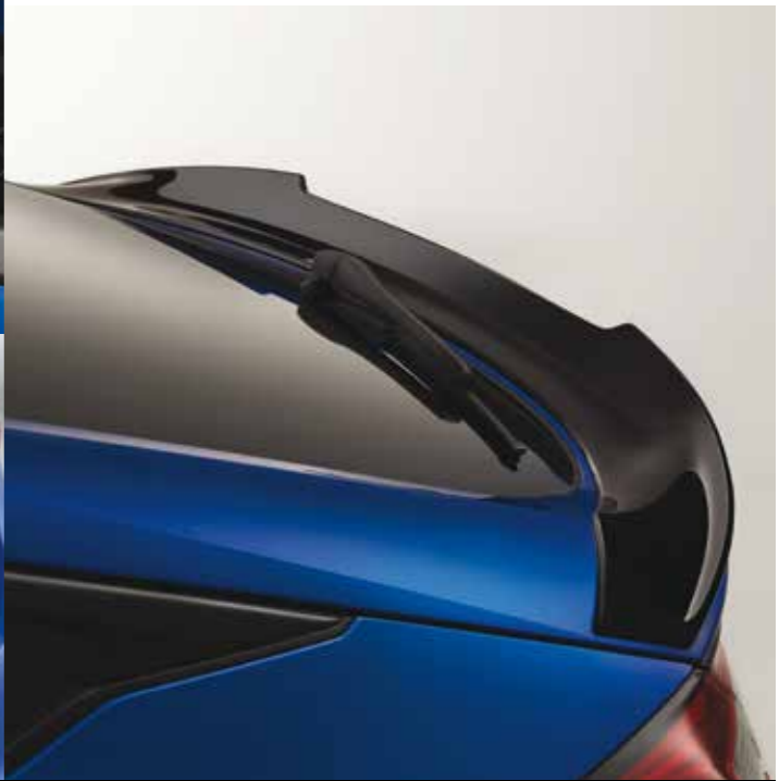
DUCKTAIL-HECKSPOILER Dieser Ducktail-Heckspoiler in Berlina Black verleiht der Heckansicht des Civic eine sportlich-dynamische Note.