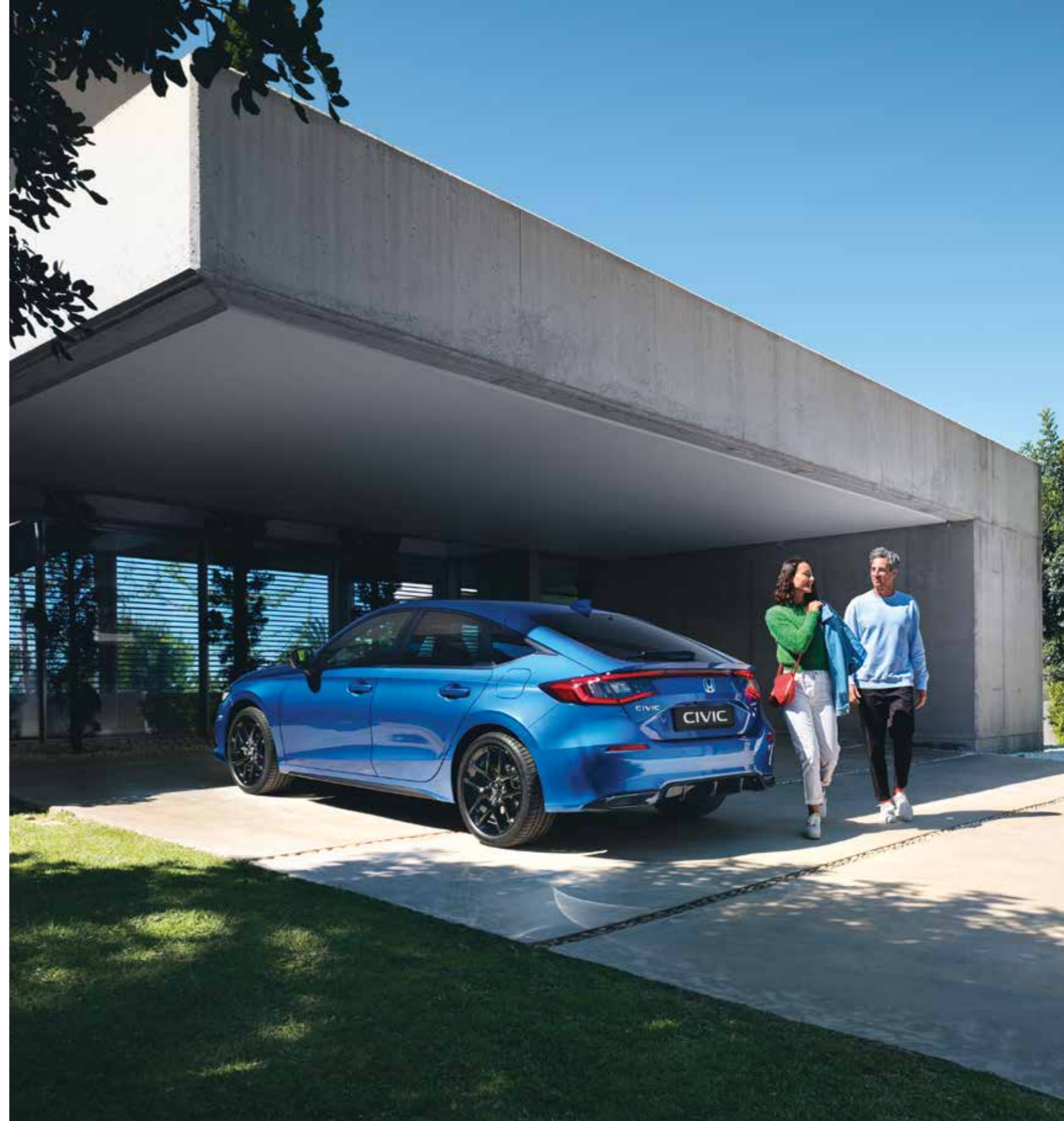
Abbildung zeigt Civic e:HEV Sport in Premium Crystal Blue Metallic.

Eine vollständige Übersicht aller Sicherheits- und Ausstattungsmerkmale finden Sie in der Preisliste für den Civic. Genaue Informationen zur Verfügbarkeit und Funktionalität der Ausstattungsmerkmale bei den einzelnen Modellvarianten erhalten Sie bei Ihrem Honda Händler.