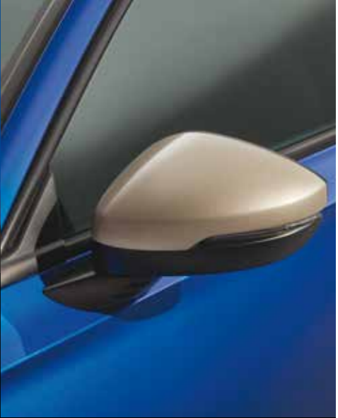
AUSSENSPIEGEL-ABDECKUNGEN Die Außenspiegel-Abdeckungen in Ilmenite Titanium runden den Look ab.