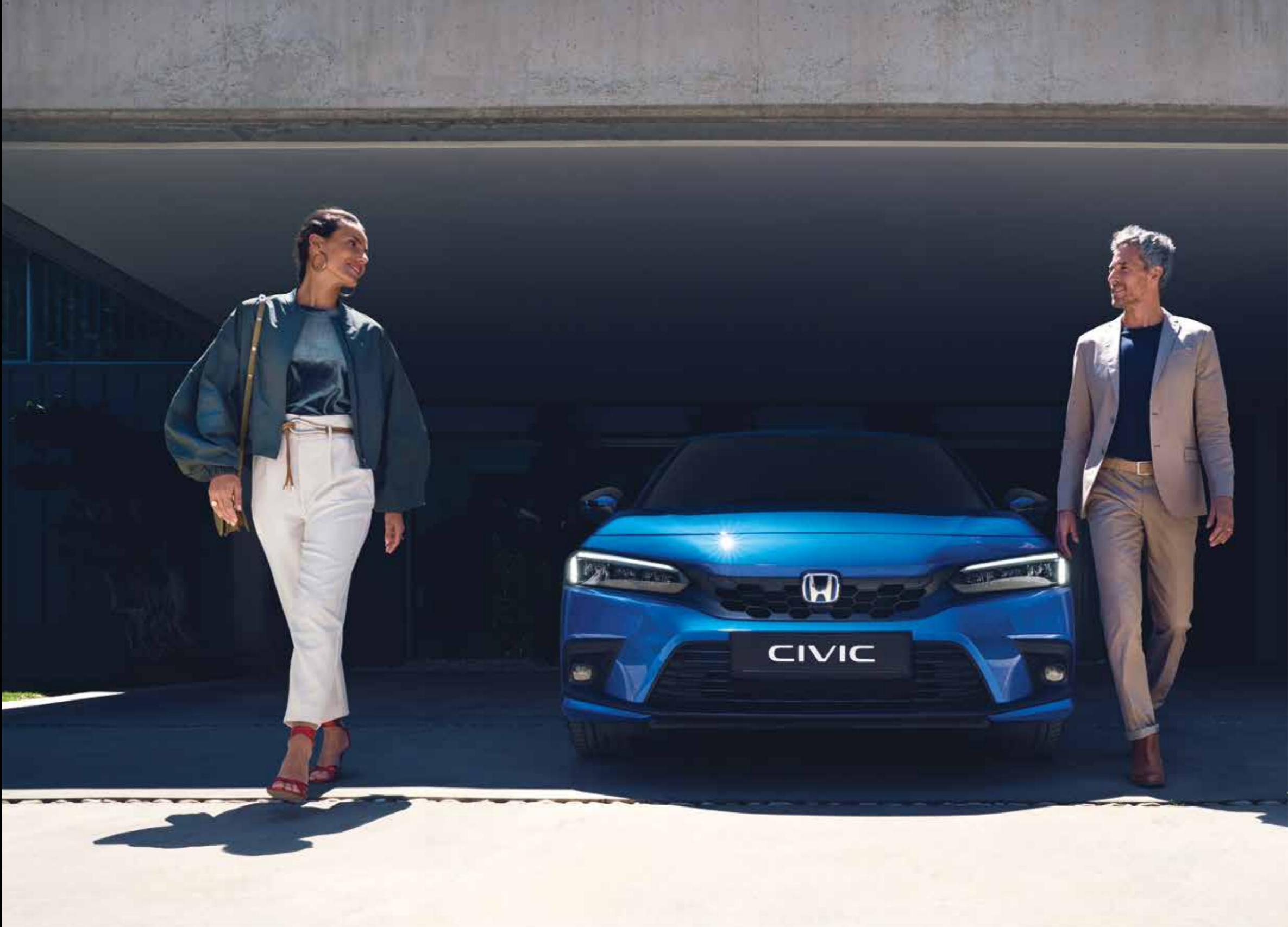
Abbildung zeigt Civic e:HEV Sport in Premium Crystal Blue Metallic.