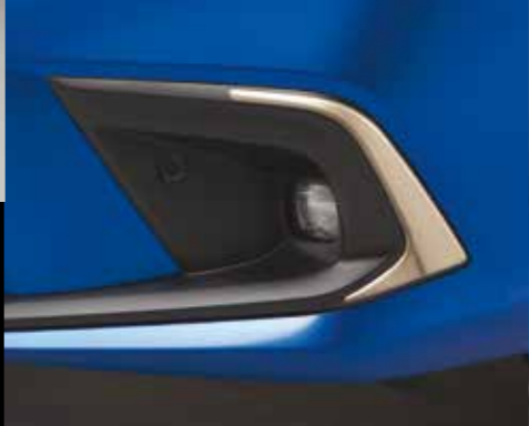
NEBELSCHEINWERFER-EINFASSUNG Mit der Nebelscheinwerfer-Einfassung in Ilmenite Titanium geben Sie Ihrem Civic einen stylischen Touch.