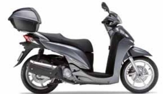
Moondust Silver Metallic