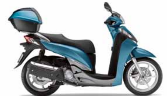
Satin Blue Metallic