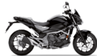
Matt Gunpowder Black Metallic / Matt Gray

In Kombination mit dem noch sportlicheren Look bekommt die neue NC750S frische Farben, die sowohl in der City als auch über Land die Blicke auf sich ziehen.