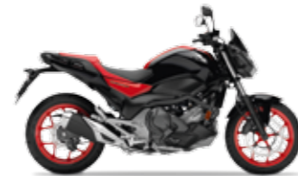
Graphite Black / Red