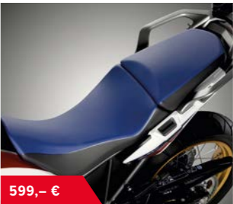
Hohe Sitzbank 08R00-MJP-..... F50ZA R148L Rally G50ZA PBA04L Tricolor G50ZB NH1L Schwarz • 30 mm höhere Sitzposition • maximale Sitzhöhe 900 mm