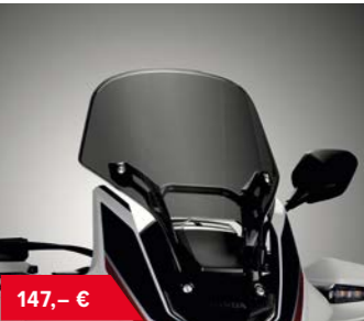
Windscheibe getönt 08R75-MJP-G50ZB • 70 % schwarz getönt • Höhe und Breite gleich Standardscheibe • nicht eintragungspflichtig, ist Bestandteil der EG-BE