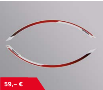
Felgendekor Aufklebersatz 08F70-MJP-..... F50ZA R334 Victory Red (CRF Rally) F50ZD NHA30M Digital Silver Metallic F50ZJ R305C Tricolor