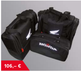
Innenpacktasche Koffersatz 08L76-MJP-G51 • inklusive Schultertragegurt