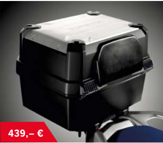
Top Case 35L 08HME-MJP-TBCOM16 • Aluminium Top Case Verkleidung • 1 Offroad Helm kann verstaut werden • One-Key Option