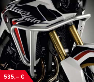
Dekorrahmen 08P71-MJP-G50 • Alu eloxierte Zierbügel für ein noch robusteres Design