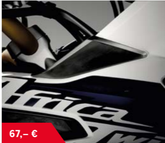
Windabweisersatz oben 08R74-MJP-G50 • aus geformten Polyurethan, schwarz