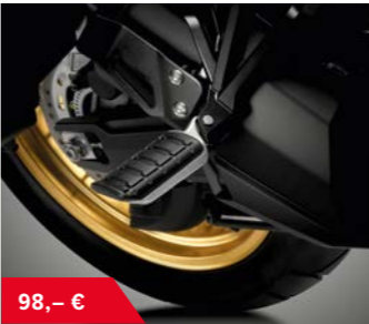
Fußrasten für den Soziusfahrer 08R71-MJP-G50 • Aluminium Fußrasten breit mit Gummieinfassung