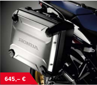
Koffersatz 08HME-MJP-PCOM16 • rechter Koffer 30 Liter Fassungsvermögen • linker Koffer 40 Liter Fassungsvermögen • im linken Koffer kann ein Helm verstaut werden • Aluminium Kofferverkleidung • One-Key Option