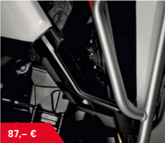
Windabweisersatz unten 08R73-MJP-G50 • aus geformten Polyurethan, schwarz