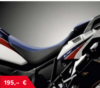
Niedrige Sitzbank 08R01-MJP-..... F50ZA R148L Rally G50ZA PBA04L Tricolor G50ZB NH1L Schwarz • 30 mm niedrigere Sitzposition • minimale Sitzhöhe 820 mm