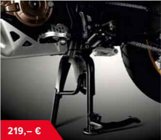
Hauptständer 08M70-MJP-G50 • für mehr Sicherheit beim Parken auf diversen Bodenflächen • erleichtert das Arbeiten am Hinterrad