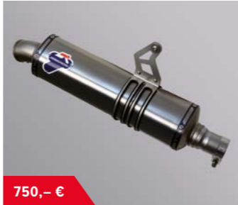
Termignoni Sportschalldämpfer 08F99-MJP-900