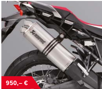
Akrapovic Sportschalldämpfer 08F88-MJP-900