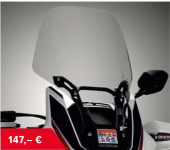
Hohe Windscheibe 08R70-MJP-G50 • 85 mm höher • 30 mm breiter als Standardscheibe • nicht eintragungspflichtig, ist Bestandteil der EG-BE