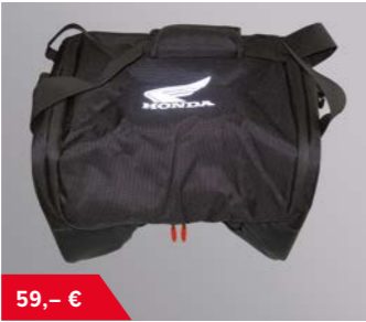
Innenpacktasche Top Case 08L75-MJP-G51 • inklusive Schultertragegurt