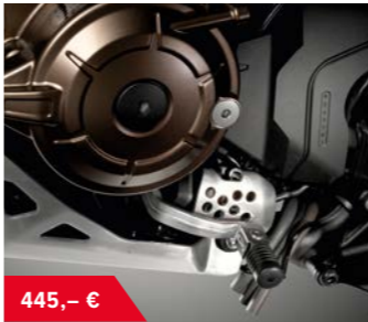
Fußschalthebel DCT 08U70-MJP-G80 • Komfort Schaltpedal Kit zum Schalten im manuellen Modus