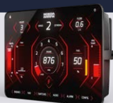
7" Touchscreen-Multifunktionsdisplay BF40-BF250 NMEA2000®