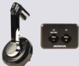
Seiten-Einbau-Box rechte Bordwand mit Funktionstasten

Flexible Zubehörbestellung: Ab dem Modell BF115J – BF250D elektronisch (D) geschaltete Motoren besteht die Möglichkeit, die Schaltbox individuell zu Ihrem Bootstyp anzupassen. Das 4,3" MFD Display kann bis zu 4 Motoren aus dem NMEA2000 Netzwerk anzeigen. Fragen Sie hierzu Ihren Händler für weitere Informationen zum Lieferumfang.