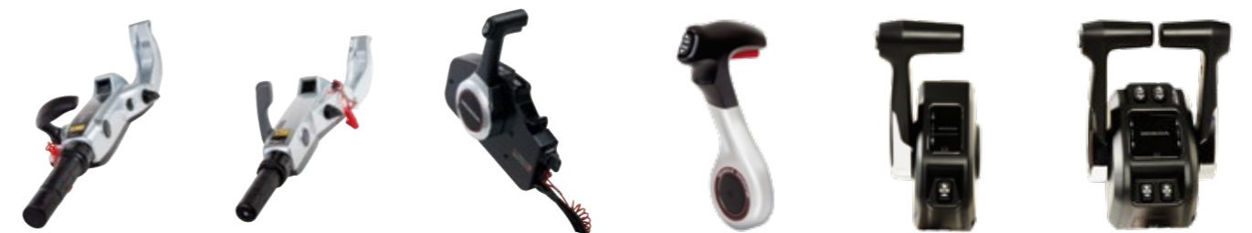
MULTIFUNKTIONS-STEUERPINNE (BF60A & BFP60A)

Die ergonomisch gestalteten Pinnen und Fernbedienungen ermöglichen eine präzise und mühelose Kontrolle.