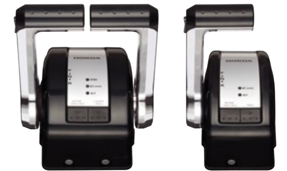
HONDA IST (DBW) DOPPEL-TOP AUFBAU-BOX

Die neuen BF115-350 DBW Modelle können mit 3 verschiedenen Schaltsystemen bestellt werden, Honda DBW (Single), Honda DBW (Twin) und Honda Seitenmontage verdeckt (nicht abgebildet). Die Vorteile: Keine Schaltkabel, verzögerungsfreie Schalt- und Gasbetätigung, Ausfallsicherheit durch 2 Datenabgleichssysteme. Das DBW bietet alle Eigenschaften, die sich Bootsfahrer wünschen, einschließlich schnellem Leerlauf, Trolling Steuerung und Motordrehzahl sowie Trimm synchronisation (bis zu 4 Motoren).