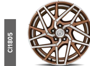
C11806 18"-Komplettradsatz in Gunpowder Black mit partieller Frontpolierung sowie mattem Klarlack und rotem Felgenrand.