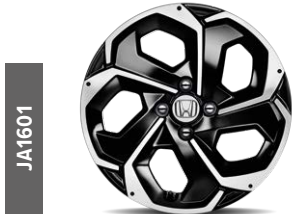
JA1601 16"-Leichtmetallfelge mit modernem 5-Speichen-Design mit Fenstern in Gunpowder Black sowie einer Diamond Cut A-Oberfläche in glänzendem Klarlack-Finish.

Auch als Sonderausstattung ab Werk erhältlich.