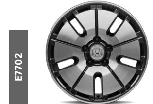
E7702 17"-Leichtmetallfelgenset in futuristischem Design mit Diamond Cut A-Oberfläche und Fenstern in Gunpowder Black.*

Auch als Sonderausstattung ab Werk erhältlich.