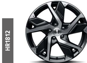
HR1812 18"-Leichtmetallfelge mit einer Diamond Cut A-Oberfläche und glänzenden, klar beschichteten Gunpowder Black-Akzenten.

Auch als Sonderausstattung ab Werk erhältlich.