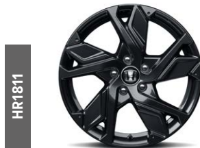
HR1811 18"-Leichtmetallfelge ganz in Gunpowder Black gehalten, mit Glanzlackversiegelung.

Auch als Sonderausstattung ab Werk erhältlich.