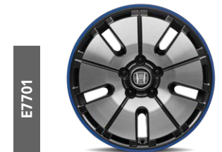
E7701 17"-Leichtmetallfelgenset in futuristischem Design mit Diamond Cut A-Oberfläche, mit Fenstern in Gunpowder Black und blauem Felgenrand.*

Auch als Sonderausstattung ab Werk erhältlich.