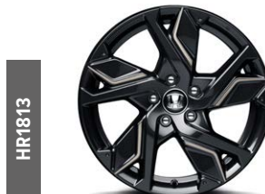
HR1813 18"-Leichtmetallfelge in Gunpowder Black lackiert mit Glanzlackversiegelung und Akzenten in Ilmenite Titanium.

Auch als Sonderausstattung ab Werk erhältlich.