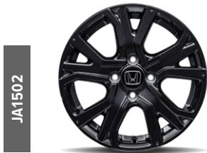
JA1502 15"-Leichtmetallfelge in modernem 5-Doppelspeichen-Design mit Lackierung in Gunpowder Black und glänzendem Klarlack-Finish.