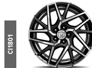
C11801 18"-Komplettradsatz in Gunpowder Black und partieller Frontpolierung mit glänzendem Klarlack.