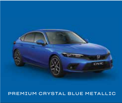
PREMIUM CRYSTAL BLUE METALLIC